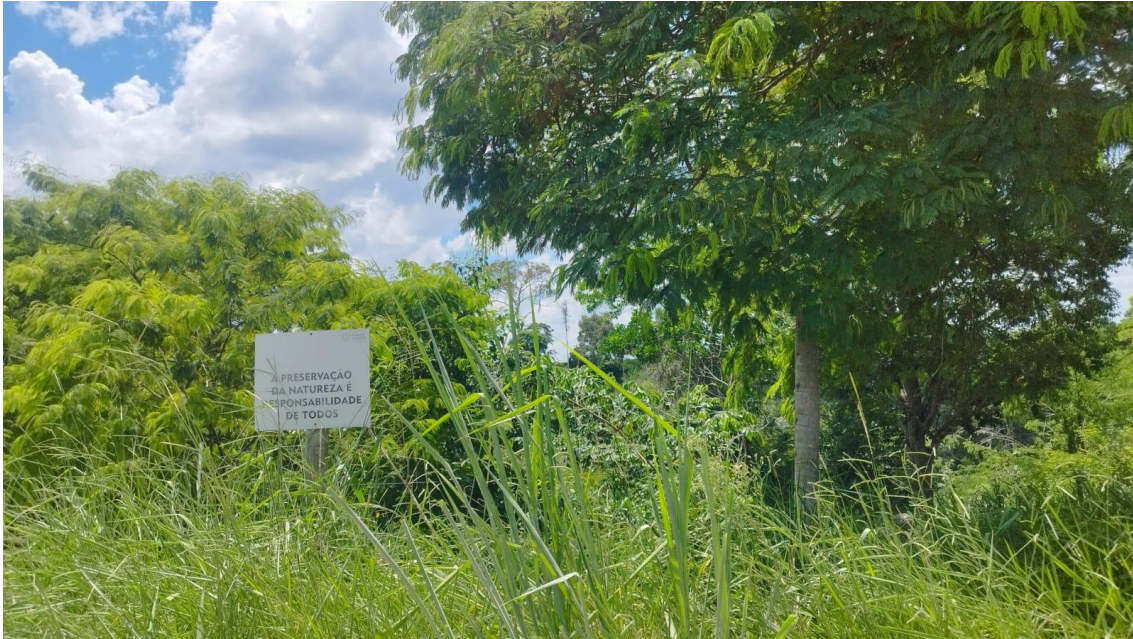
Figuras 01 a 10: vista do local onde está implantado o PRAD