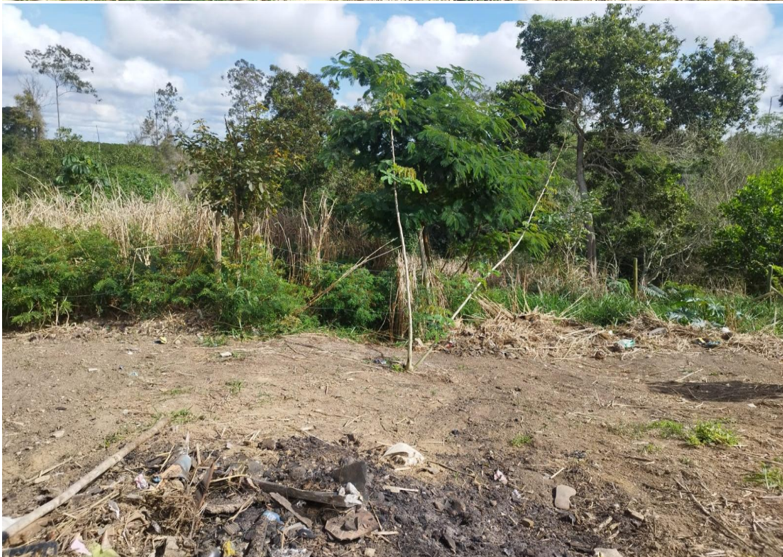
Figura:13 a 22 Registro fotográfico da Roçada na área do PRAD, em 14/08/2025