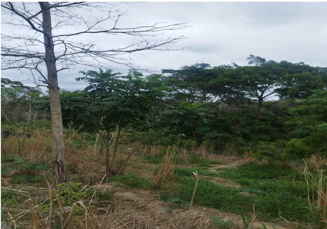
Figura 1 e 2 – Vista geral da APP.