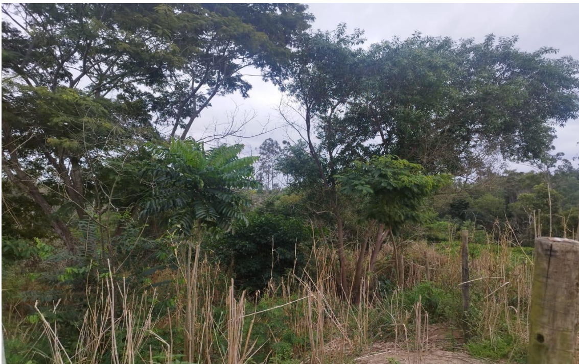
Figura 4 – Presença de espécies nativas em crescimento.