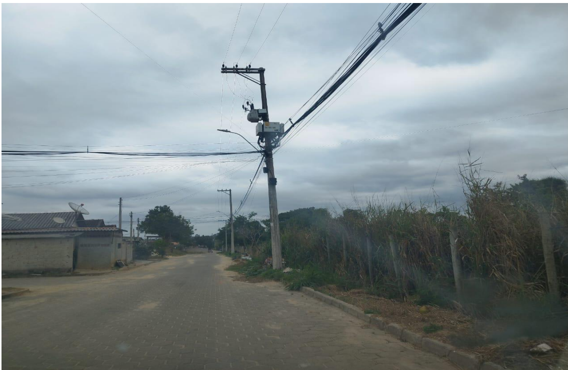
Figura: 9,10,11 e 12– Registro fotográfico da área do PRAD