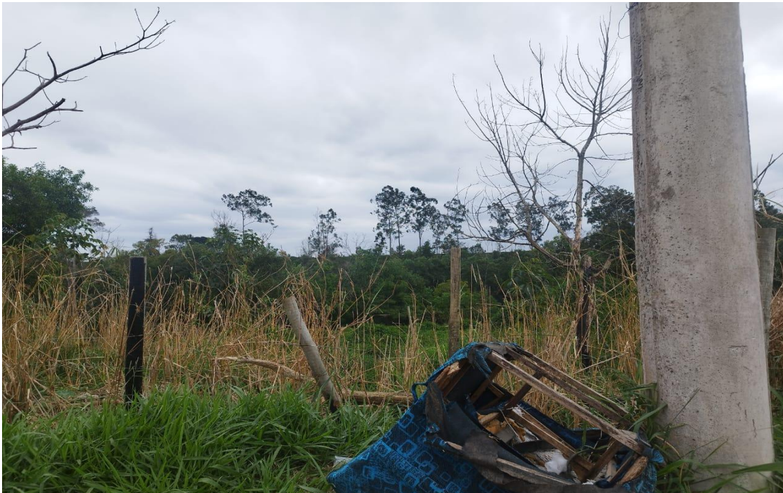
Figura 6 e 7 – Área com descarte irregular