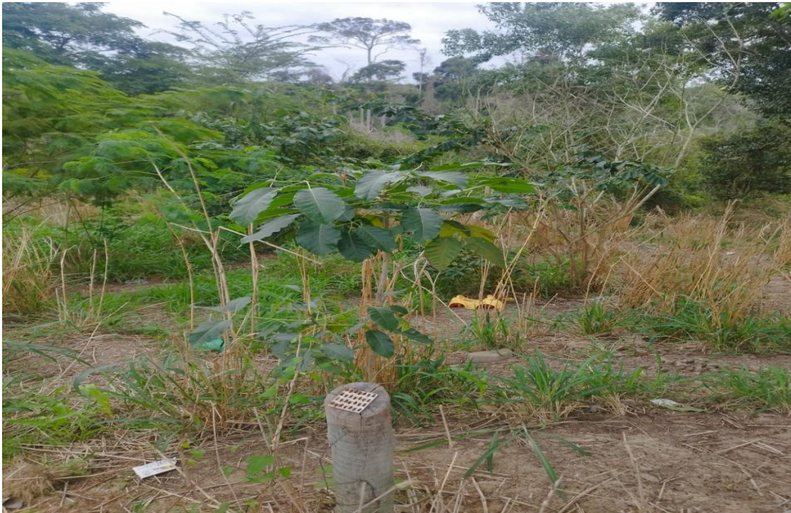
Figura 3 – Detalhe da regeneração natural.