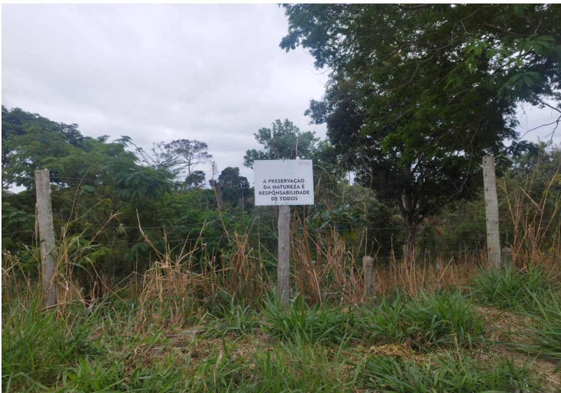
Figura 8 – Área com cercamento e placas informativas