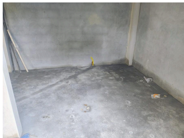
Foto 2 - Execução de Contrapiso