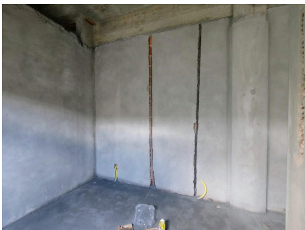
Foto 5 - Execução de instalações hidráulicas e elétricas