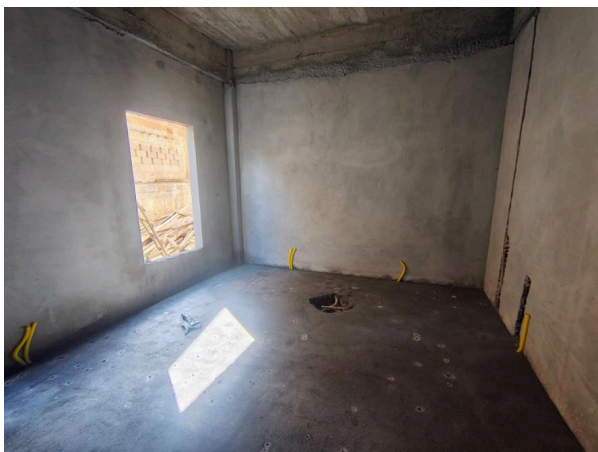
Foto 3 - Execução de Contrapiso