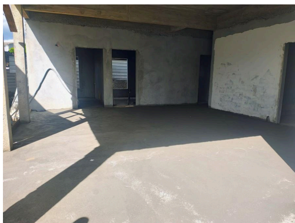
Foto 1 - Execução de Contrapiso