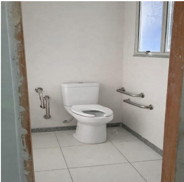
07.03.03 BARRA DE APOIO RETA, EM AÇO INOX POLIDO, COMPRIMENTO 80 CM, FIXADA NA PAREDE - FORNECIMENTO E INSTALAÇÃO. AF_01/2020