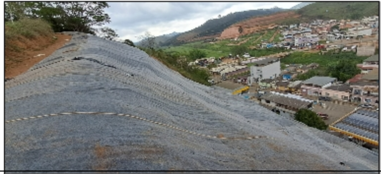
AREA DE FESTA DE MUNDO NOVO (CONCLUIDA)