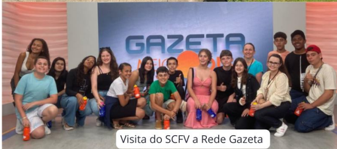
Visita do SCFV a Rede Gazeta