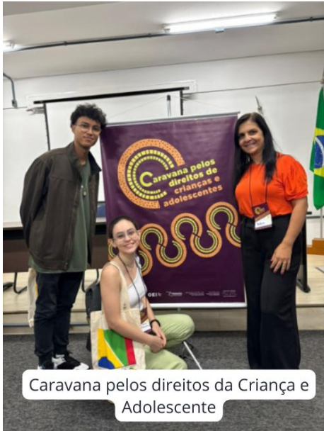
Caravana pelos direitos da Criança e Adolescente