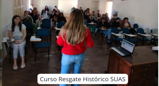
Curso Resgate Histórico SUAS