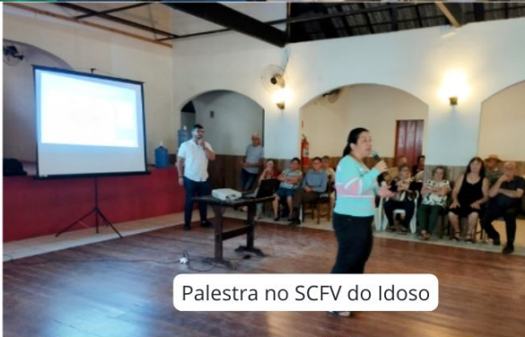
Palestra no SCFV do Idoso