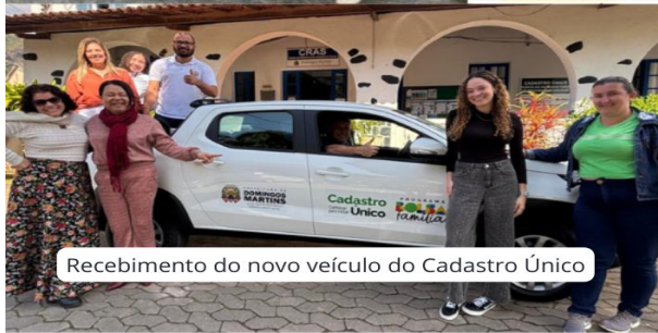
Recebimento do novo veículo do Cadastro Único