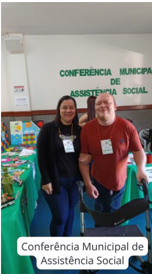
Conferência Municipal de Assistência Social