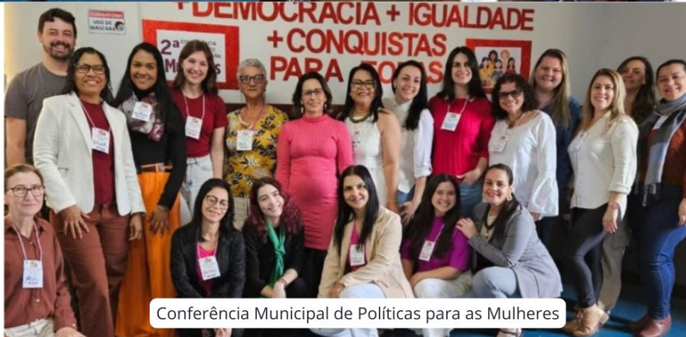
Conferência Municipal de Políticas para as Mulheres