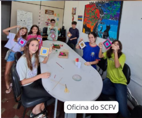
Oficina do SCFV