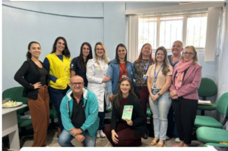
Reunião de Rede Intersetorial de Aracê