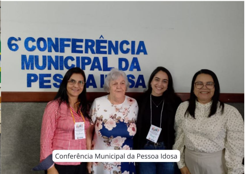
Conferência Municipal da Pessoa Idosa