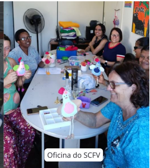
Oficina do SCFV