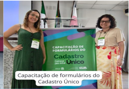
Capacitação de formulários do Cadastro Único