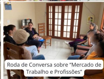
Roda de Conversa sobre "Mercado de Trabalho e Profissões"