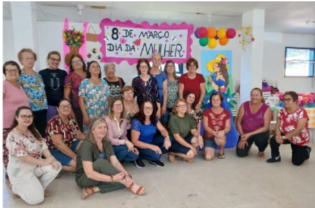
Ação do SCFV em alusão ao Dia da Mulher