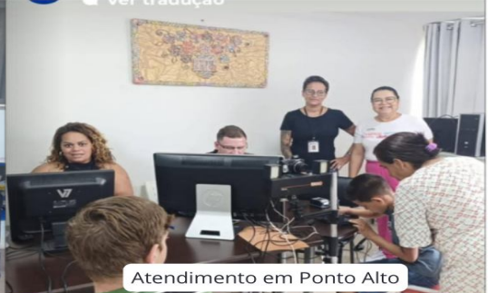
Atendimento em Ponto Alto