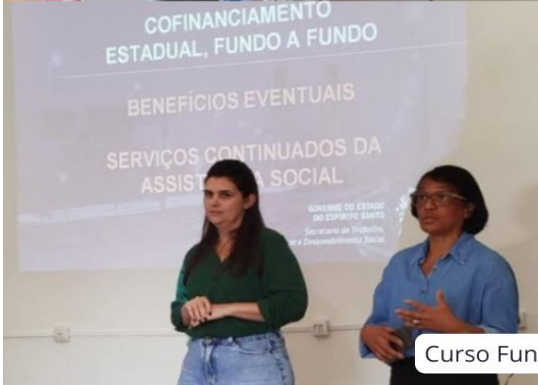
Curso Fundo Estadual