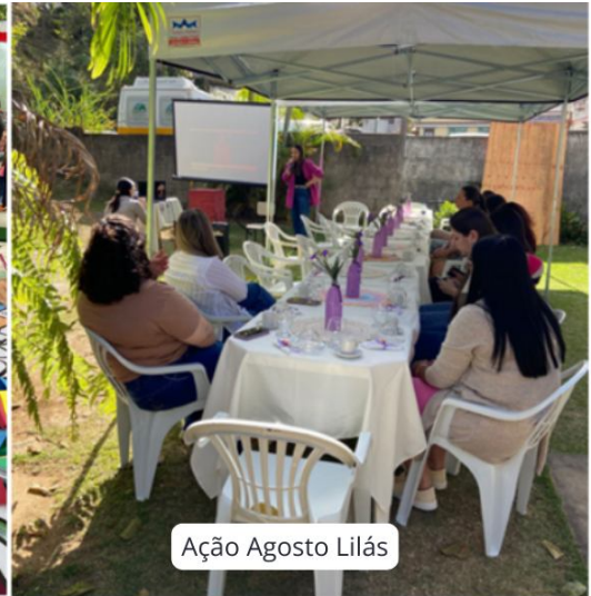
Ação Agosto Lilás