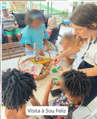
Visita à Sou Feliz