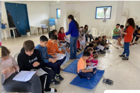
Oficinas do SCFV