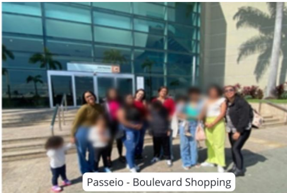
Passeio - Boulevard Shopping