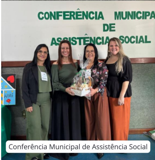
Conferência Municipal de Assistência Social