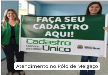
Atendimento no Pólo de Melgaço