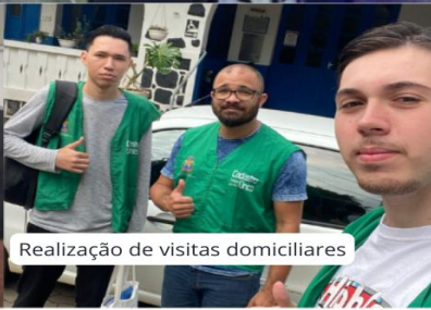
Realização de visitas domiciliares