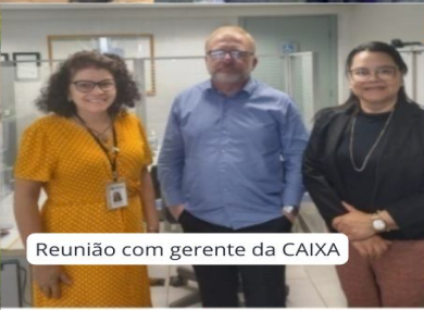
Reunião com gerente da CAIXA