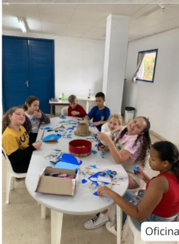
Oficinas do SCFV