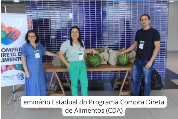
eminário Estadual do Programa Compra Direta de Alimentos (CDA)