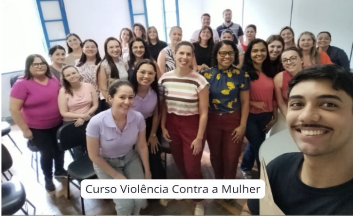
Curso Violência Contra a Mulher