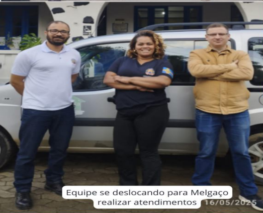
Equipe se deslocando para Melgaço realizar atendimentos 16/05/2026