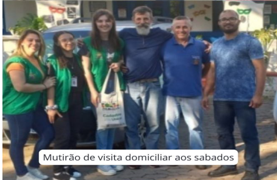
Mutirão de visita domiciliar aos sábados