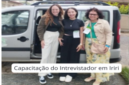
Capacitação do Entrevistador em Iriri