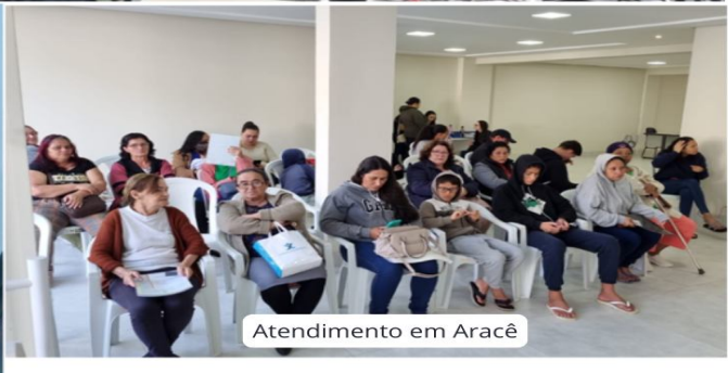
Atendimento em Aracê