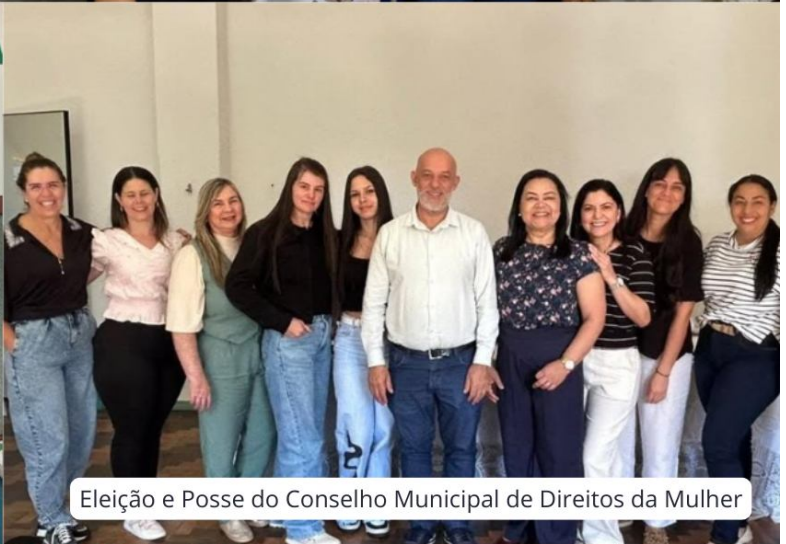
Eleição e Posse do Conselho Municipal de Direitos da Mulher