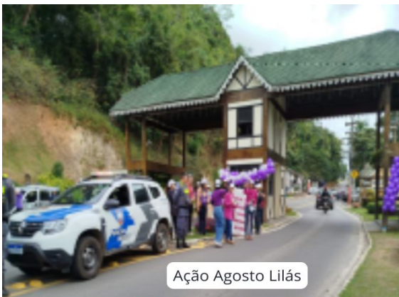
Ação Agosto Lilás