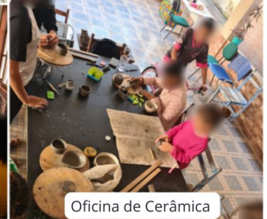
Oficina de Cerâmica