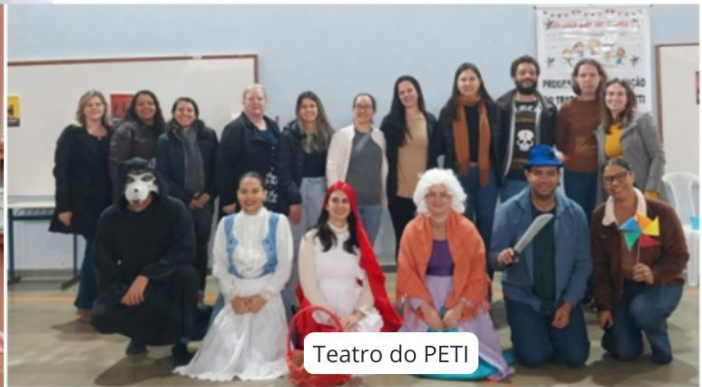
Teatro do PETI