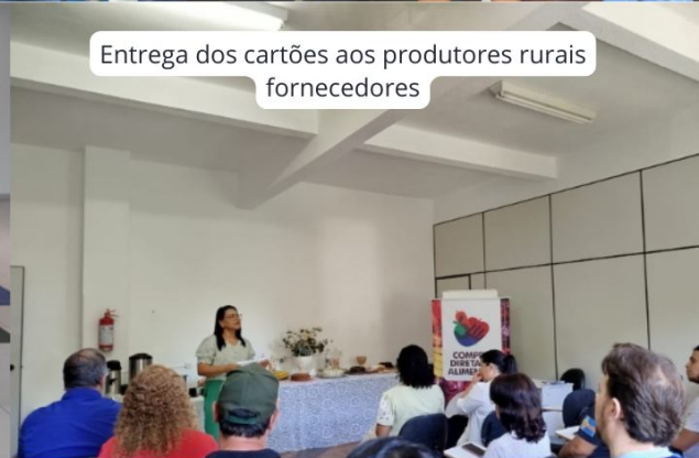
Entrega dos cartões aos produtores rurais fornecedores