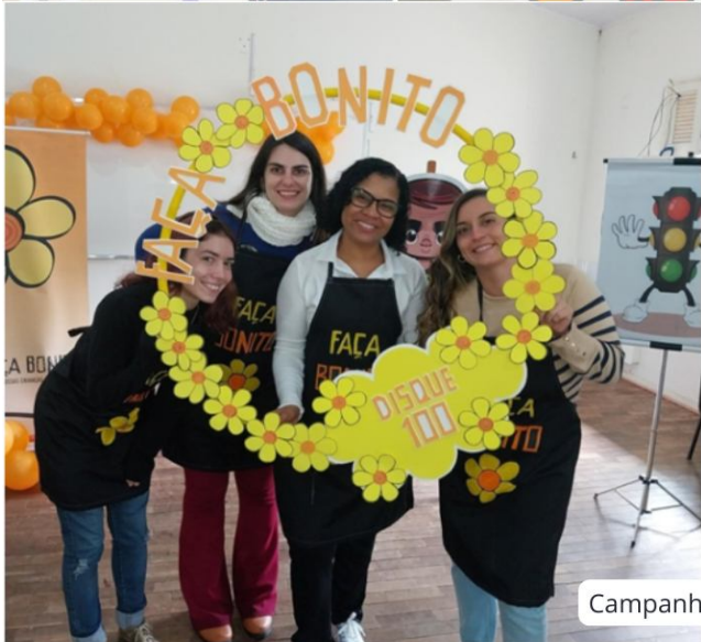
Campanha Faça Bonito