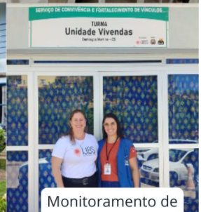
Monitoramento de entidade parceira