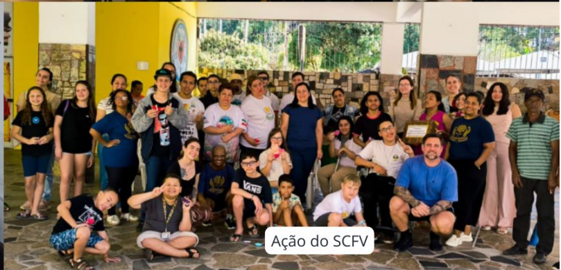
Ação do SCFV