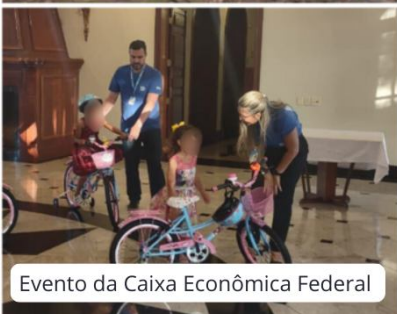
Evento da Caixa Econômica Federal