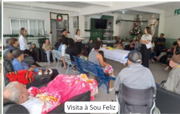
Visita à Sou Feliz