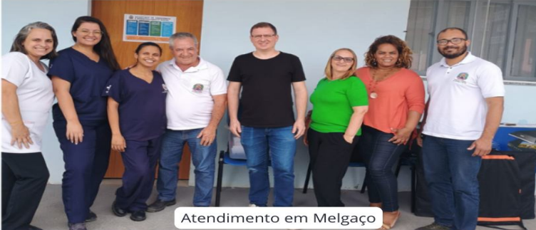
Atendimento em Melgaço