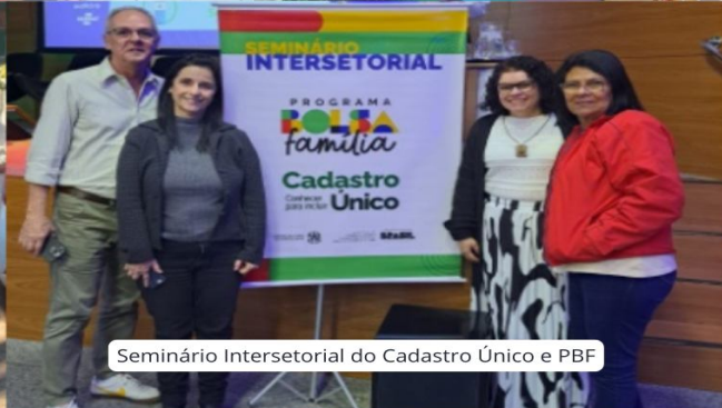
Seminário Intersectorial do Cadastro Único e PBF