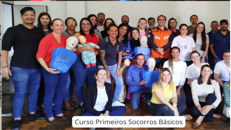
Curso Primeiros Socorros Básicos