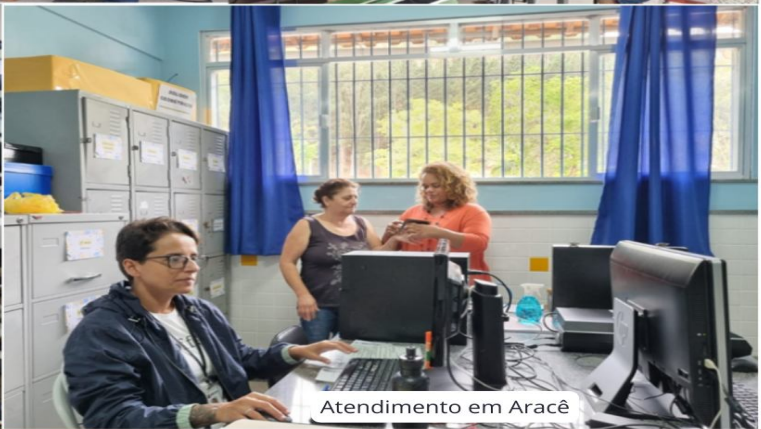
Atendimento em Aracê