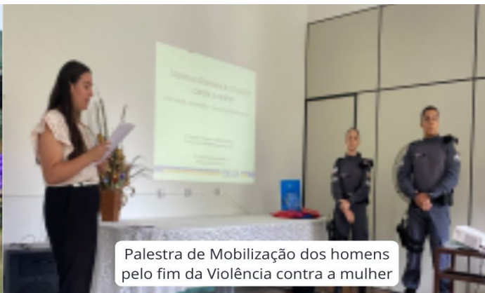
Palestra de Mobilização dos homens pelo fim da Violência contra a mulher