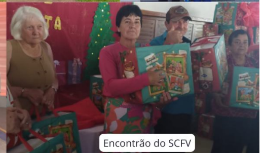
Encontrão do SCFV