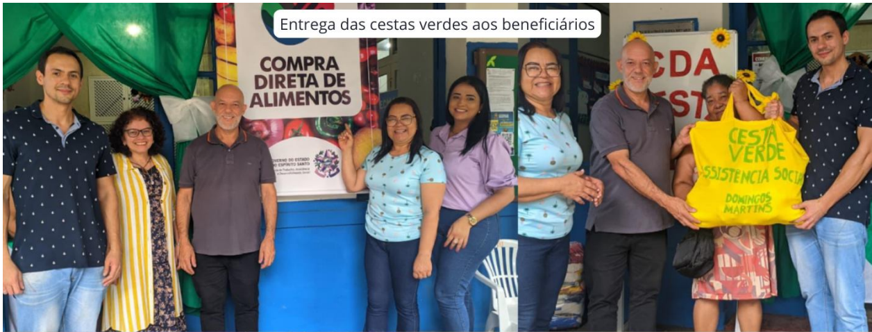
Entrega das cestas verdes aos beneficiários