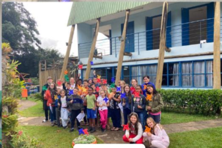
Ação do SCFV