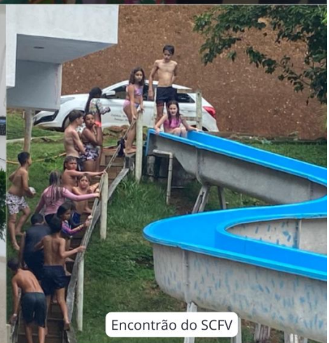
Encontrão do SCFV