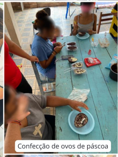
Confecção de ovos de páscoa