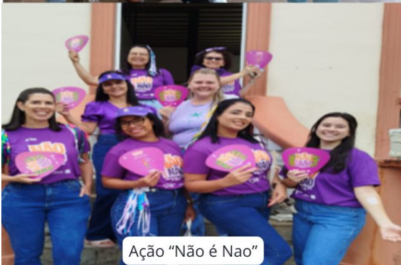
Ação "Não é Nao"