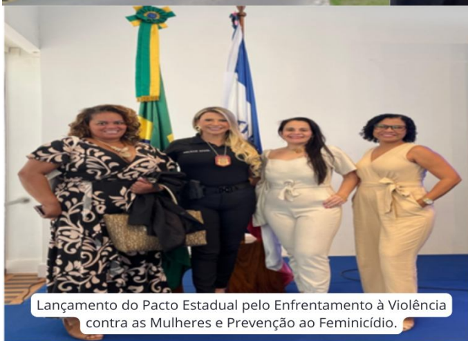
Lançamento do Pacto Estadual pelo Enfrentamento à Violência contra as Mulheres e Prevenção ao Femicídio.