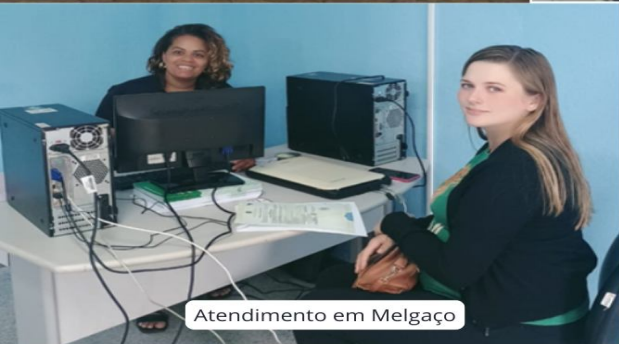
Atendimento em Melgaço