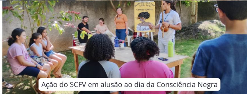
Ação do SCFV em alusão ao dia da Consciência Negra