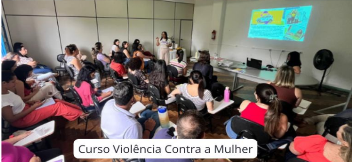
Curso Violência Contra a Mulher