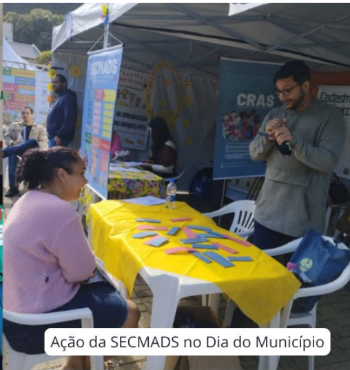
Ação da SECMADS no Dia do Município