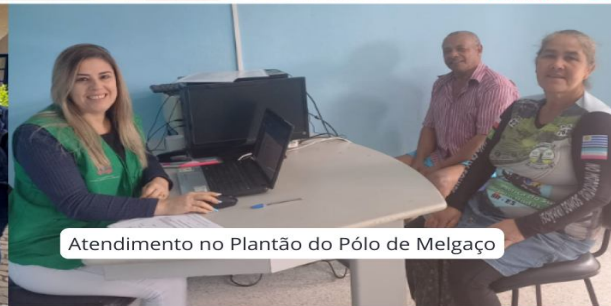
Atendimento no Plantão do Pólo de Melgaço