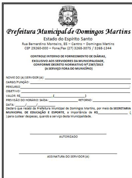
Figura 3: Modelo de Solicitação de Diárias para fora do município de Domingos Martins.

comunicacao@domingosmartins.es.gov.br - gabinete@domingosmartins.es.gov.br