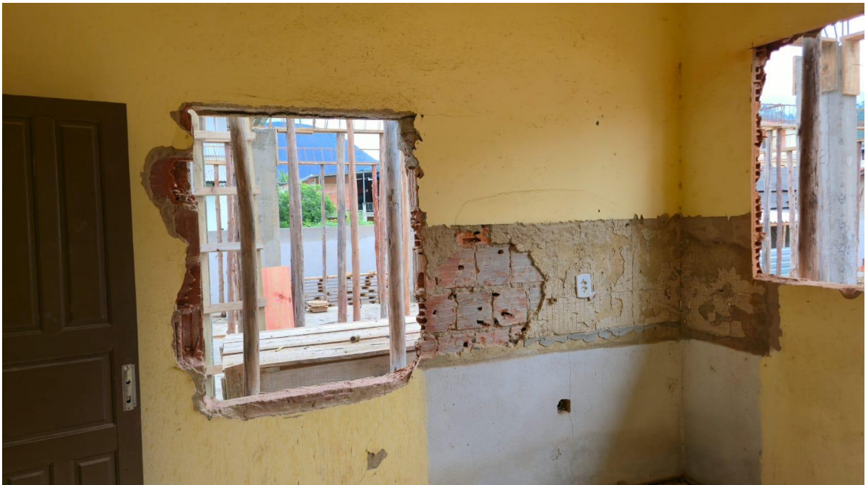
Imagem 05: Detalhe para a remoção dos revestimentos de azulejos da cozinha.