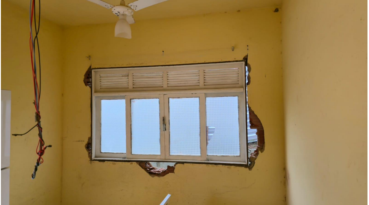
Imagem 04: Detalhe para a remoção da janela.