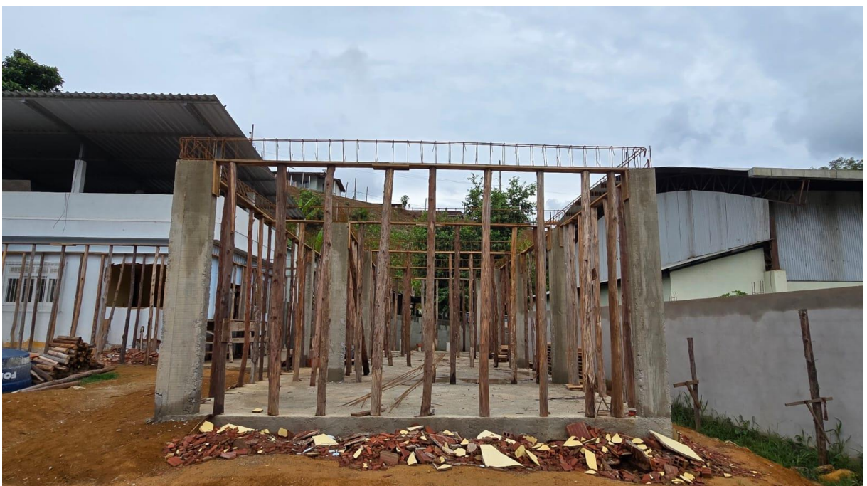
Imagem 09: Detalhe para a montagem e desmontagem de fôrma de pilares retangulares, fornecimento, dobragem e colocação em fôrmas e fornecimento e aplicação de concreto usinado (Superestrutura).