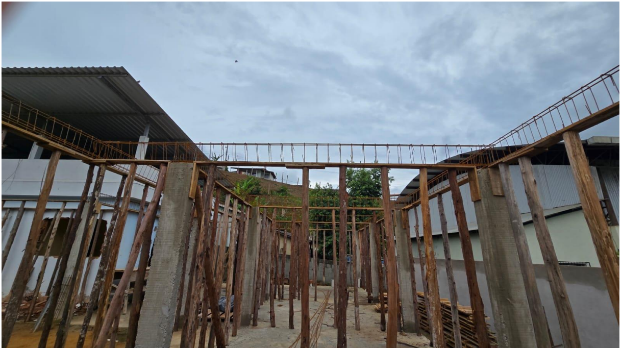
Imagem 08: Detalhe para a montagem e desmontagem de fôrma de pilares retangulares, fornecimento, dobragem e colocação em fôrmas e fornecimento e aplicação de concreto usinado (Superestrutura).