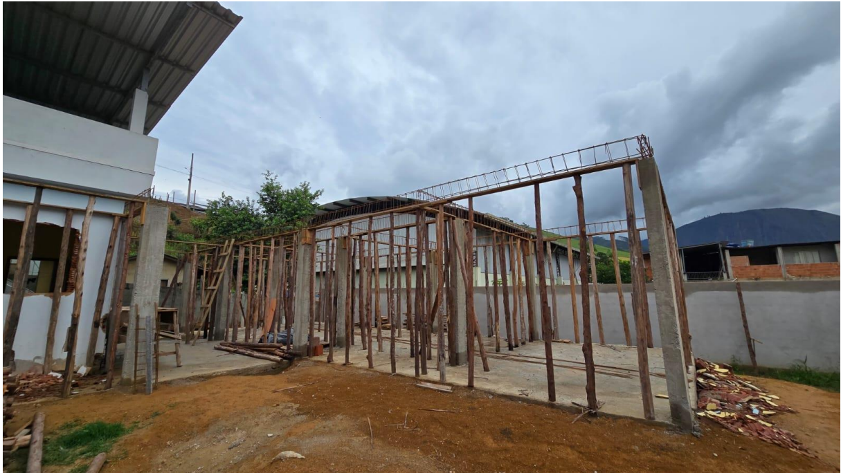
Imagem 10: Detalhe para a montagem e desmontagem de fôrma de pilares retangulares, fornecimento, dobragem e colocação em fôrmas e fornecimento e aplicação de concreto usinado (Superestrutura).

Firmo o presente relatório para os devidos fins.