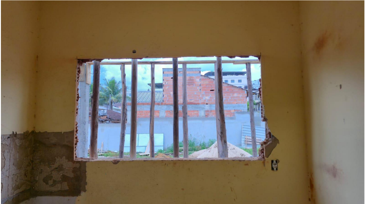
Imagem 02: Detalhe para a remoção da janela.