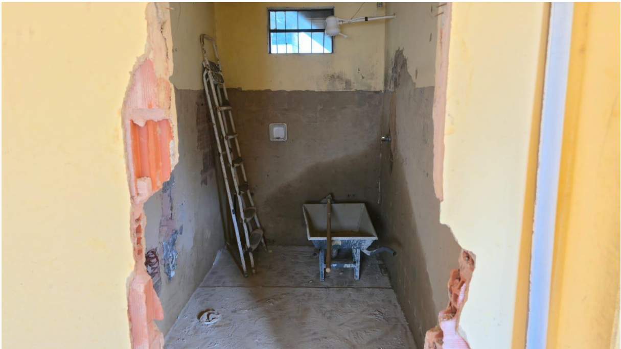
Imagem 06: Detalhe para a remoção dos revestimentos de azulejos do banheiro.