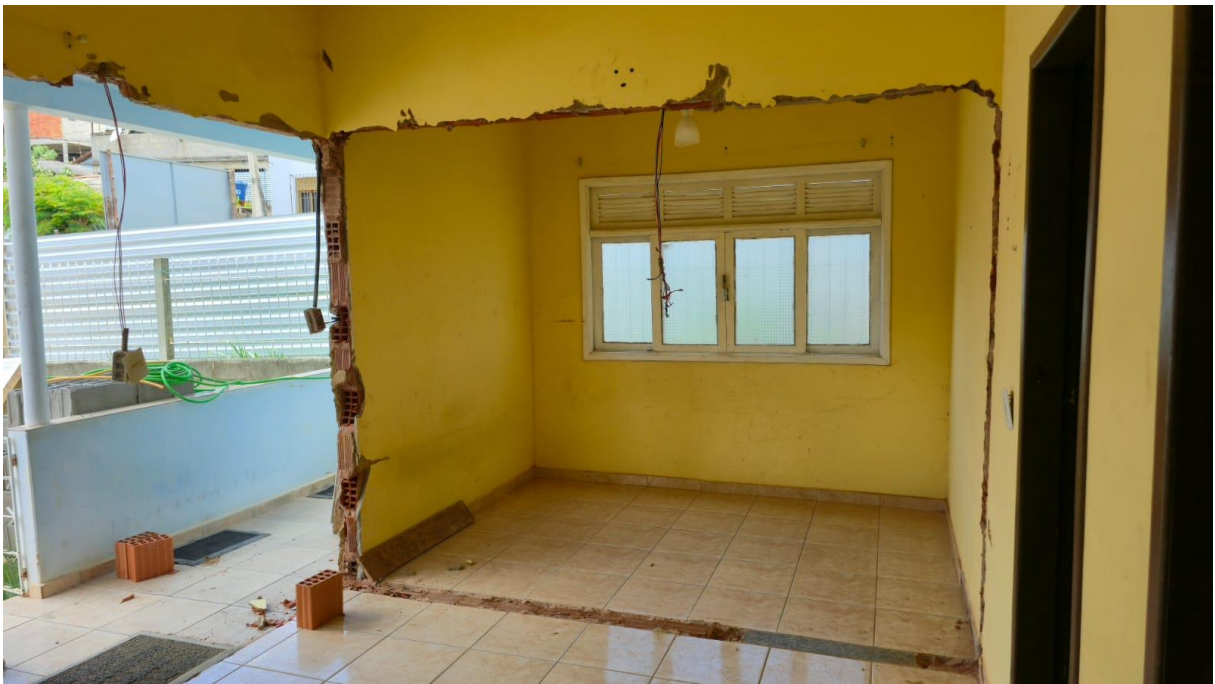
Imagem 01: Detalhe para a remoção de porta e janela da sala de TV e remoção da porta do quarto 01.