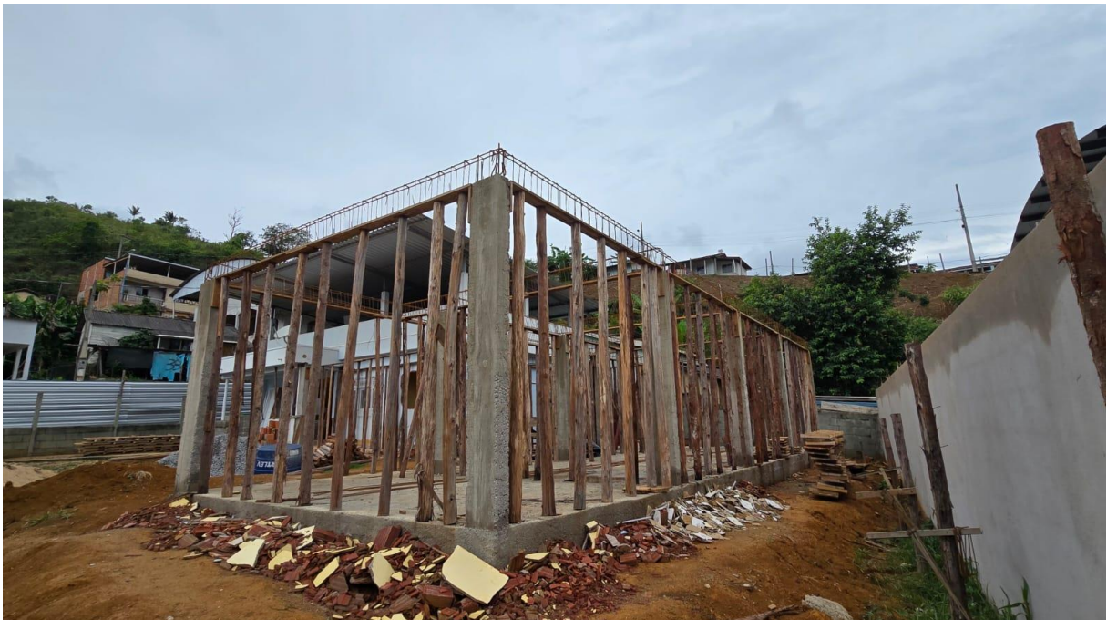
Imagem 07: Detalhe para a montagem e desmontagem de fôrma de pilares retangulares, fornecimento, dobragem e colocação em fôrmas e fornecimento e aplicação de concreto usinado (Superestrutura).