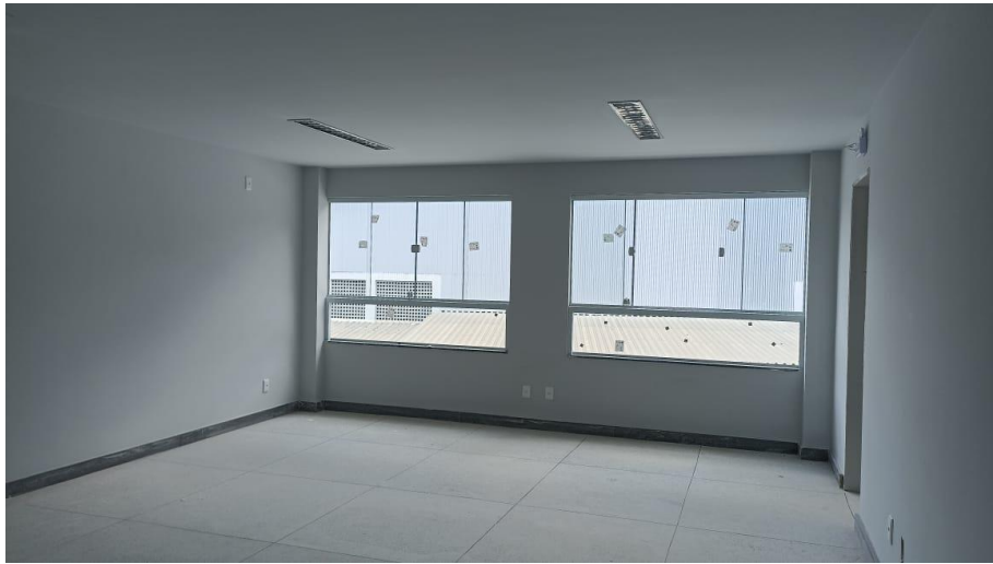
Figura 9 - Detalhe para forro de gesso, paredes emassadas e pinturas