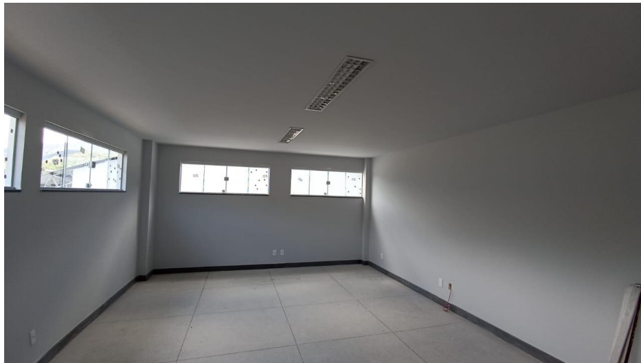
Figura 10 - Detalhe para forro de gesso, paredes emassadas e pinturas