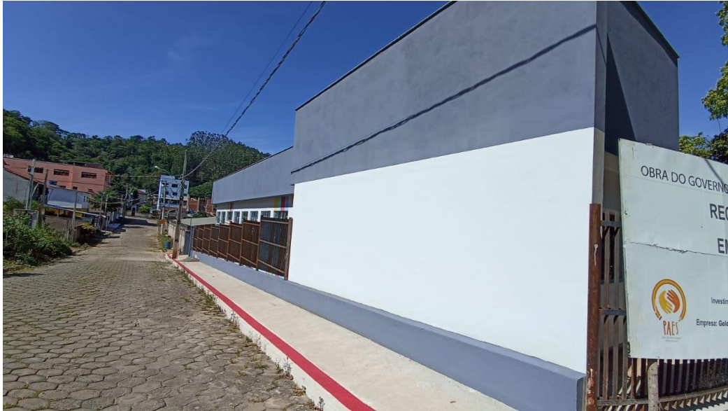
Figura 17 - Detalhe para pintura externa