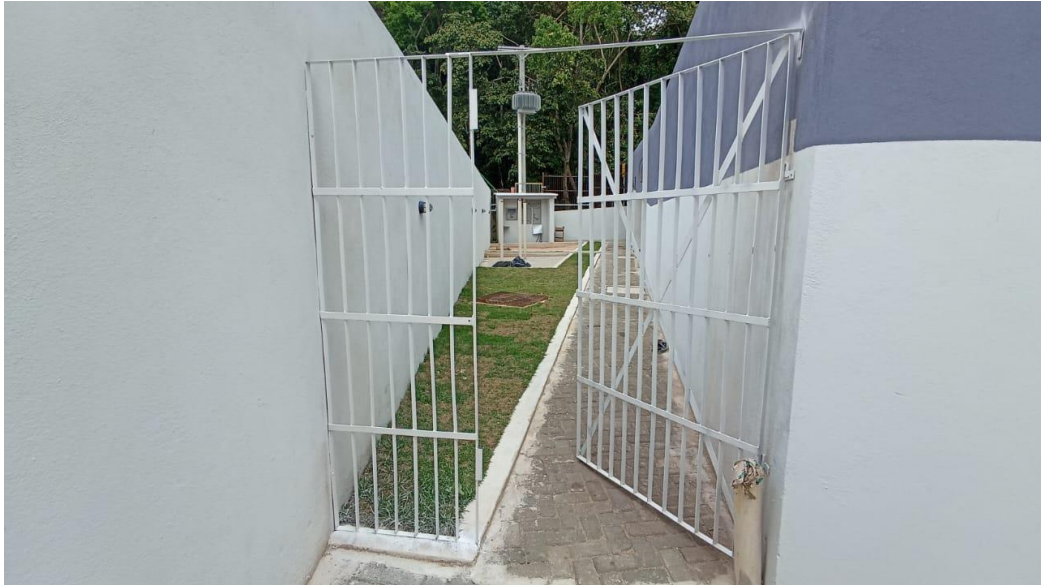
Figura 23 - Detalhe para portão de ferro instalado