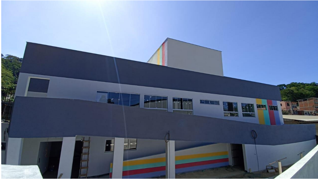
Figura 19 - Detalhe para pintura externa