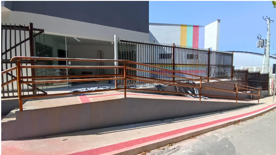
Figura 12 - Detalhe para guarda-corpo da rampa de entrada