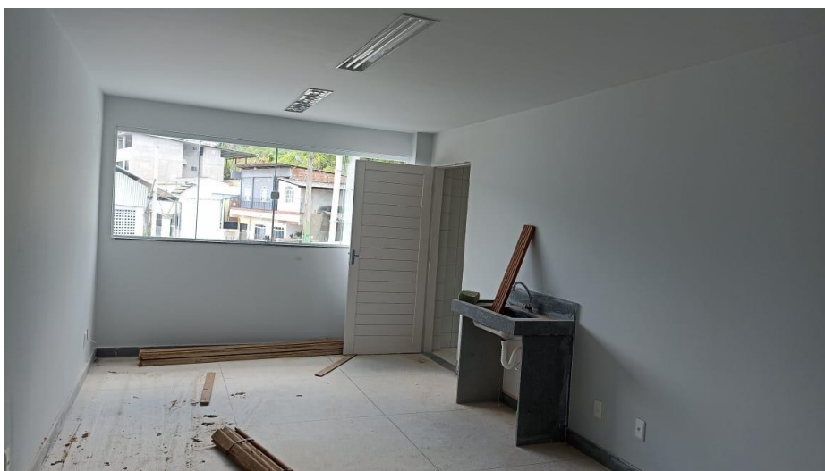
Figura 2 – Detalhe para bancada em granito, torneira e cuba da sala dos professores