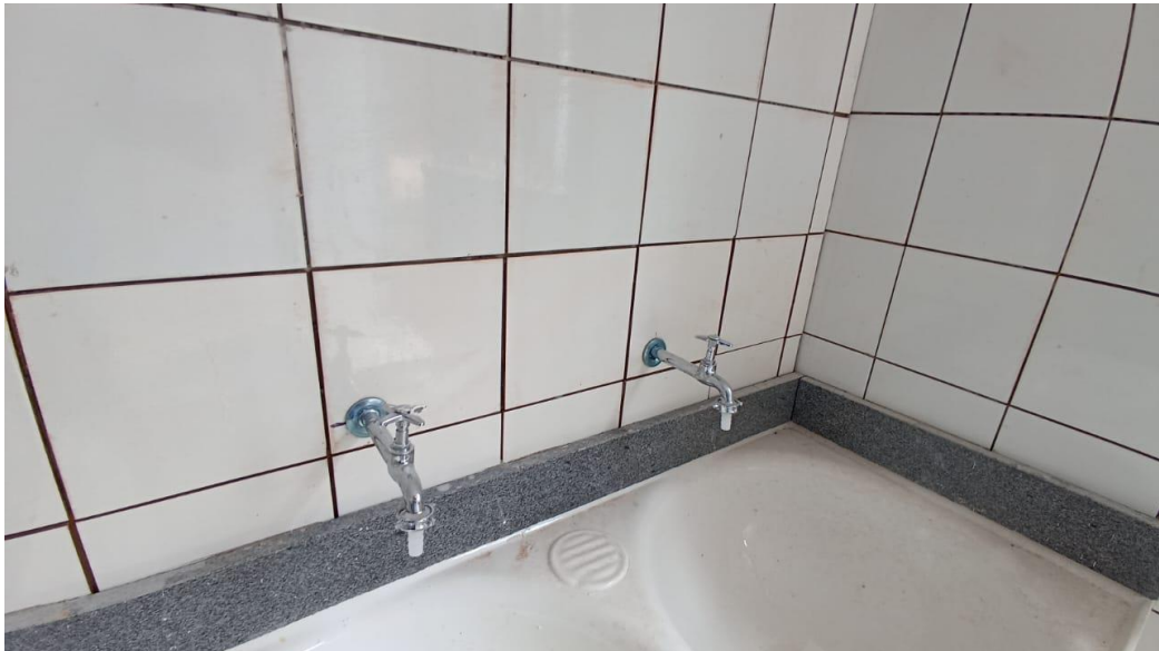
Figura 28 - Detalhe para tanque em mármore sintético duplo da área da lavanderia