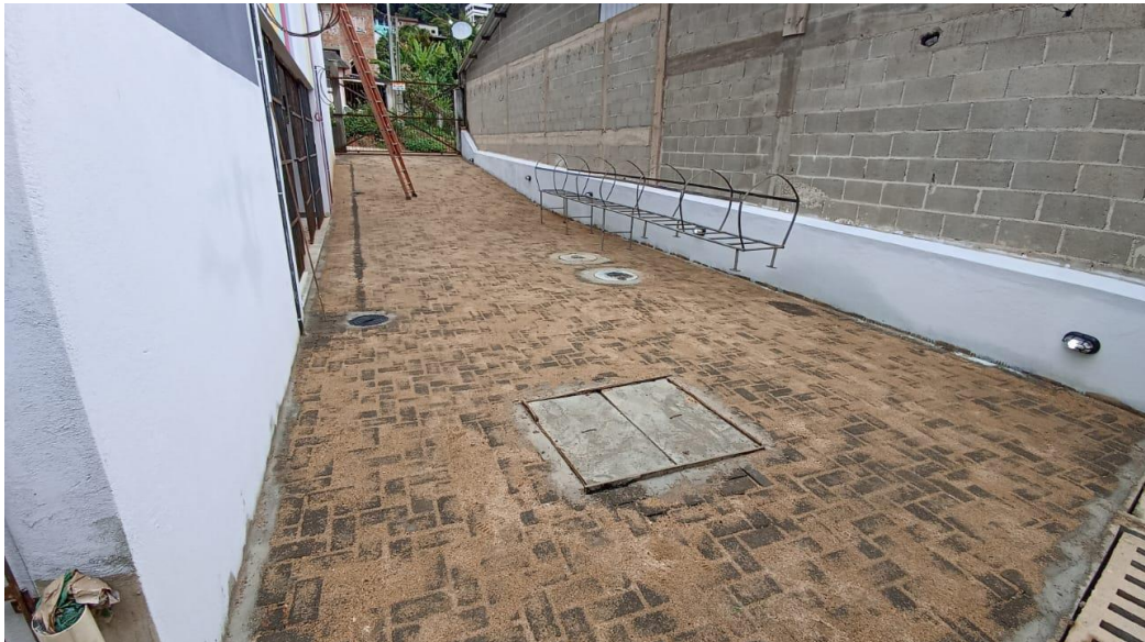
Figura 22 – Detalhe para pavimentação em blocos de concreto