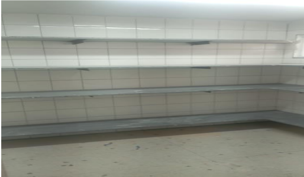
Figura 25 - Detalhe para revestimento das paredes despensa e depósito de louças