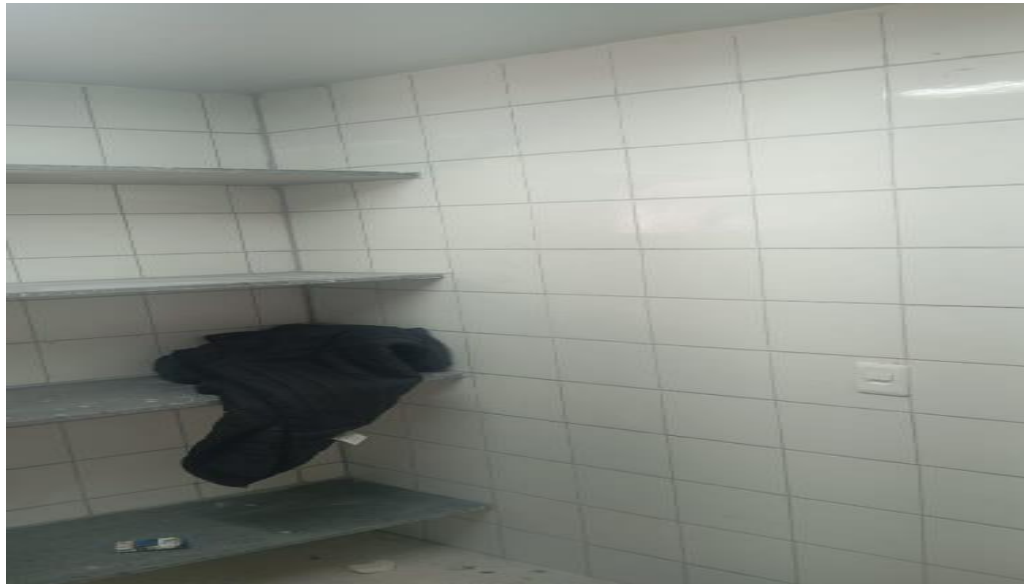
Figura 24 - Detalhe para revestimento das paredes despensa e depósito de louças