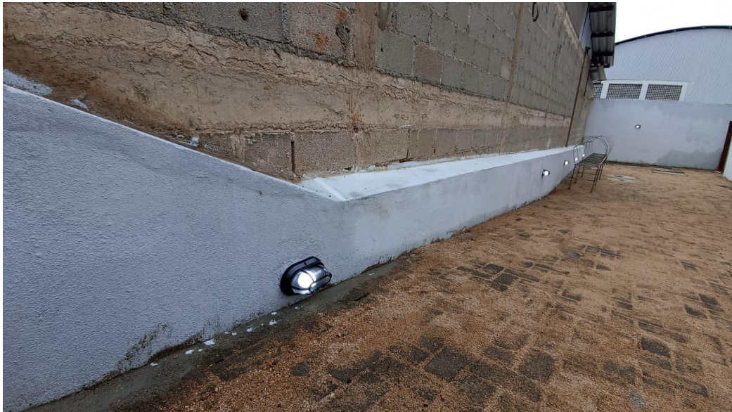
Figura 20 - Detalhe para luminária arandela tipo tartaruga