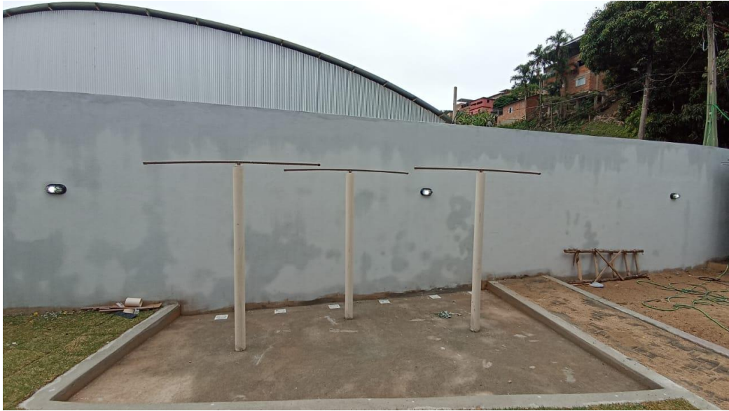
Figura 21 - Detalhe para luminária arandela tipo tartaruga