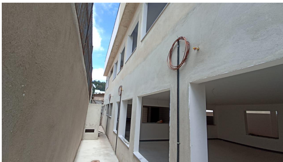
Figura 6 - Detalhe para tubo pvc rígido e cabo de cobre nu do sistema spda