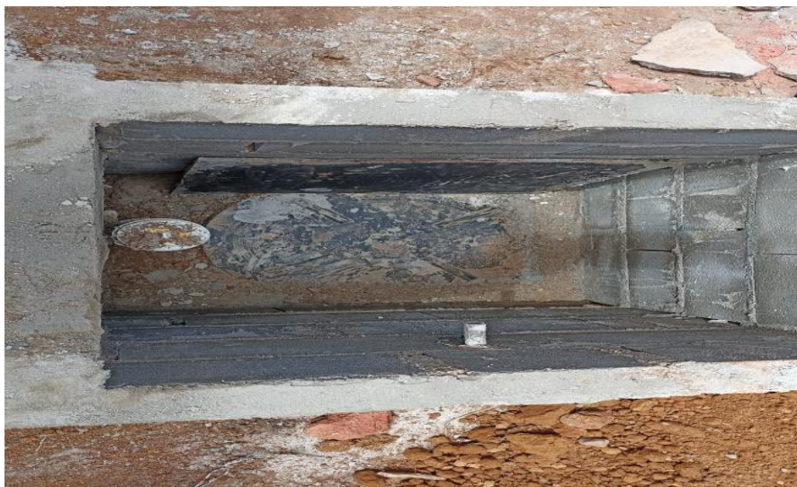
Figura 4 – Detalhe para fossa séptica biodigestor