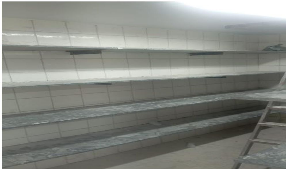
Figura 26 - Detalhe para revestimento das paredes despensa e depósito de louças