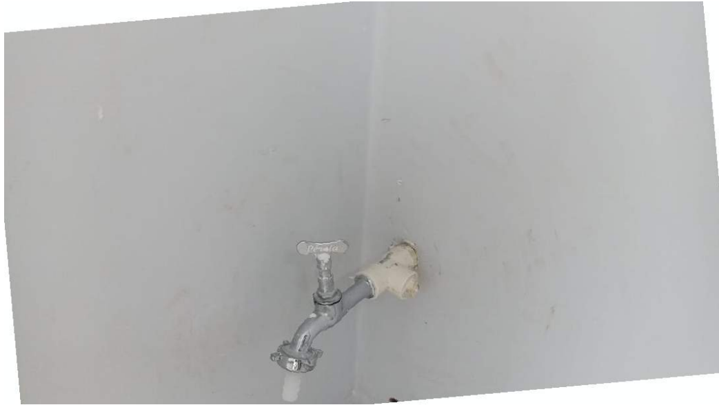
Figura 29 - Detalhe para ponto de água e torneira de jardim

Conceição do Castelo – ES, 19 de dezembro de 2025.