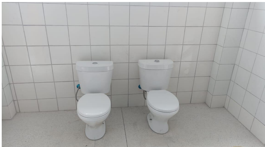
Figura 1 – Detalhe para bacias sanitárias infantis