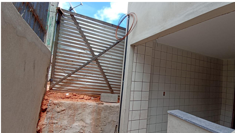
Figura 5 - Detalhe para tubo pvc rígido e cabo de cobre nu do sistema spda