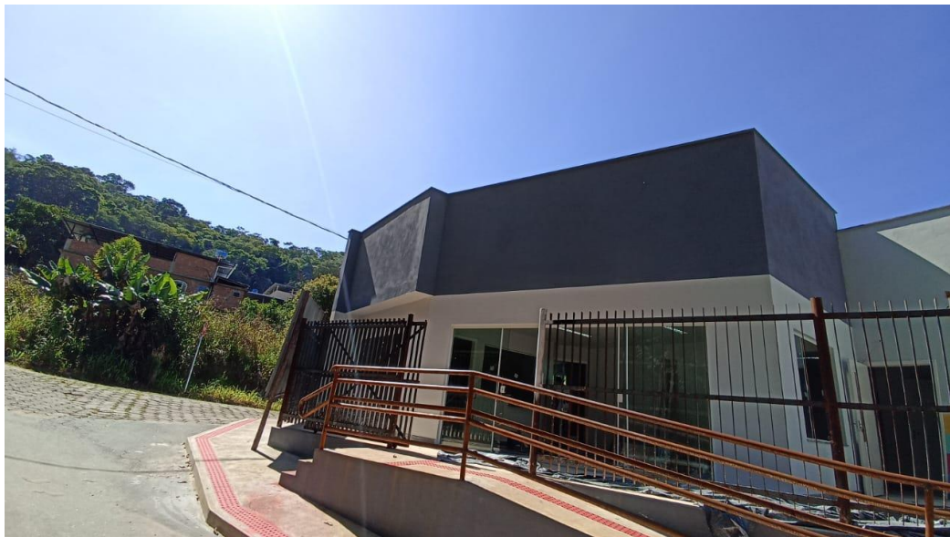
Figura 18 – Detalhe para pintura externa