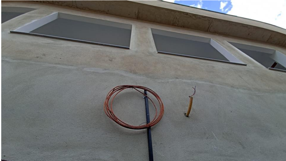
Figura 7 - Detalhe para tubo pvc rígido e cabo de cobre nu do sistema spda