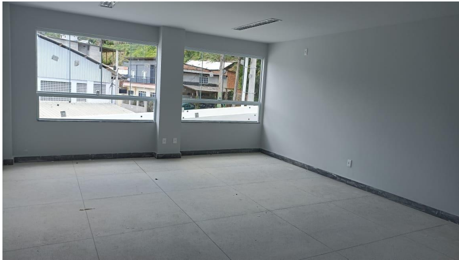
Figura 11 - Detalhe para forro de gesso, paredes emassadas e pinturas