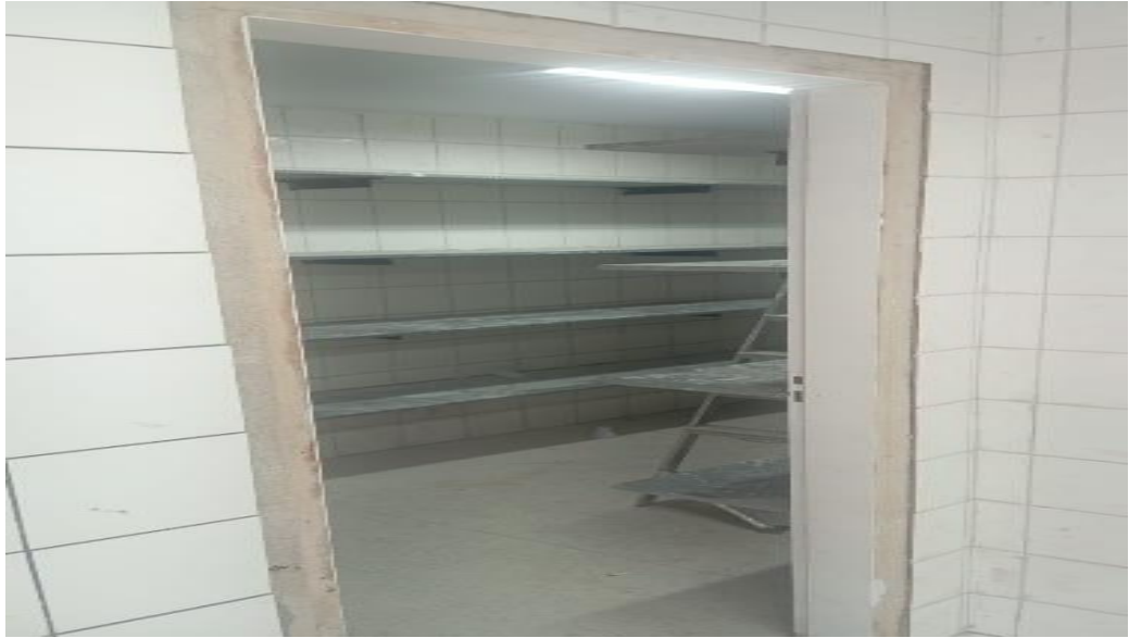
Figura 27 - Detalhe para revestimento das paredes despensa e depósito de louças