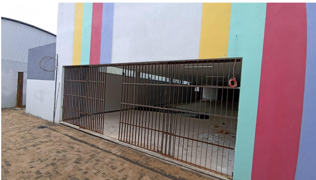
Figura 15 – Detalhe para pintura externa