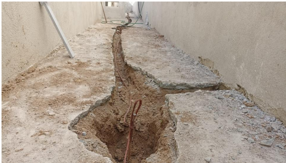
Figura 8 - Detalhe para cabo de cobre nu do sistema spda