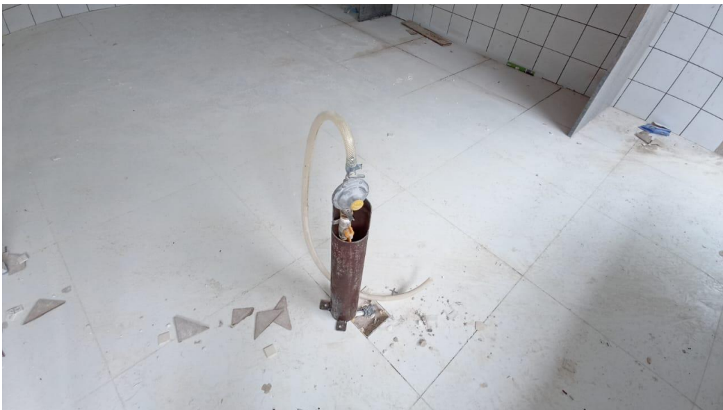
Figura 14 - Detalhe para instalação do sistema de gás em pex