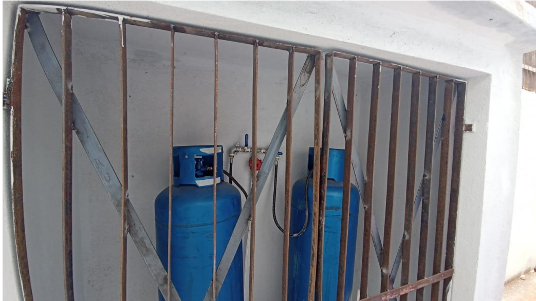
Figura 13 - Detalhe para instalação do sistema de gás em pex