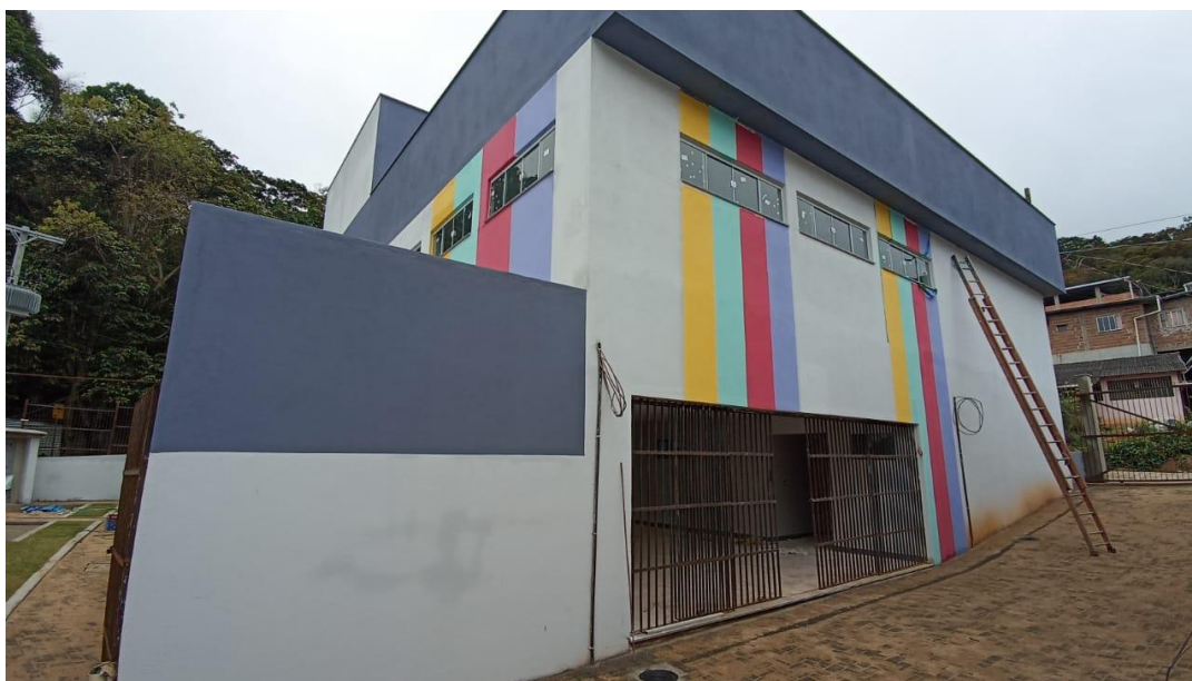
Figura 16 - Detalhe para pintura externa