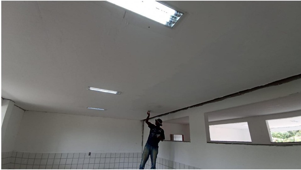
Figura 3 - Detalhe para emassamentos forro de gesso