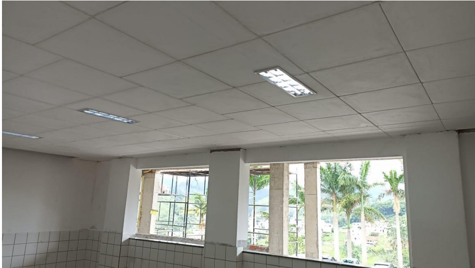
Figura 9 - Detalhe para forro de gesso