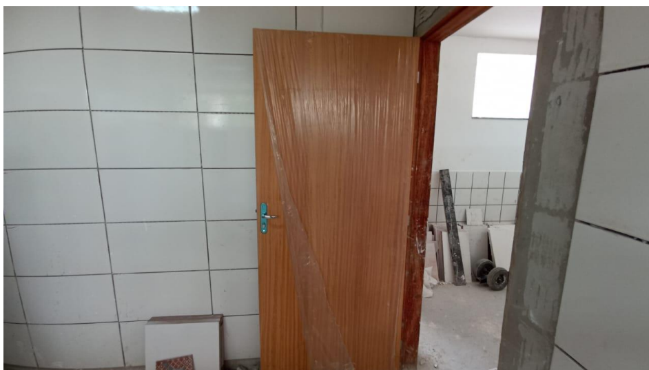
Figura 27 - Detalhe para portas instaladas