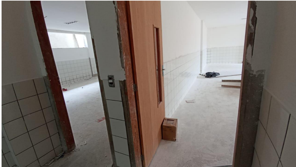
Figura 25 - Detalhe para portas instaladas