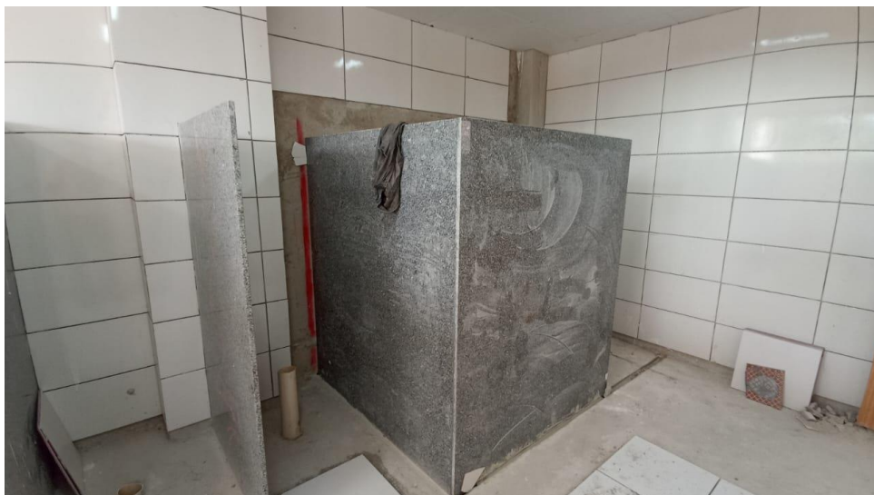
Figura 2 - Detalhe para divisórias dos banheiros