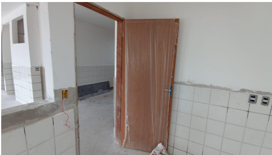
Figura 24 – Detalhe para portas instaladas