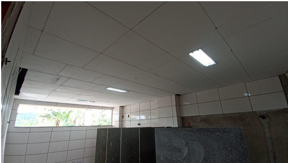
Figura 12 - Detalhe para forro de gesso e luminárias de sobrepor