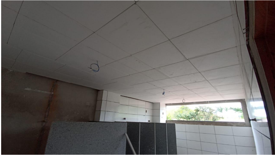
Figura 11 - Detalhe para forro de gesso