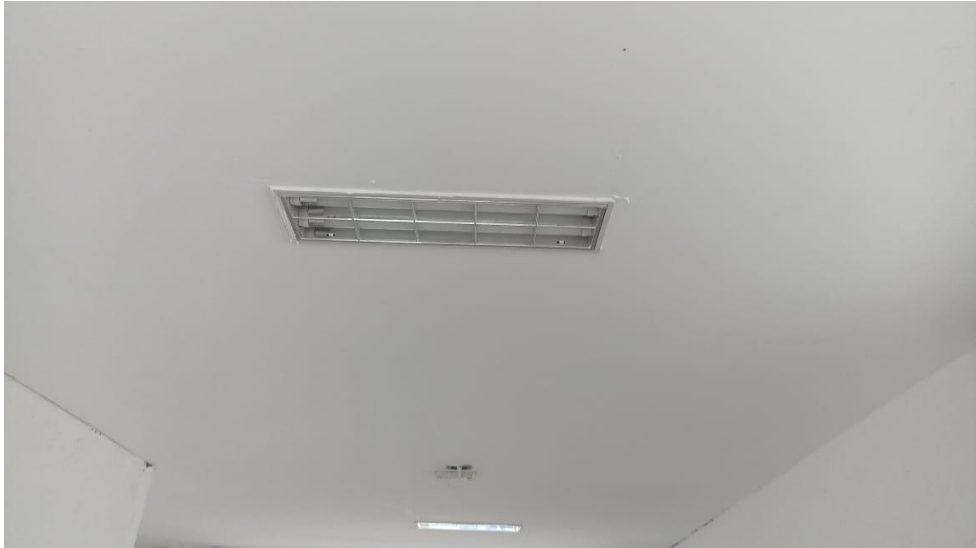
Figura 13 - Detalhe para luminárias de sobrepor