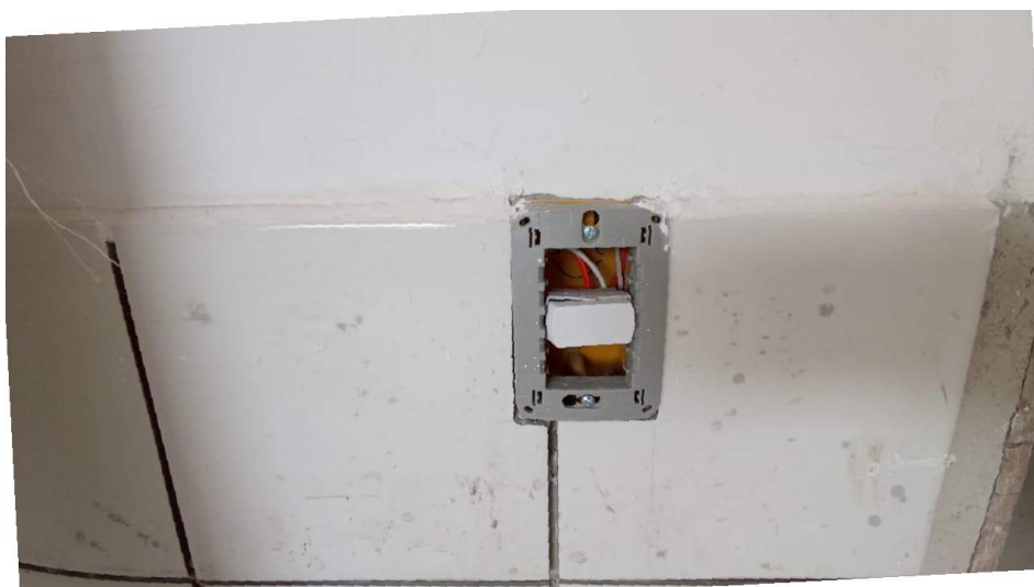
Figura 31 – Detalhe para interruptor tecla simples

Conceição do Castelo – ES, 16 de dezembro de 2025.