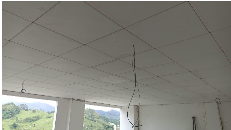
Figura 8 - Detalhe para forro de gesso