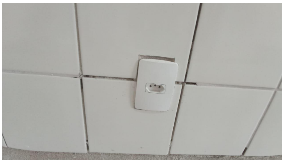
Figura 28 - Detalhe para tomada 2p + t