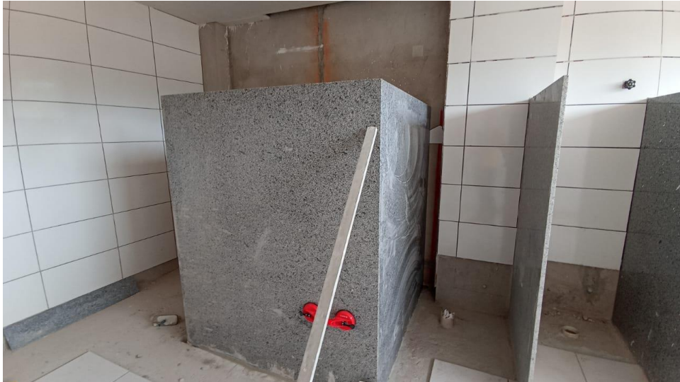
Figura 1 - Detalhe para divisórias dos banheiros

OBJETO: REFORMA E AMPLIAÇÃO DA EMEF PROFESSOR EDSON ALTOÉ CONTRATO: 023/2024