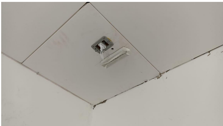
Figura 21 - Detalhe para ponto luminária de emergência