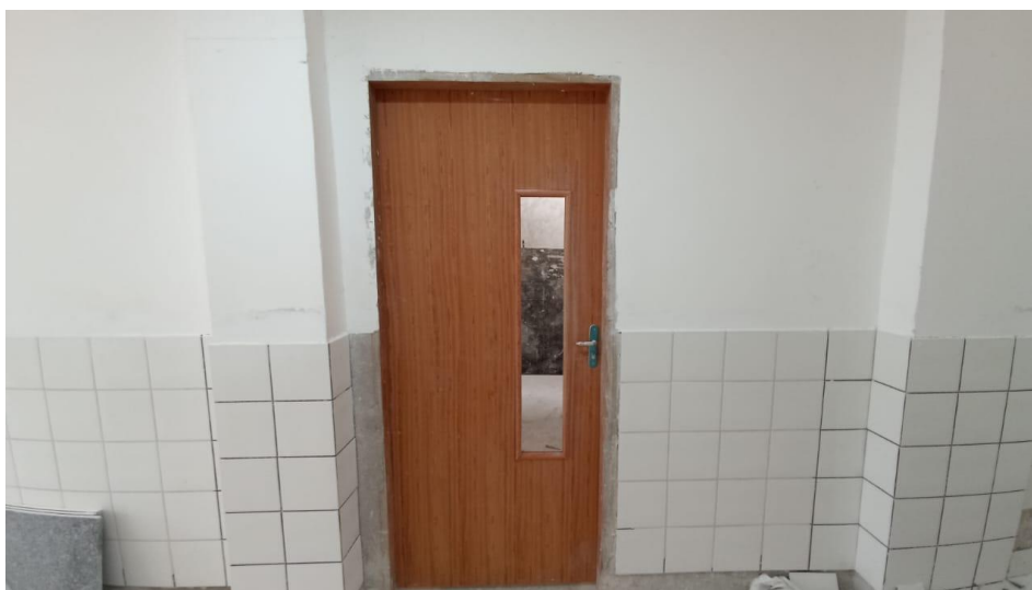
Figura 23 - Detalhe para portas instaladas