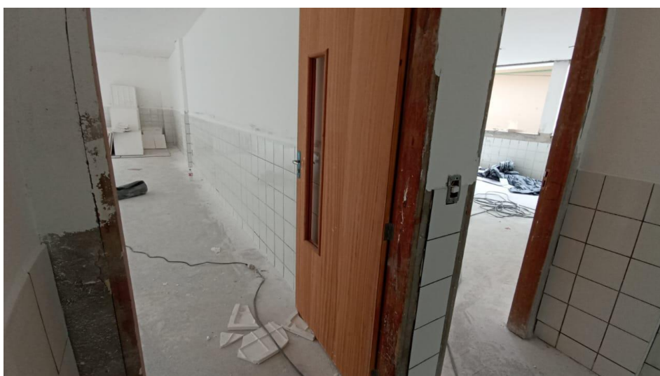
Figura 22 - Detalhe para portas instaladas