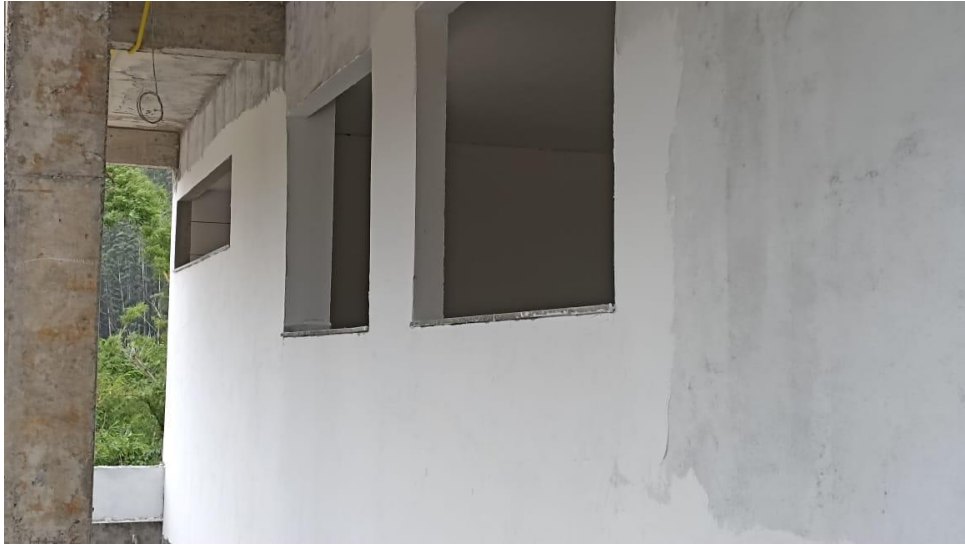
Figura 5 - Detalhe para emassamento das paredes