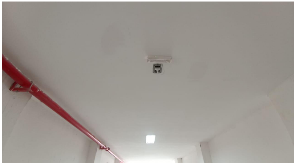
Figura 20 - Detalhe para ponto luminária de emergência