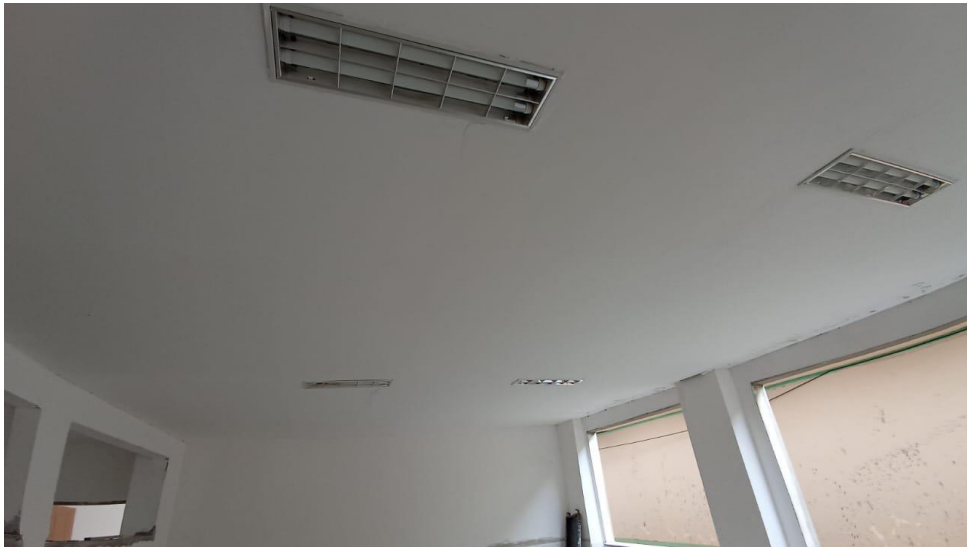
Figura 16 - Detalhe para luminárias de sobrepor