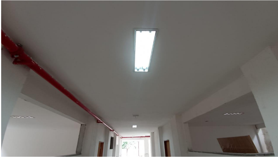
Figura 15 - Detalhe para luminárias de sobrepor