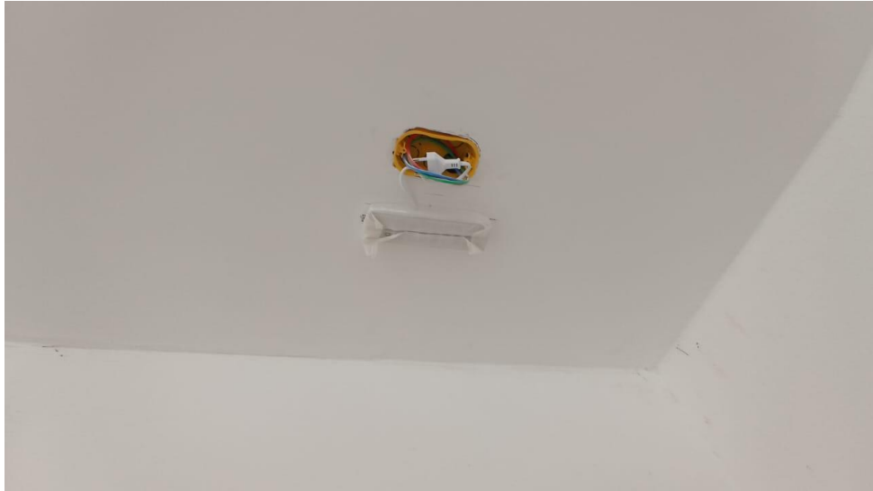
Figura 19 - Detalhe para ponto luminária de emergência