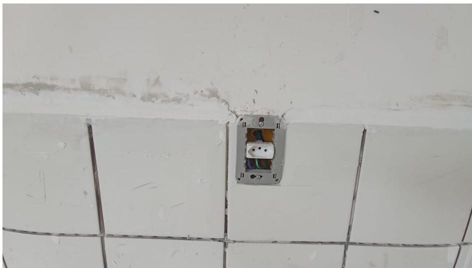
Figura 30 – Detalhe para tomada 2p + t