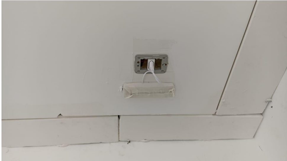
Figura 17 - Detalhe para ponto luminária de emergência