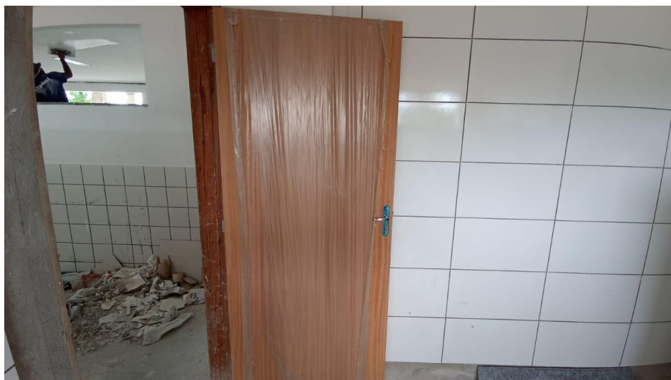
Figura 26 - Detalhe para portas instaladas