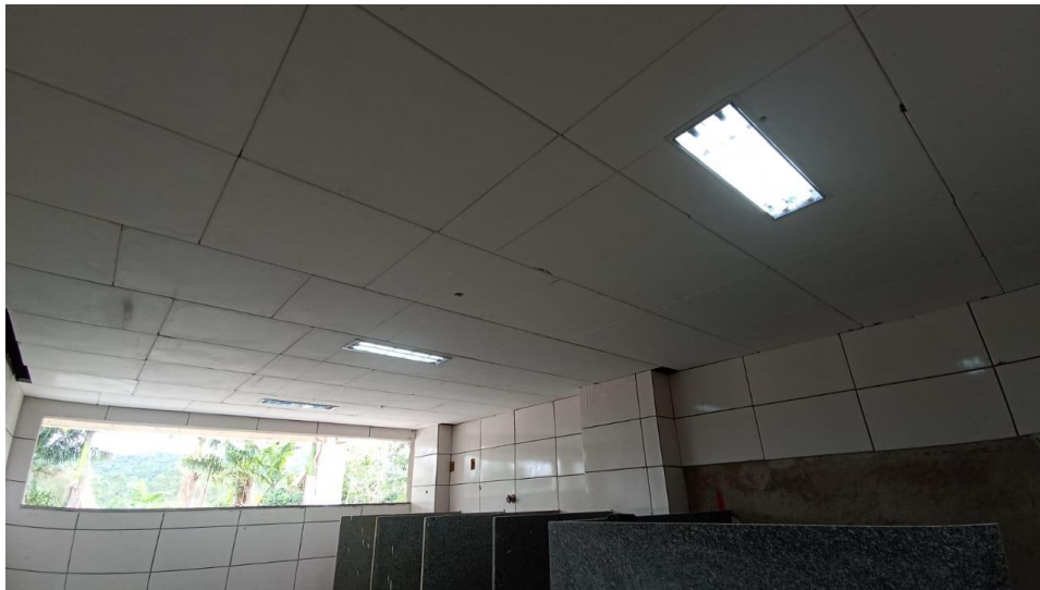
Figura 10 - Detalhe para forro de gesso e luminária de sobrepor