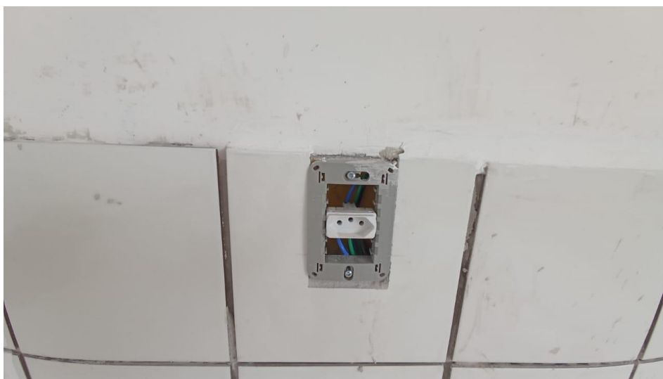
Figura 29 – Detalhe para tomada 2p + t