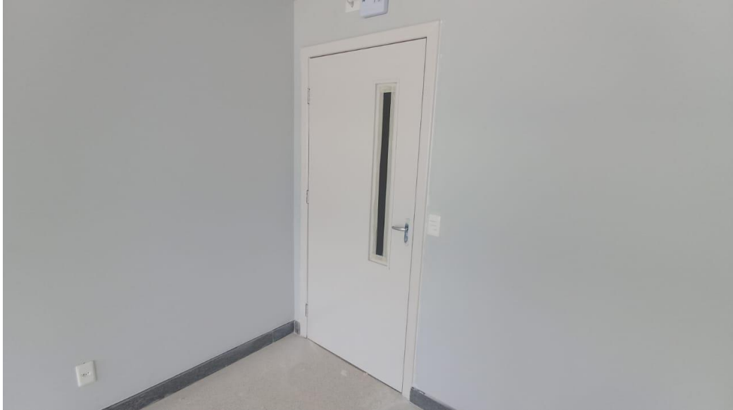
Figura 23 - Detalhe para portas, marcos e alisares pintados