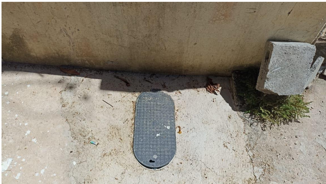
Figura 16 - Detalhe para padrão de entrada de água