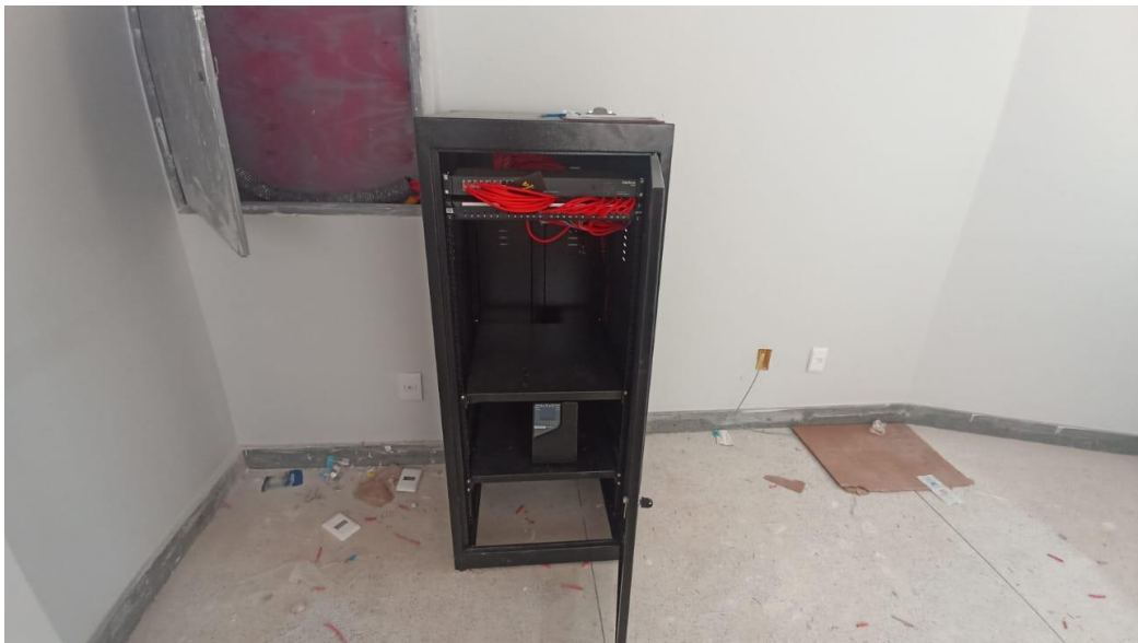
Figura 24 - Detalhe para rack instalado