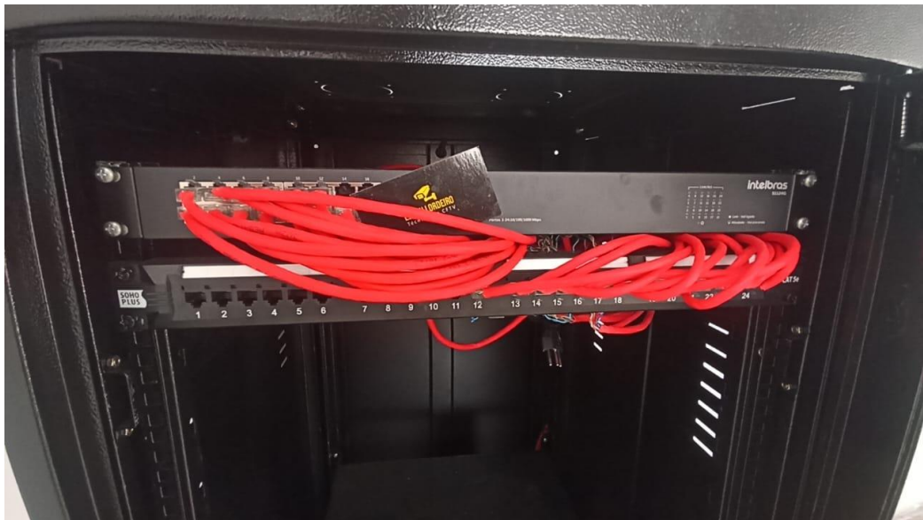
Figura 18 – Detalhe para patch panel e switch 24 portas