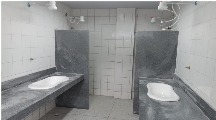
Figura 1 – Detalhe para bacias banho infantil

OBJETO: RECONSTRUÇÃO DA EMEI VOVÓ CLARA CONTRATO: 078/2024