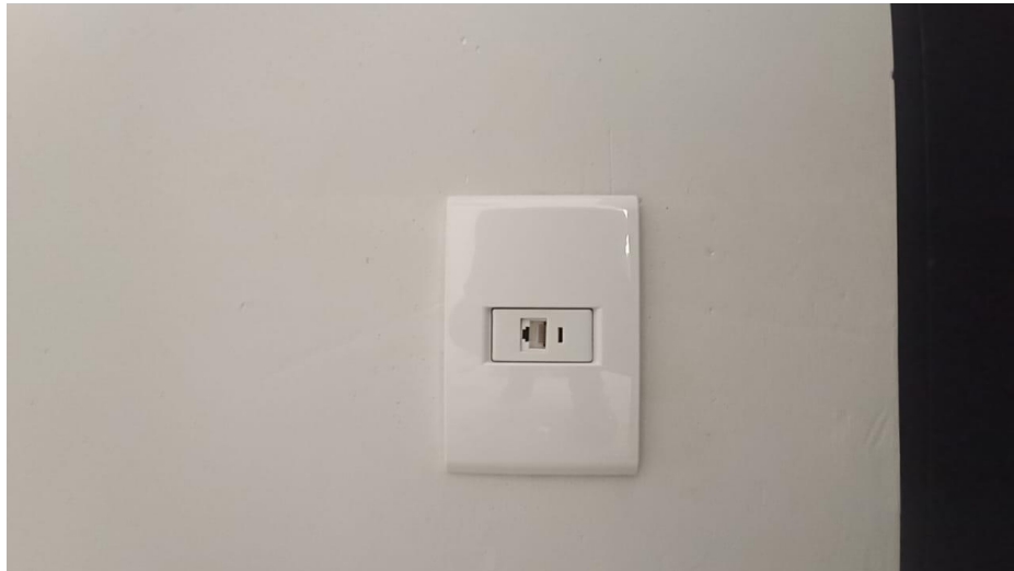
Figura 10 - Detalhe para espelho com conector RJ 45 fêmea