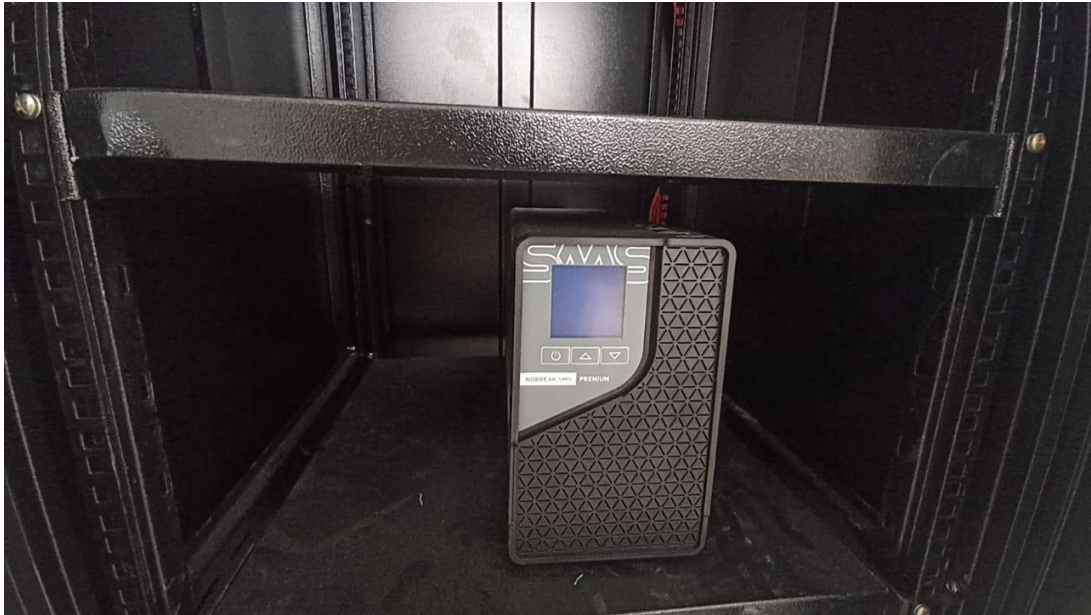
Figura 15 – Detalhe para no break