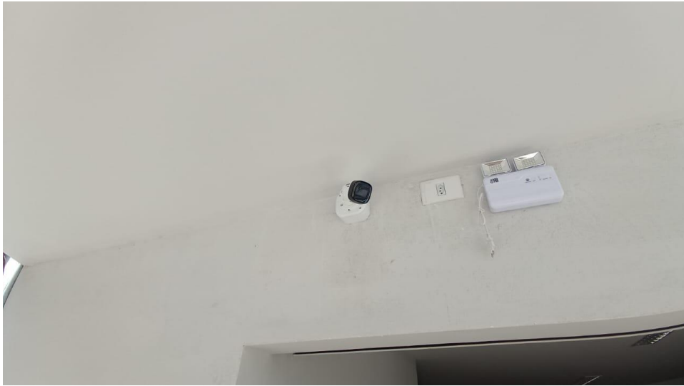
Figura 5 - Detalhe para câmera Bullet infravermelho