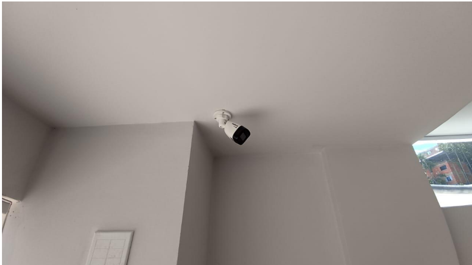
Figura 6 - Detalhe para câmera Bullet infravermelho