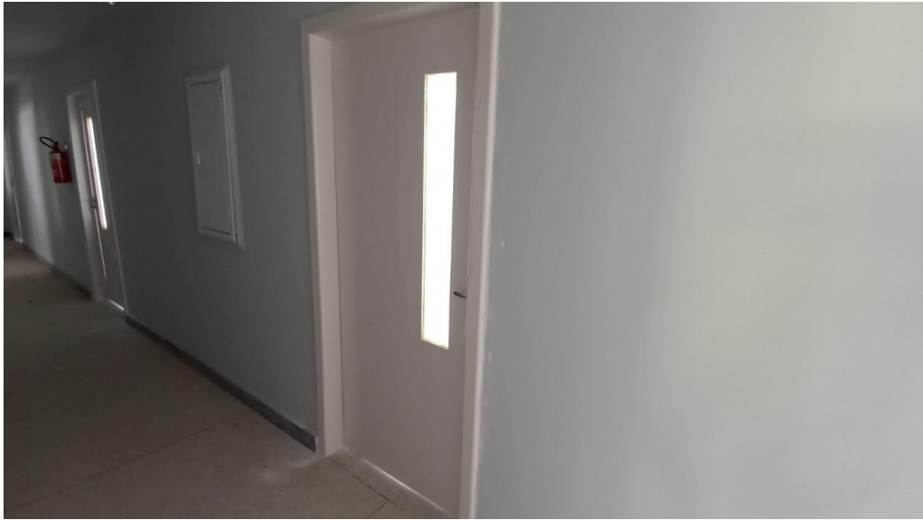
Figura 21 - Detalhe para portas, marcos e alisares pintados