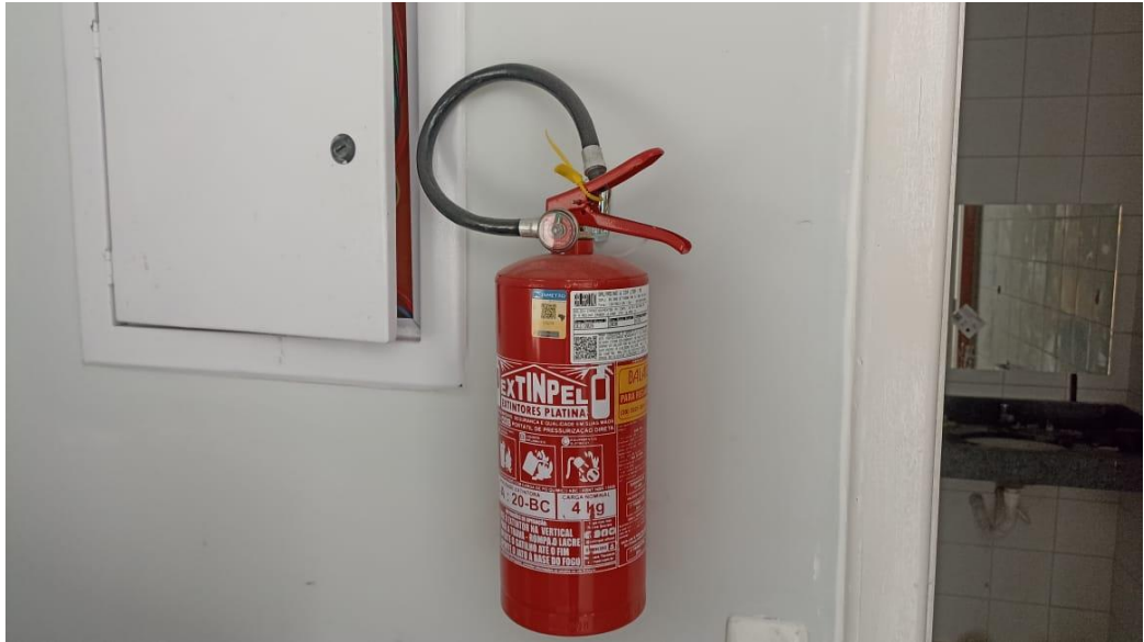
Figura 13 - Detalhe para extintor de incêndio