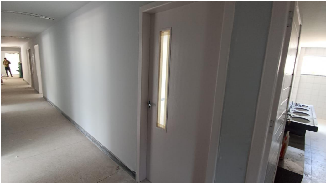
Figura 22 – Detalhe para portas, marcos e alisares pintados