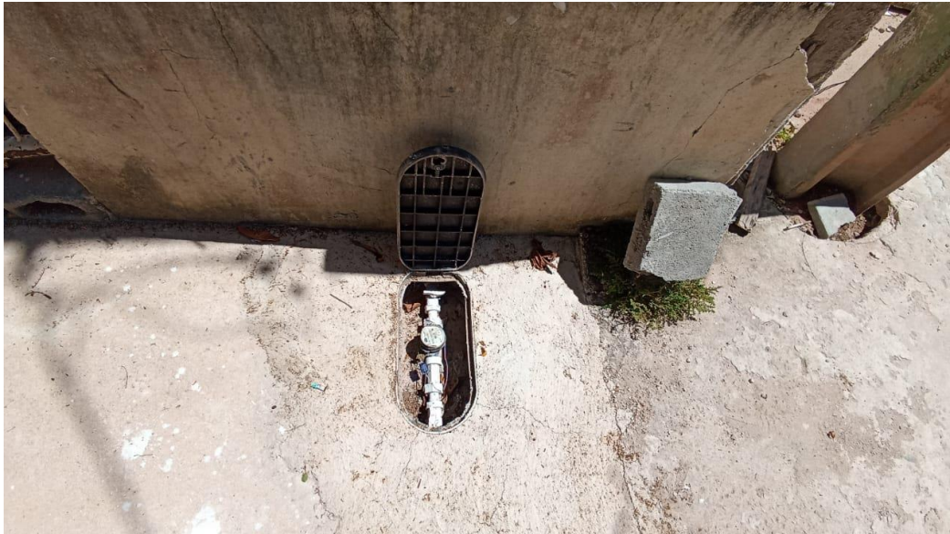
Figura 17 - Detalhe para padrão de entrada de água