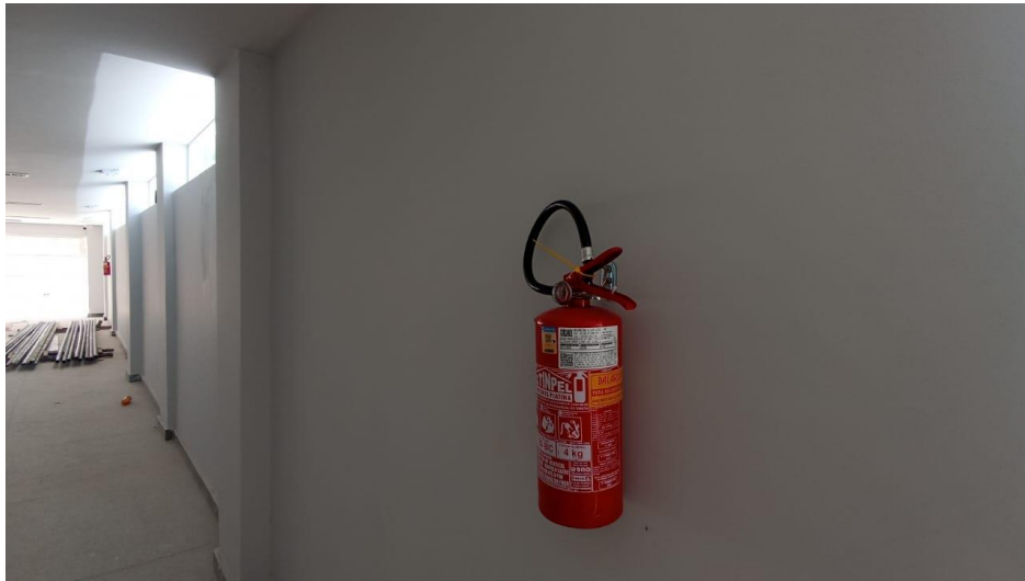
Figura 11 - Detalhe para extintor de incêndio