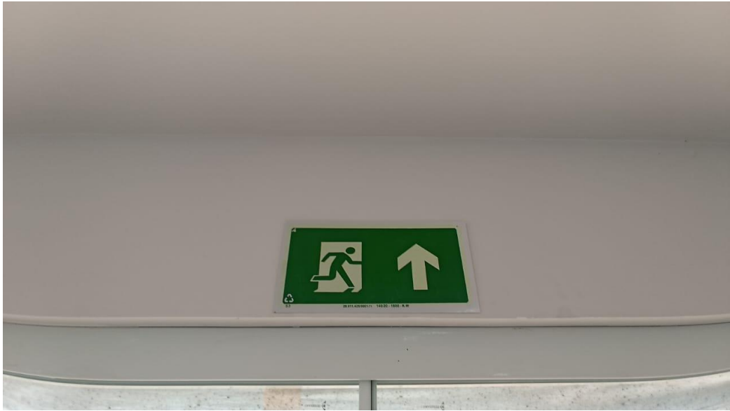
Figura 19 - Detalhe para placa de sinalização de segurança