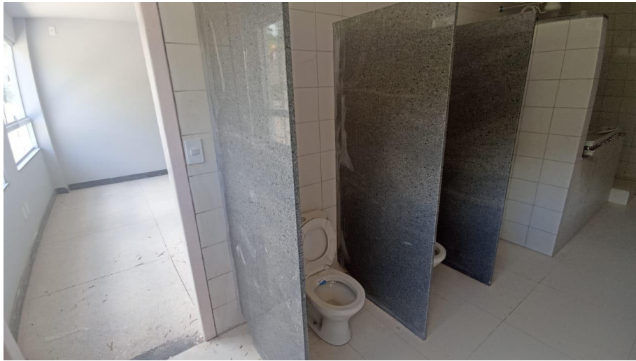
Figura 9 - Detalhe para divisórias dos banheiros