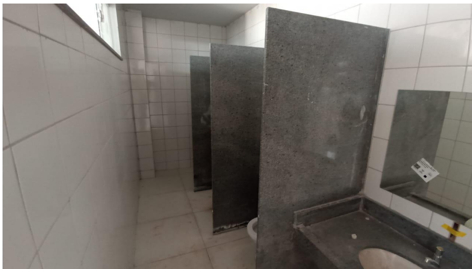
Figura 8 - Detalhe para divisórias dos banheiros