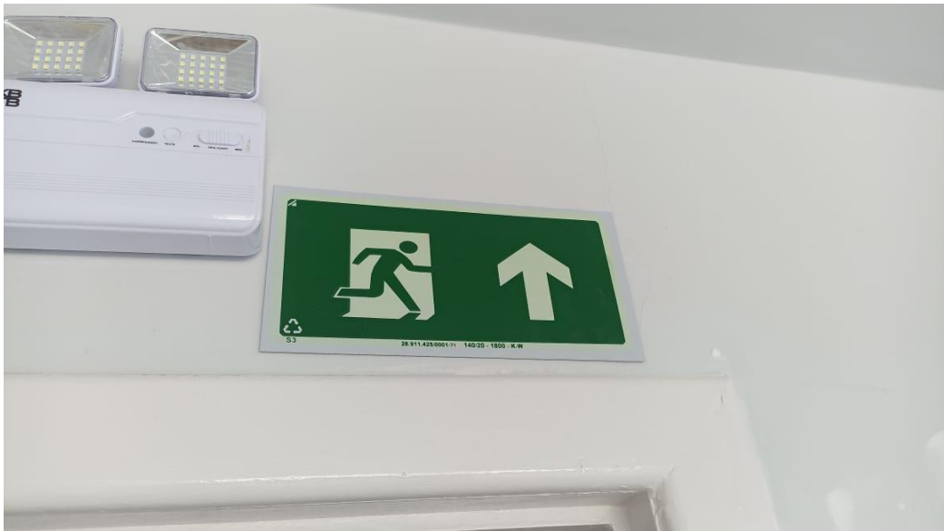
Figura 20 - Detalhe para placa de sinalização de segurança