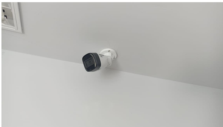
Figura 2 – Detalhe para câmera Bullet infravermelho