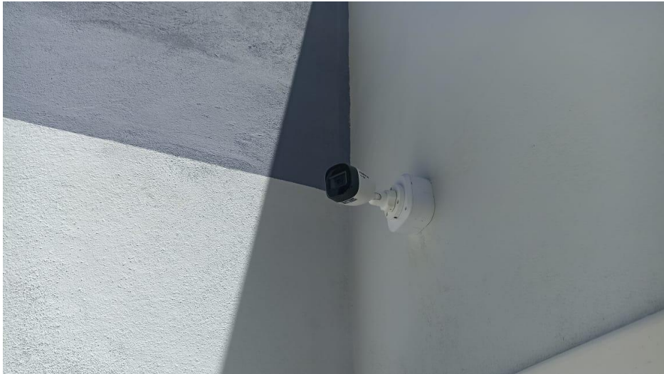
Figura 7 - Detalhe para câmera Bullet infravermelho