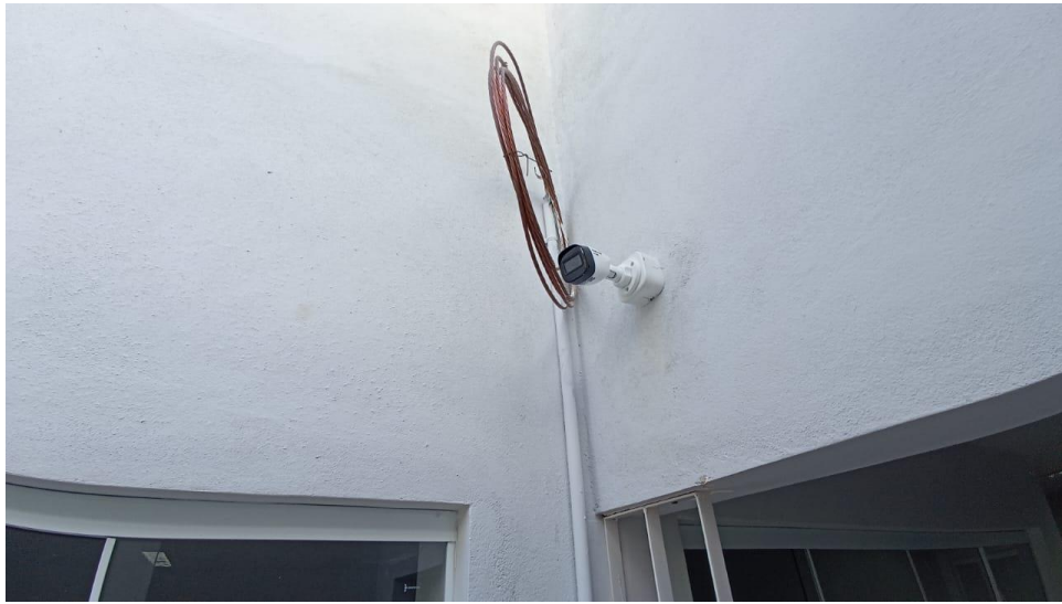
Figura 3 – Detalhe para câmera Bullet infravermelho