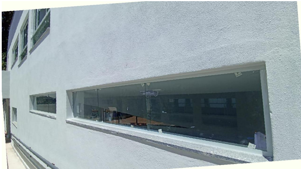
Figura 25 - Detalhe para vidro janelas

Conceição do Castelo – ES, 21 de janeiro de 2026.