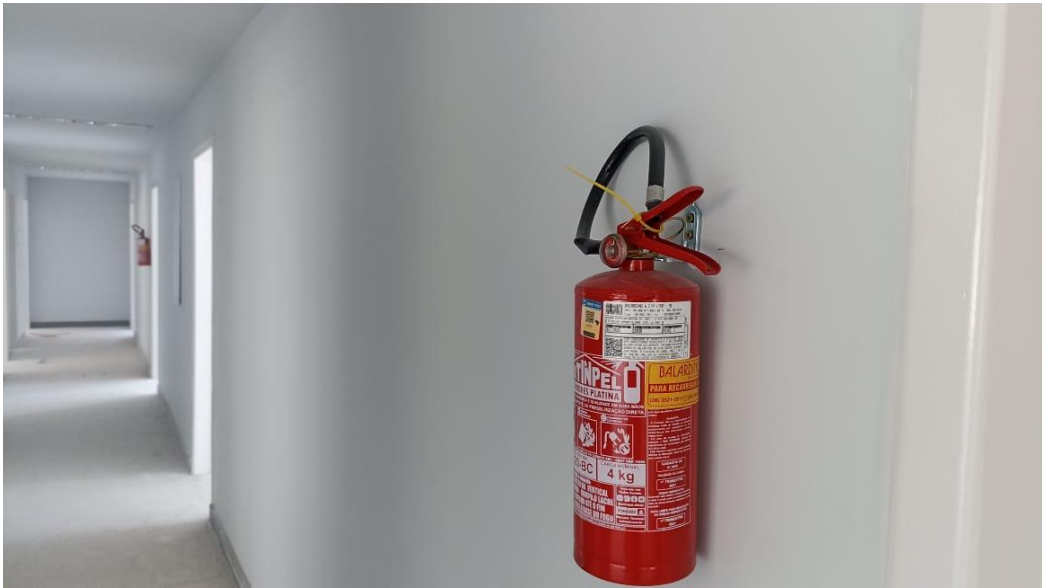
Figura 14 - Detalhe para extintor de incêndio