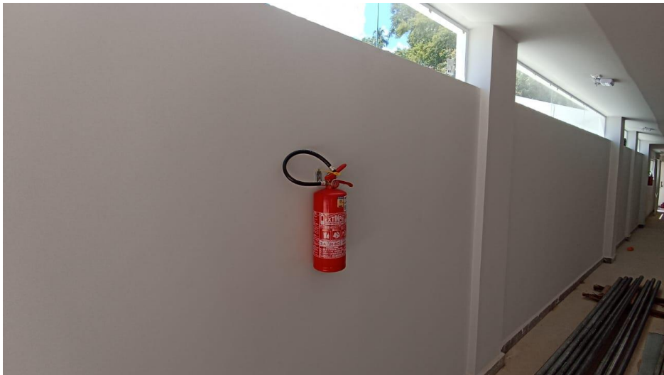
Figura 12 - Detalhe para extintor de incêndio