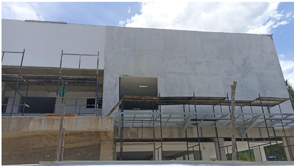
Figura 2 - Detalhe para andaime metálico para serviços em fachadas externas