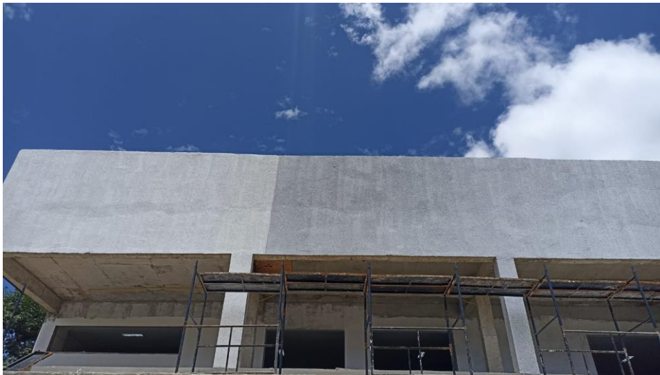
Figura 10 - Detalhe para emassamentos das paredes fachada externa