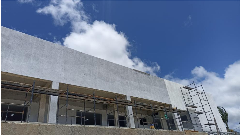
Figura 9 - Detalhe para emassamentos das paredes fachada externa