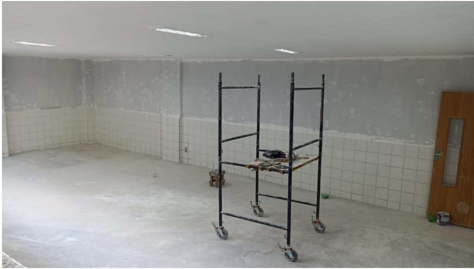
Figura 3 - Detalhe para andaime metálico para serviços ambientes internos