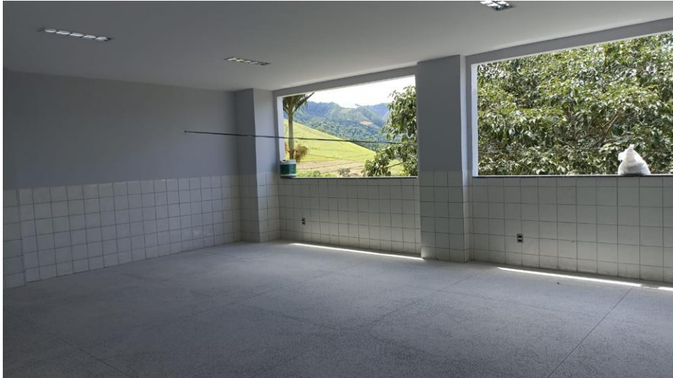
Figura 11 - Detalhe paredes e forro de gesso emassados, e pintados e revestimento das paredes