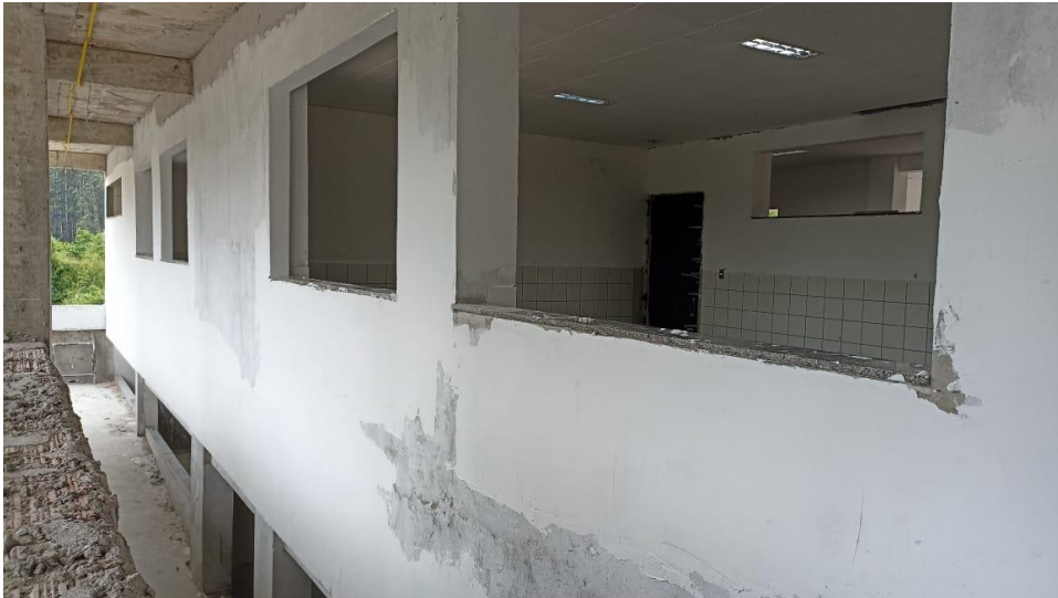
Figura 4 - Detalhe para emassamentos das paredes dos ambientes internos