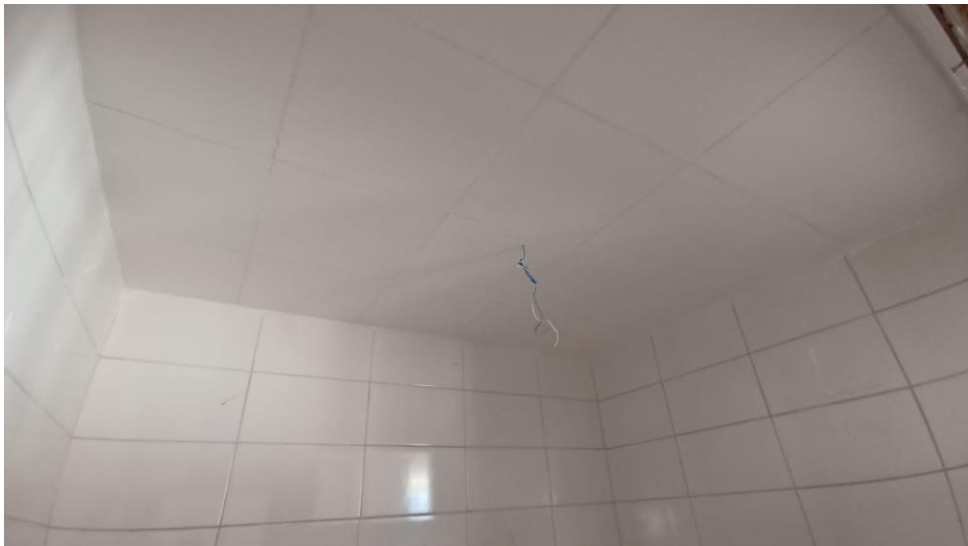
Figura 20 - Detalhe para revestimento das paredes dos ambientes internos

Conceição do Castelo – ES, 06 de fevereiro de 2026.