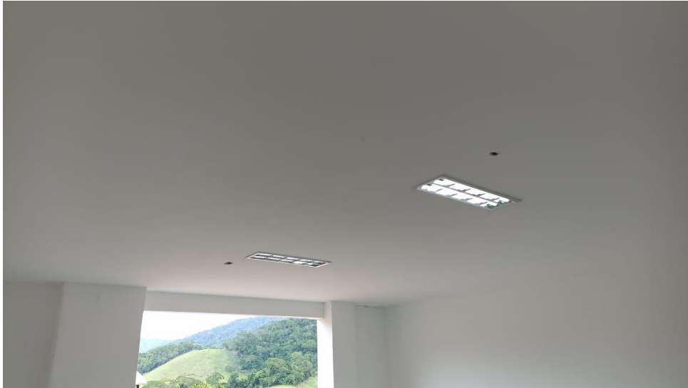
Figura 7 - Detalhe para emassamentos das paredes e forros de gesso ambientes internos