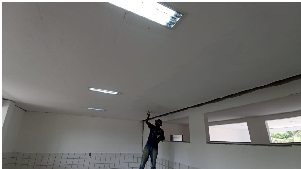
Figura 8 - Detalhe para emassamentos das paredes e forros de gesso ambientes internos