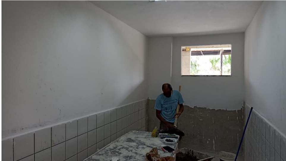
Figura 5 - Detalhe para emassamentos das paredes dos ambientes internos