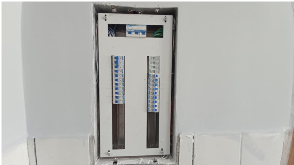
Figura 18 - Detalhe para quadro de distribuição de energia embutido