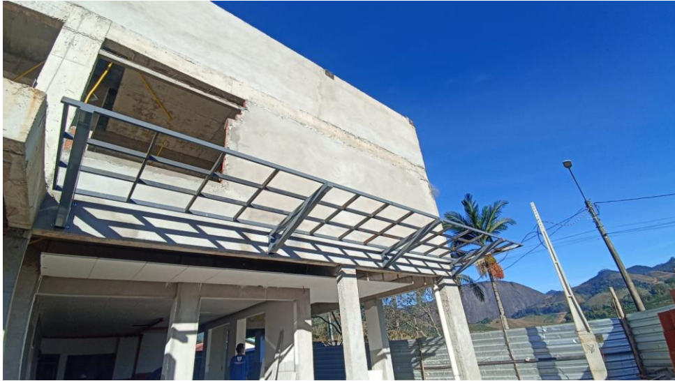
Figura 15 - Detalhe para pintura do pergolada com impermeabilizante igolflex ou equivalente