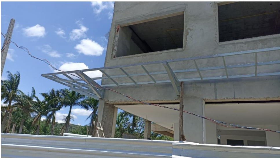
Figura 16 - Detalhe para pintura do pergolada com impermeabilizante igolflex ou equivalente