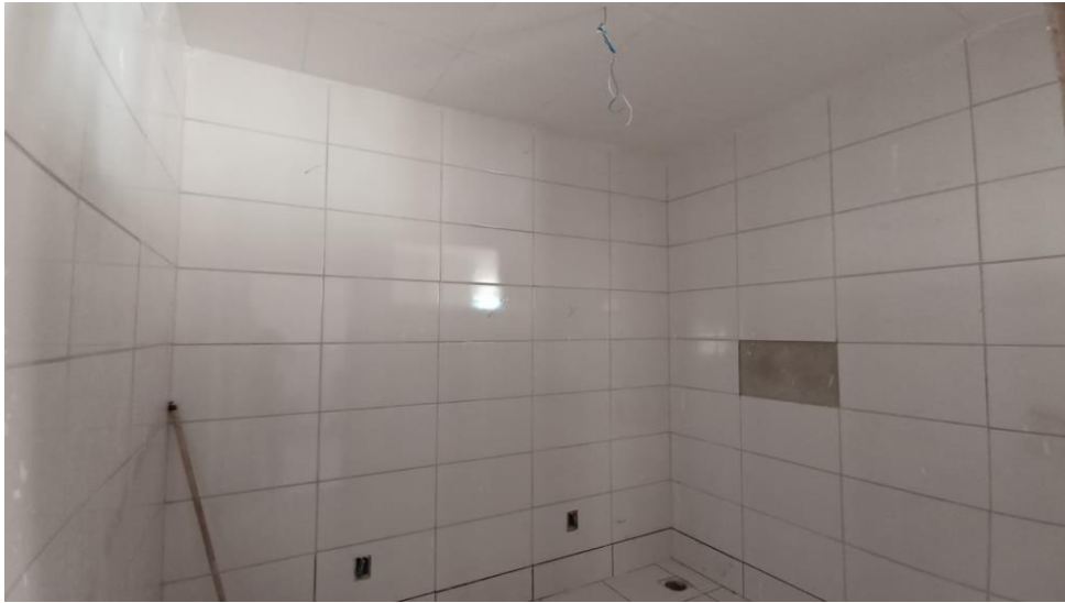
Figura 19 - Detalhe para revestimento das paredes dos ambientes internos