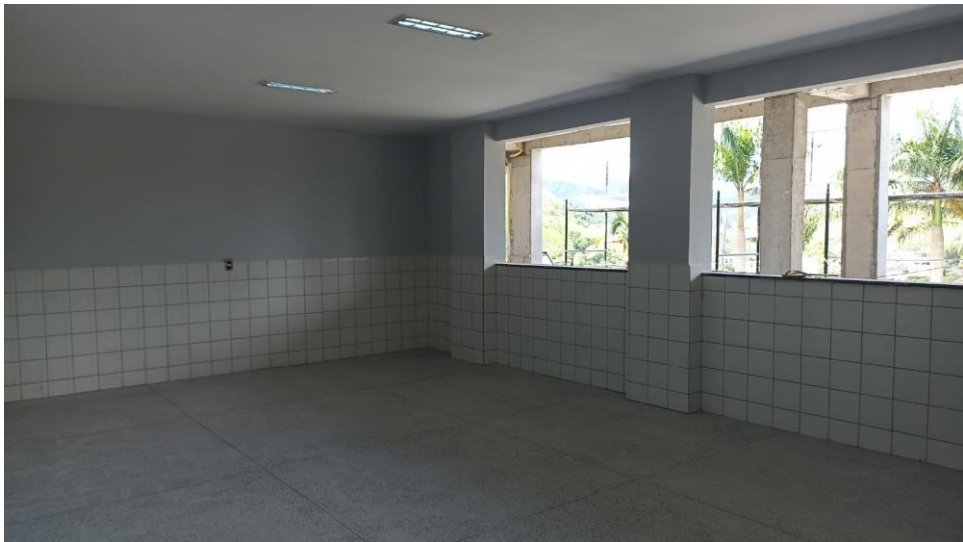
Figura 12 - Detalhe paredes e forro de gesso emassados, e pintados e revestimento das paredes