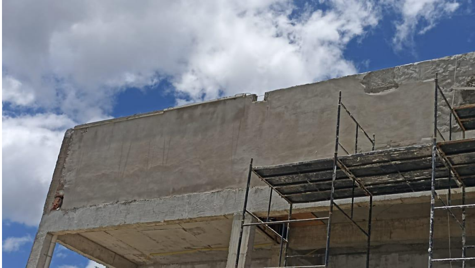
Figura 1 - Detalhe para andaime metálico para serviços em fachadas externas

OBJETO: REFORMA E AMPLIAÇÃO DA EMEF PROFESSOR EDSON ALTOÉ CONTRATO: 023/2024