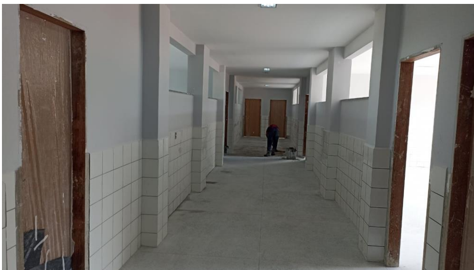
Figura 13 - Detalhe paredes e forro de gesso emassados, e pintados e revestimento das paredes