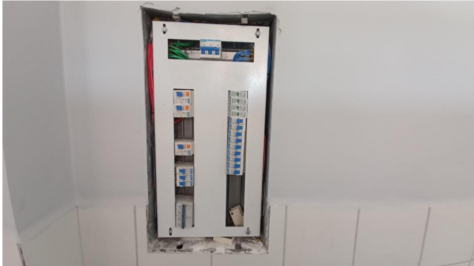
Figura 17 - Detalhe para quadro de distribuição de energia embutido