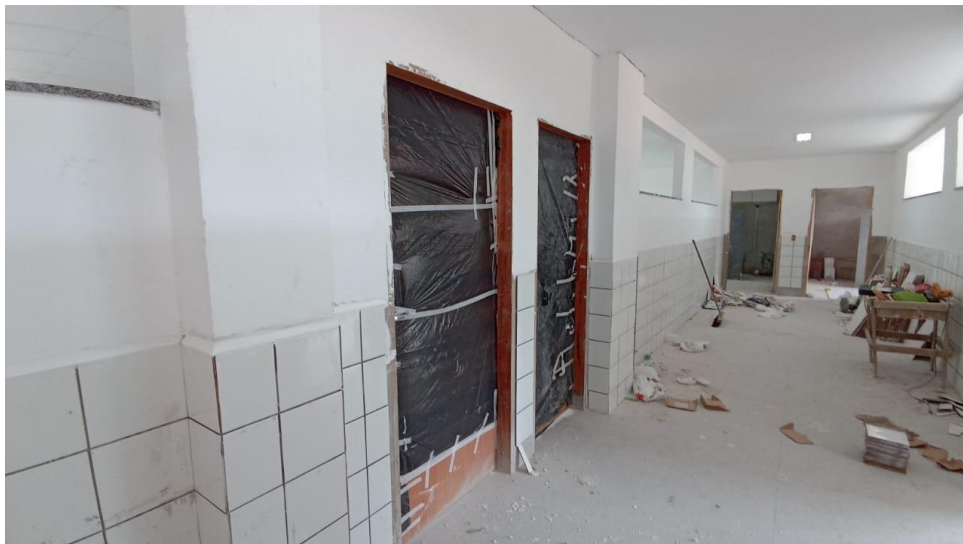
Figura 6 - Detalhe para emassamentos das paredes dos ambientes internos