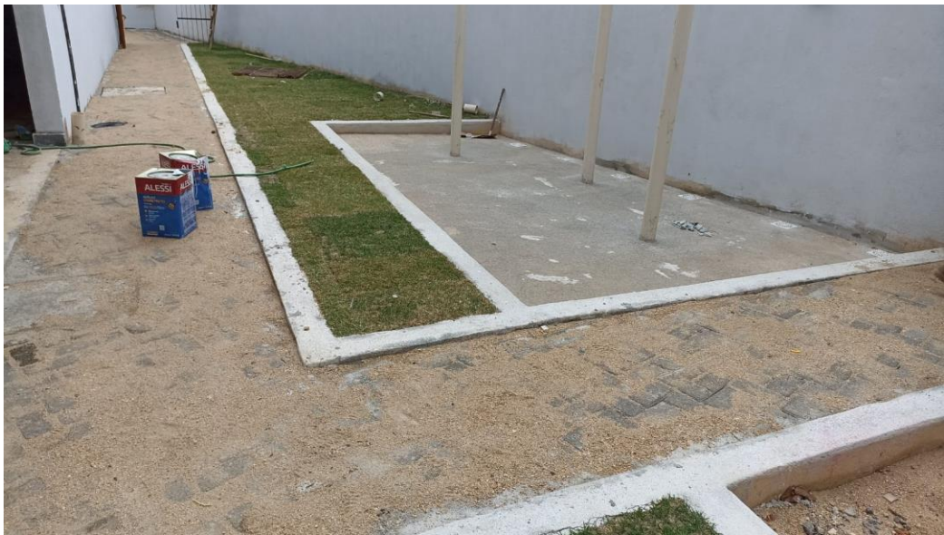
Figura 36 - Detalhe para pavimento piso intertravado – térreo