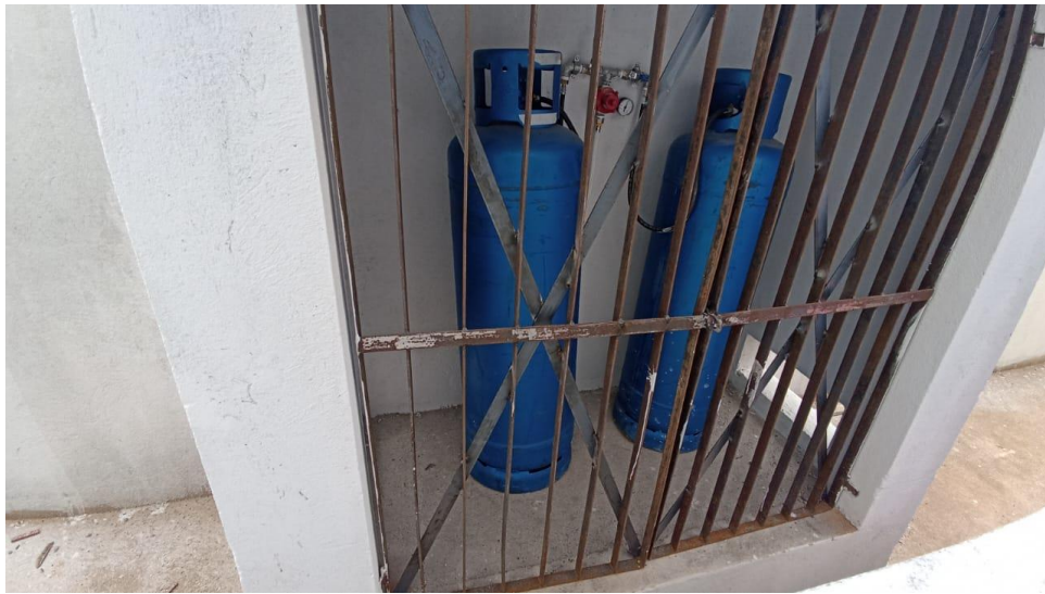
Figura 3 – Detalhe para abrigo de gás – térreo