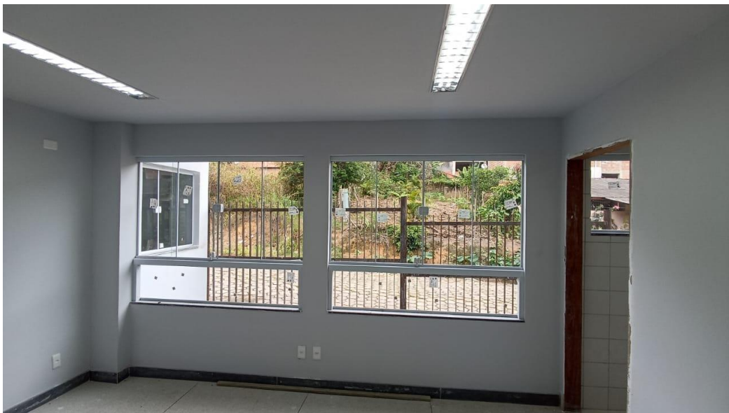
Figura 46 - Detalhe para pintura parte interna, janelas e luminárias tipo calha