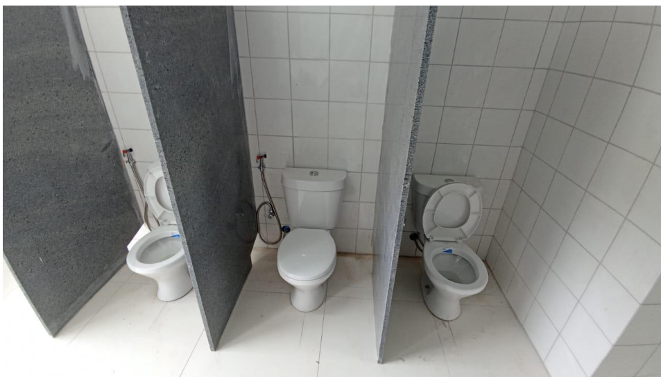
Figura 5 - Detalhe bacia sifonada infantil e acessórios – pavimento superior