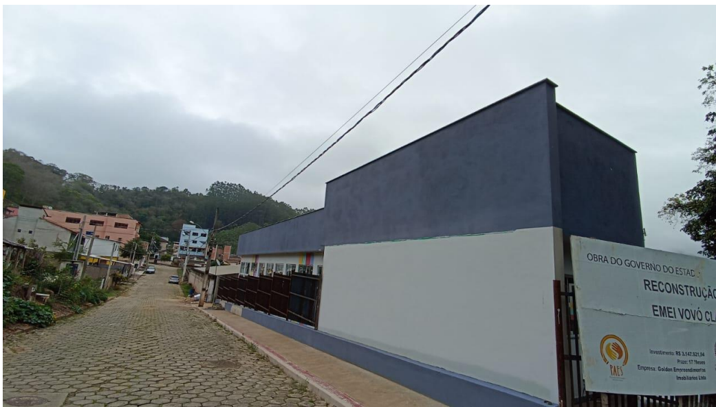
Figura 42 - Detalhe para pintura parte externa