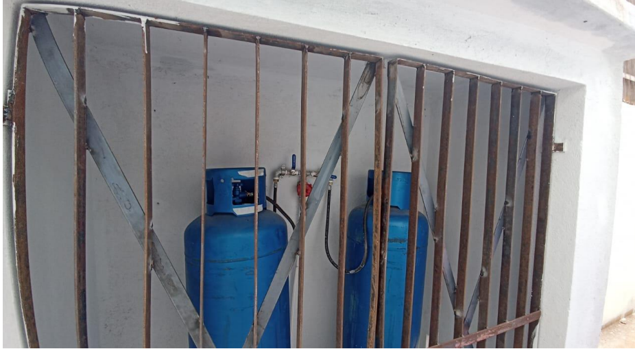
Figura 1 – Detalhe para abrigo de gás – térreo

OBJETO: RECONSTRUÇÃO DA EMEI VOVÓ CLARA CONTRATO: 078/2024