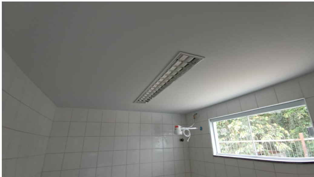
Figura 25 - Detalhe para luminária tipo calha e chuveiro elétrico – pavimento superior