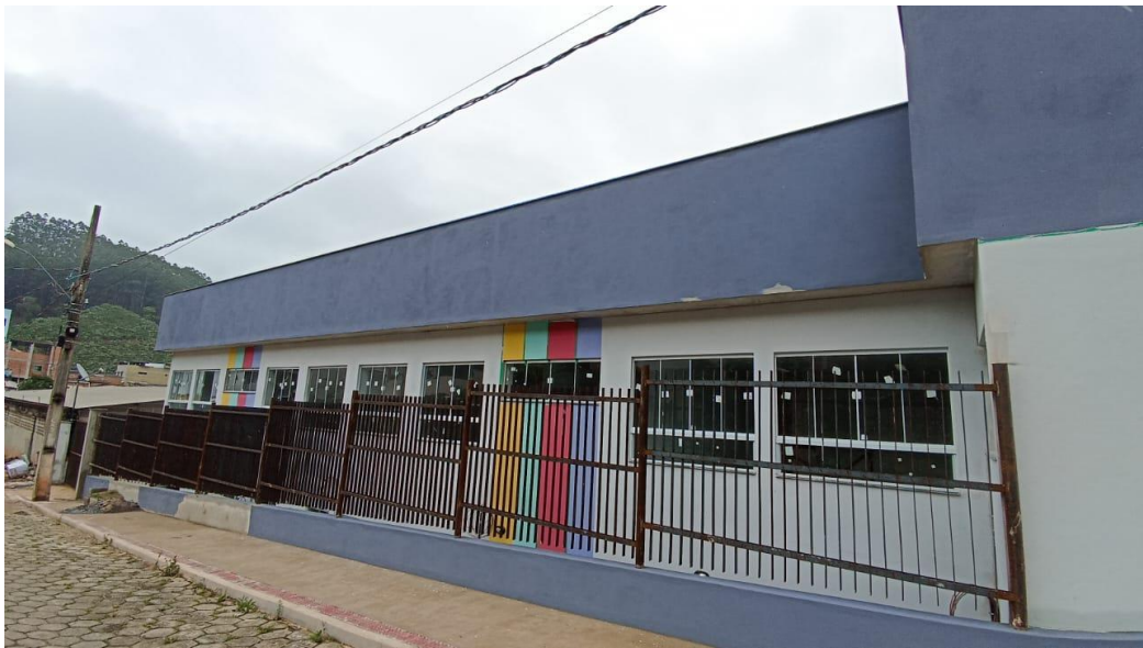
Figura 38 - Detalhe para pintura parte externa