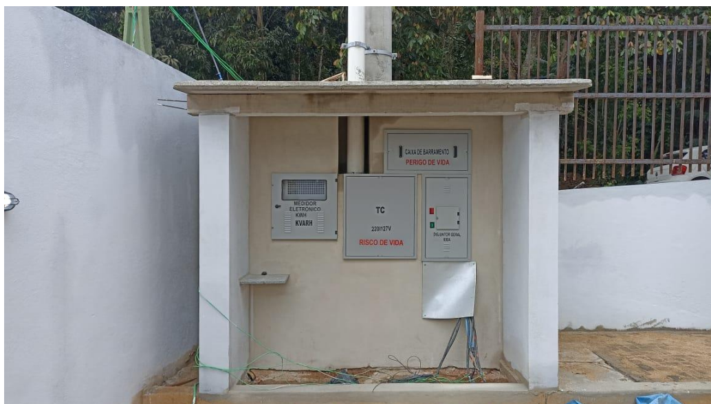
Figura 50 - Detalhe para padrão de entrada de energia – térreo