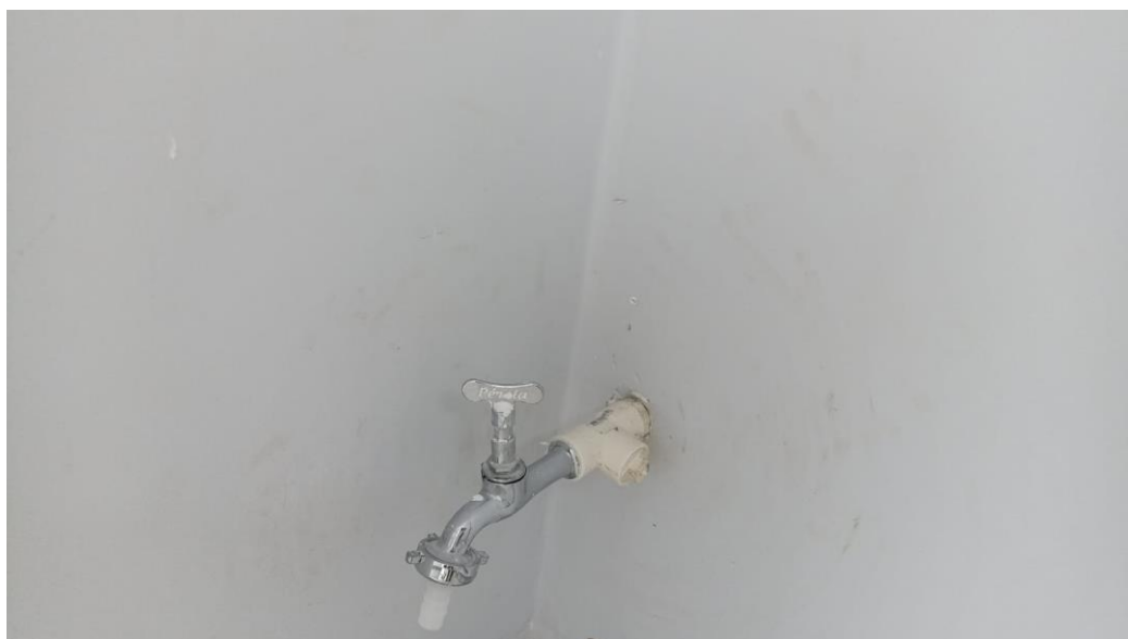
Figura 54 - Detalhe para torneira para jardim – pavimento superior

Conceição do Castelo – ES, 04 de novembro de 2025.