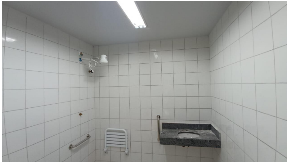
Figura 10 - Detalhe para luminárias tipo calha e chuveiro elétrico – pavimento superior