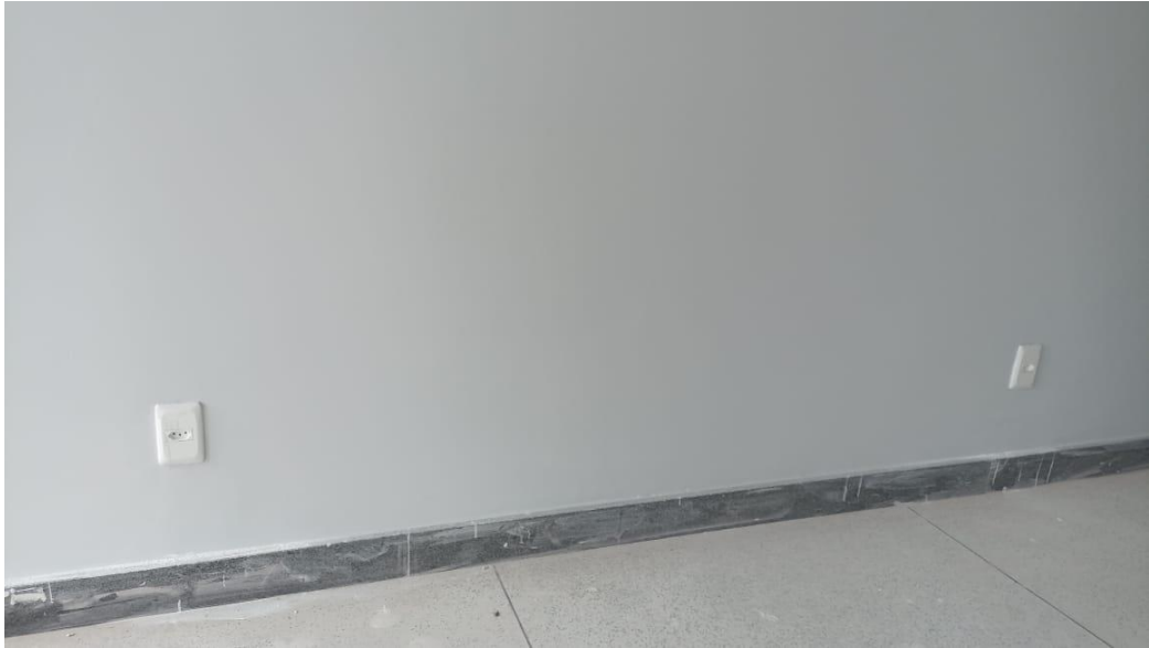
Figura 19 - Detalhe para tomadas – térreo