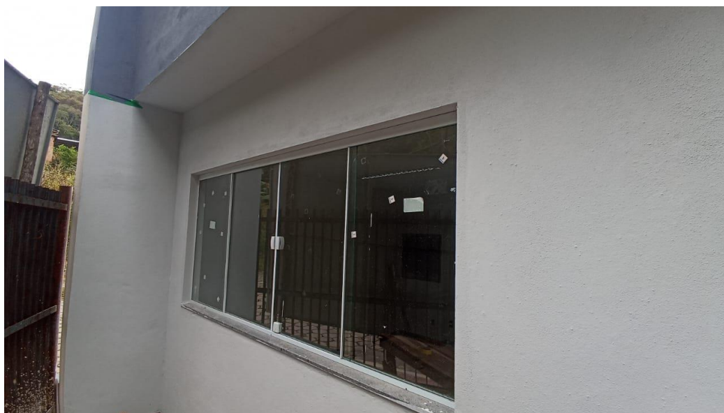
Figura 33 - Detalhe para janelas de vidro – pavimento superior