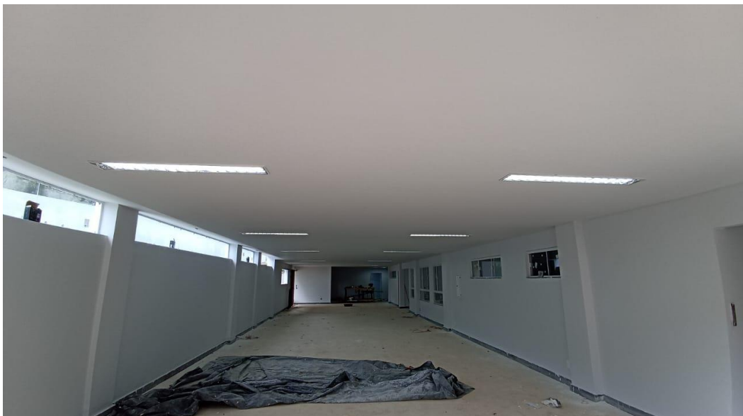
Figura 44 - Detalhe para pintura parte interna e luminárias tipo calha