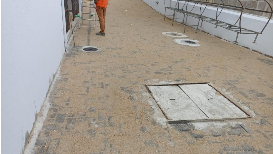
Figura 37 - Detalhe para pavimento piso intertravado – térreo