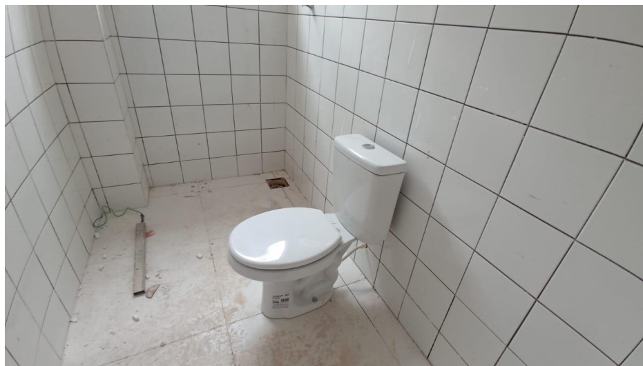
Figura 8 - Detalhe para bacia sifonada padrão e acessórios – térreo