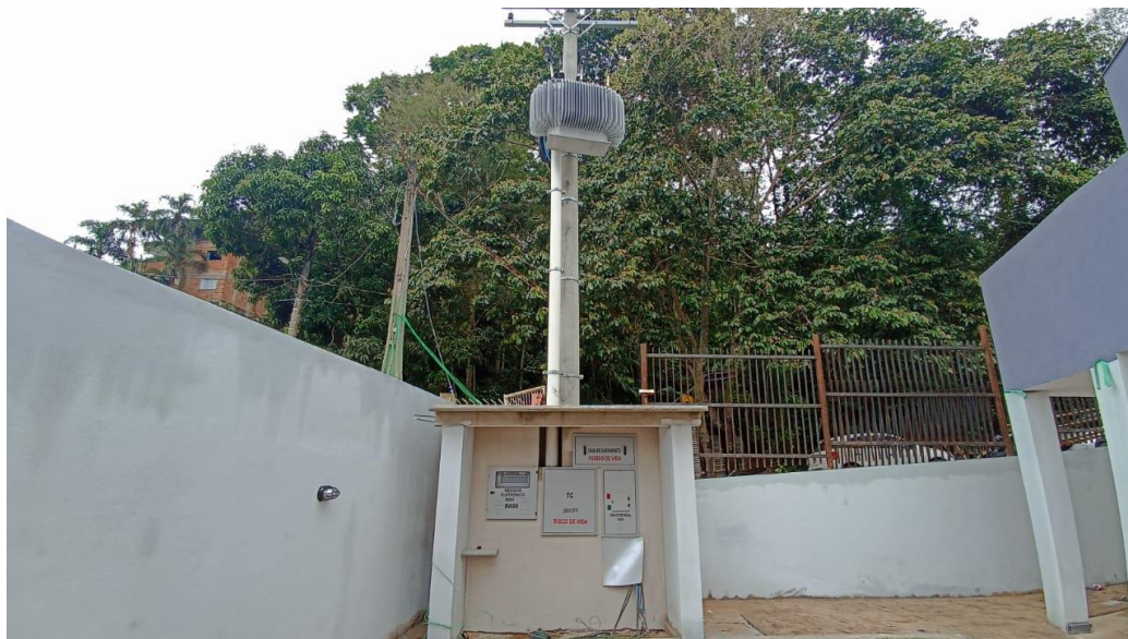
Figura 49 - Detalhe para subestação aérea e padrão de entrada de energia – térreo