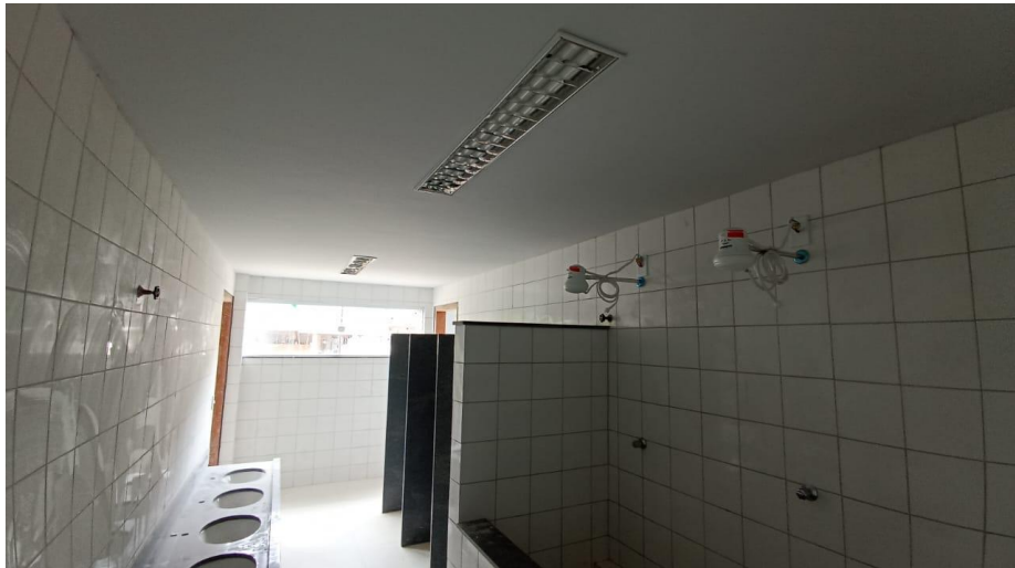
Figura 9 - Detalhe para luminárias tipo calha e chuveiros elétricos – pavimento superior