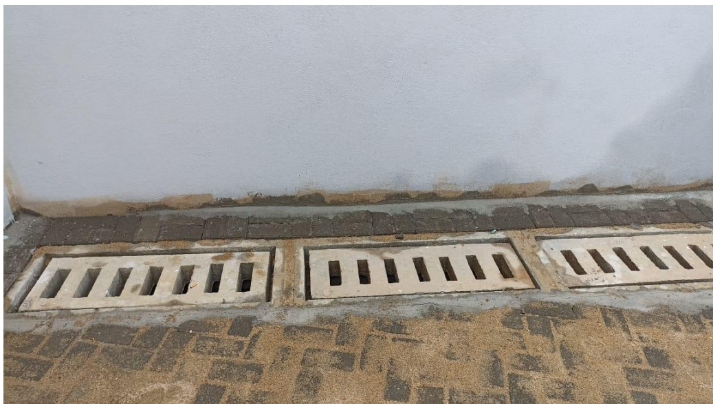
Figura 13 - Detalhe caixas ralos de elemento pré-moldados - térreo