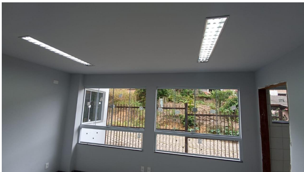
Figura 31 - Detalhe para janelas de vidro e luminárias tipo calha – pavimento superior