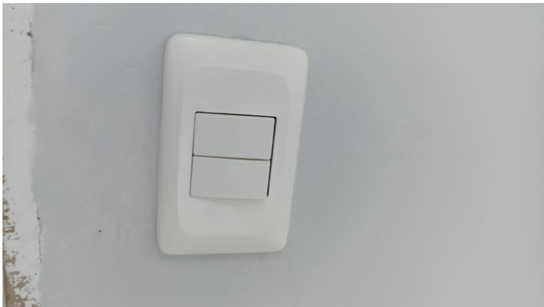
Figura 16 - Detalhe para interruptor duas teclas simples – pavimento superior