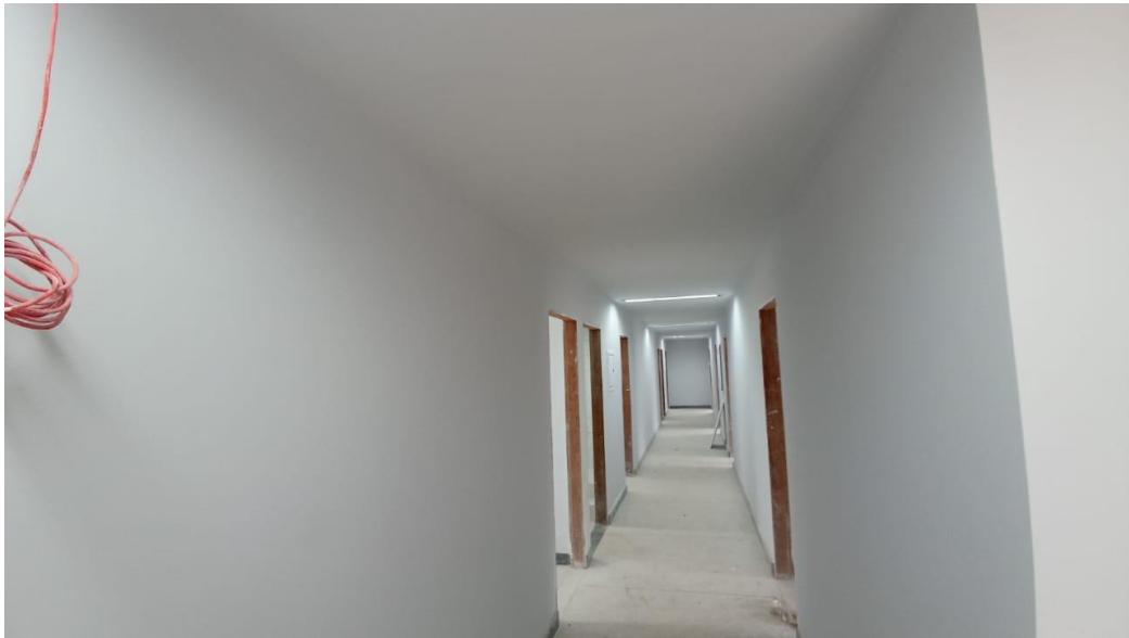
Figura 45 - Detalhe para pintura parte interna