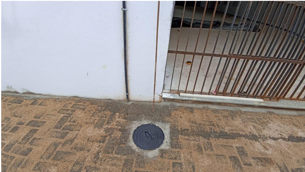
Figura 51 - Detalhe para tampa reforçada em ferro fundido (SPDA) – térreo