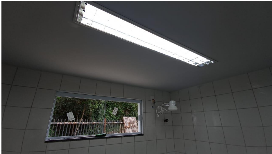
Figura 11 - Detalhe para luminárias tipo calha e chuveiro elétricos – pavimento superior