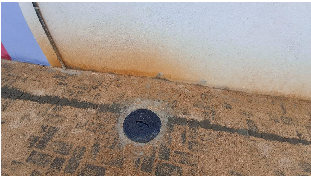
Figura 52 - Detalhe para tampa reforçada em ferro fundido (SPDA) – térreo