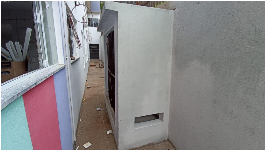
Figura 2 – Detalhe para abrigo de gás – térreo