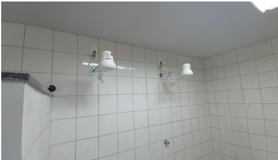
Figura 12 - Detalhe para chuveiros elétricos – pavimento superior