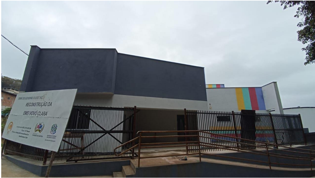
Figura 39 - Detalhe para pintura parte externa