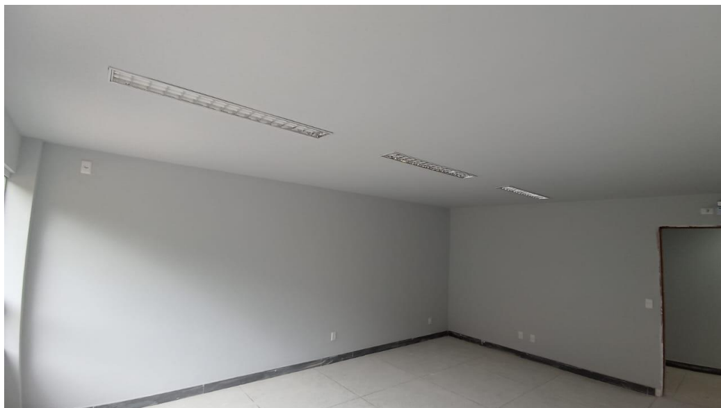
Figura 47 - Detalhe para pintura parte interna e luminárias tipo calha