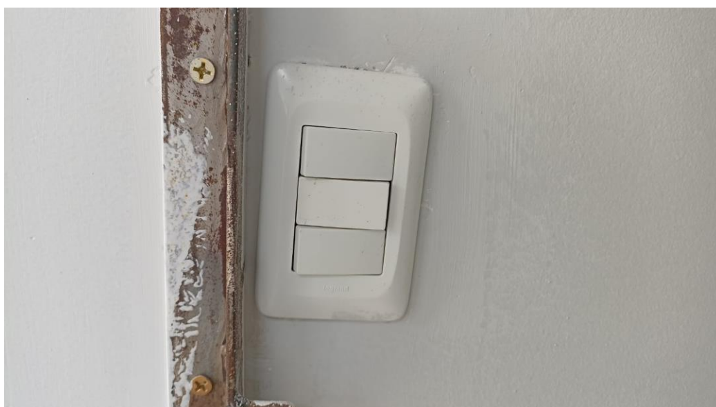
Figura 14 - Detalhe interruptor 3 teclas simples - térreo