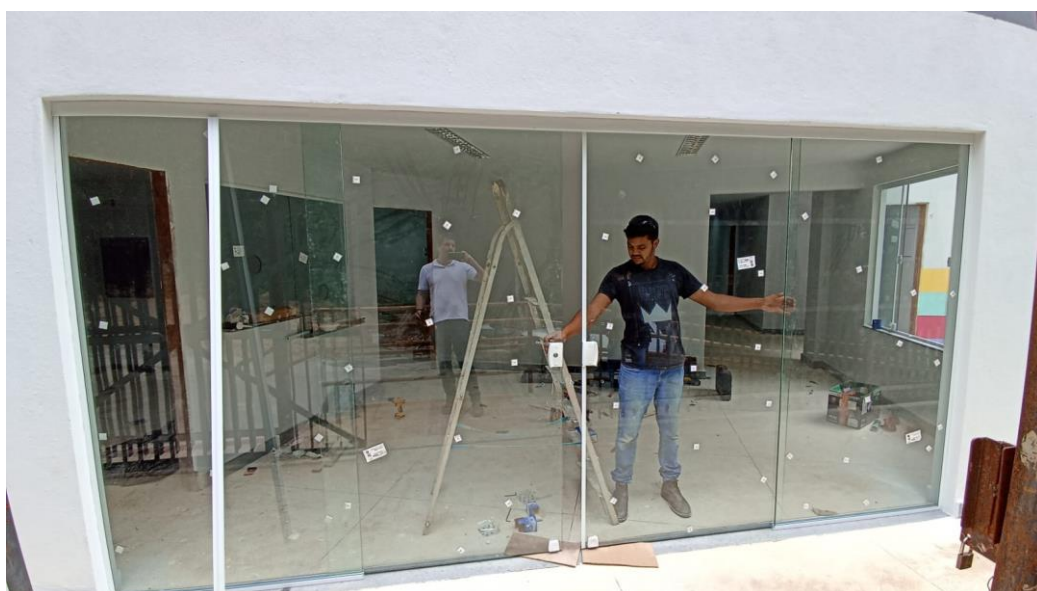
Figura 48 - Detalhe para porta de vidro entrada principal – pavimento superior