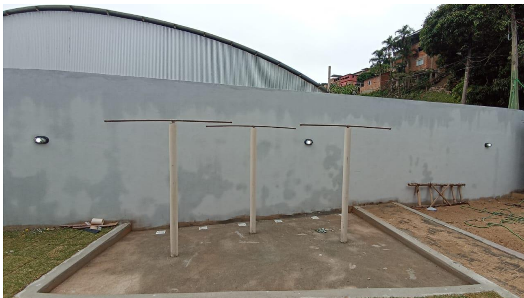
Figura 34 - Detalhe para lastro de concreto área da ducha – térreo