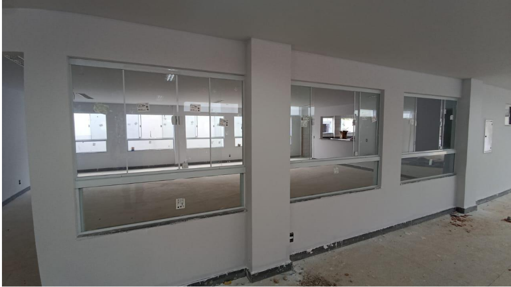
Figura 29 - Detalhe para janelas de vidro – térreo