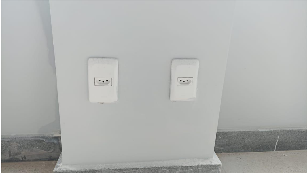
Figura 17 - Detalhe para tomadas – pavimento superior