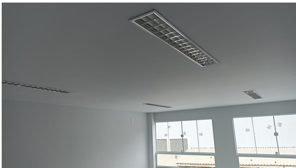
Figura 26 - Detalhe para luminária tipo calha – pavimento superior