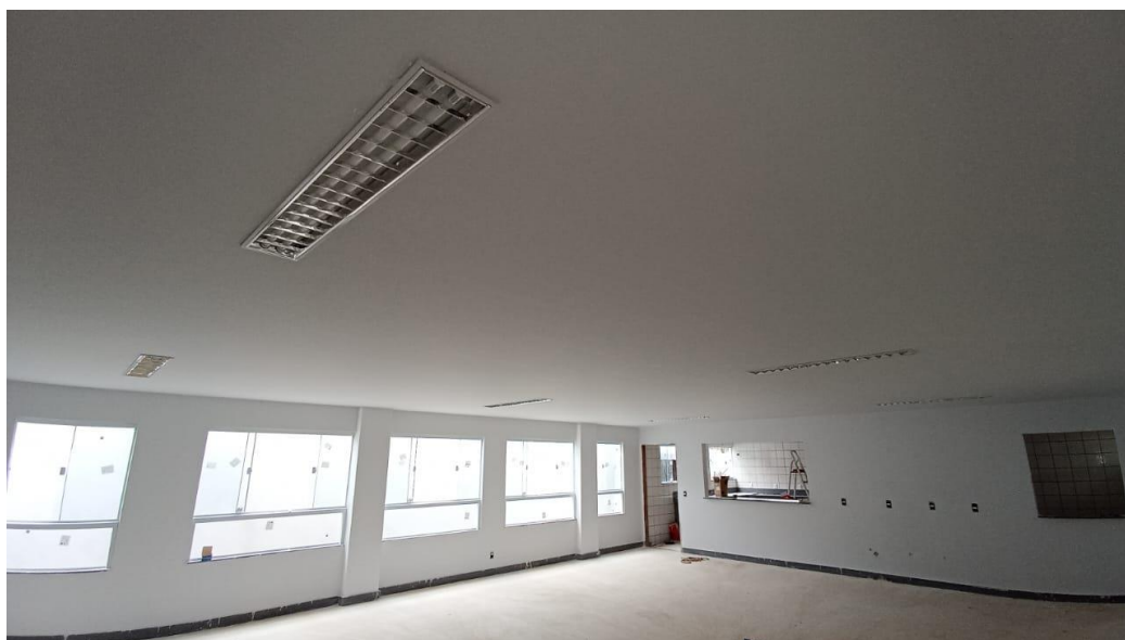
Figura 23 - Detalhe para luminária tipo calha – térreo