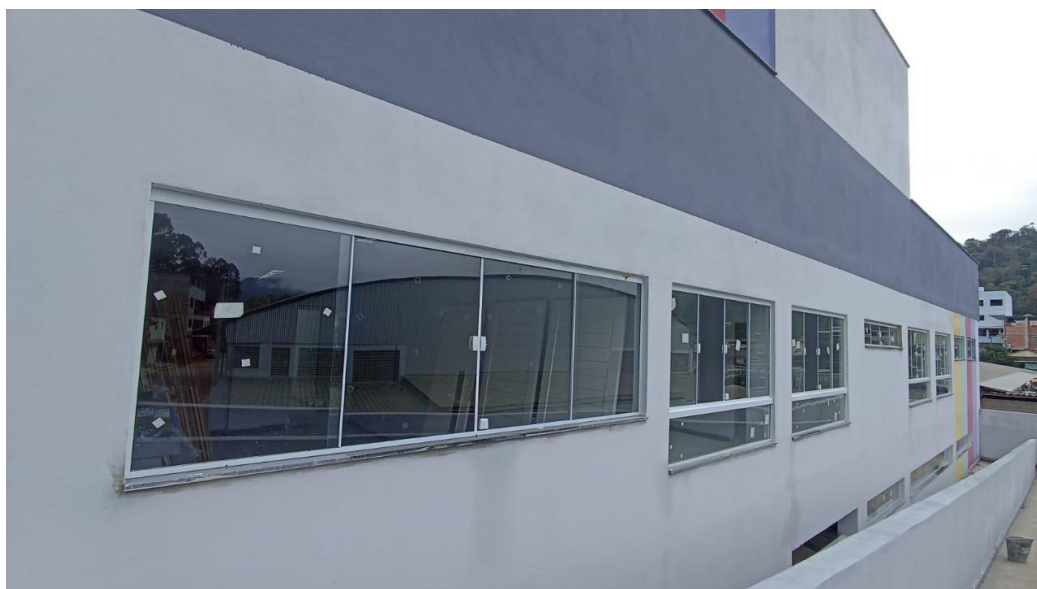
Figura 32 - Detalhe para janelas de vidro – pavimento superior