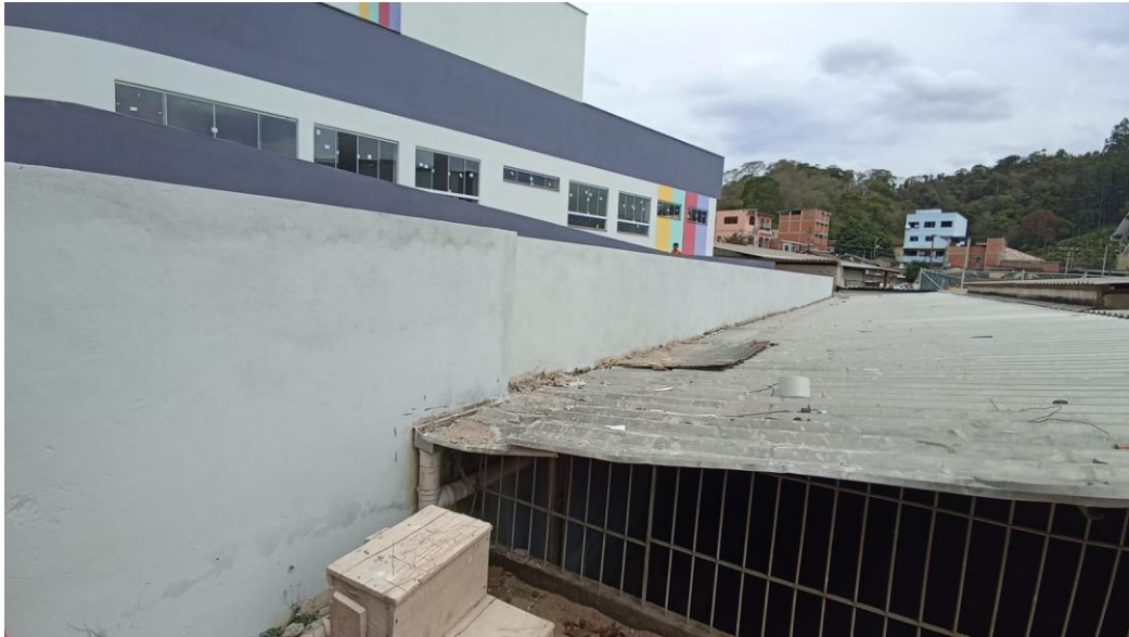
Figura 41 - Detalhe para pintura parte externa