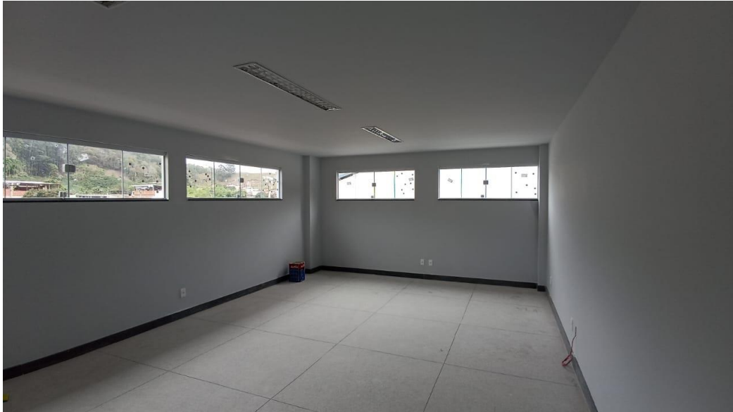
Figura 43 - Detalhe para pintura parte interna, janelas e luminárias tipo calha