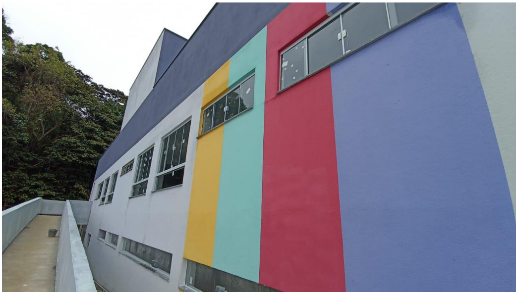
Figura 30 - Detalhe para janelas de vidro – pavimento superior