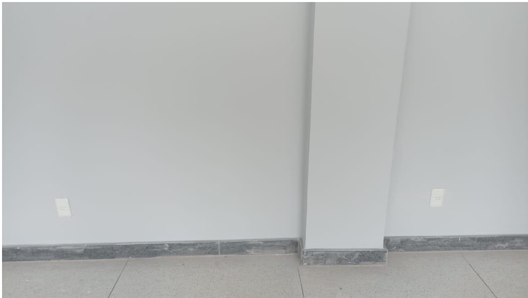
Figura 20 - Detalhe para tomadas – pavimento superior