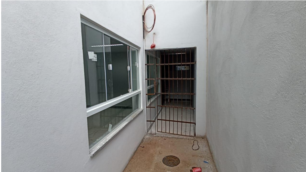
Figura 27 - Detalhe para janelas de vidro – térreo