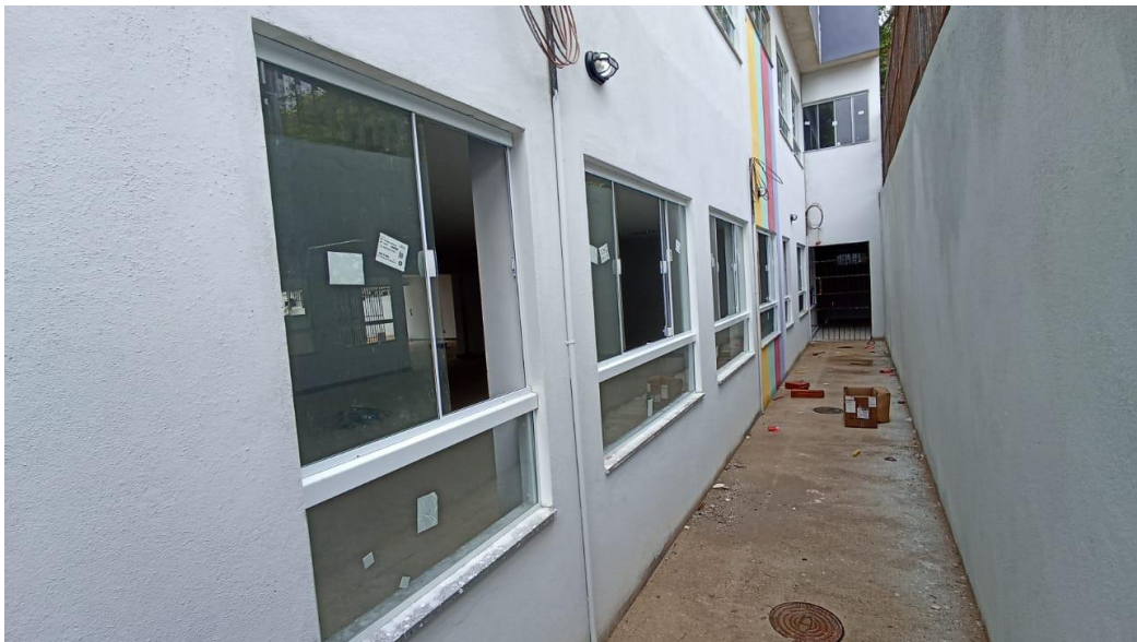
Figura 28 - Detalhe para janelas de vidro – térreo