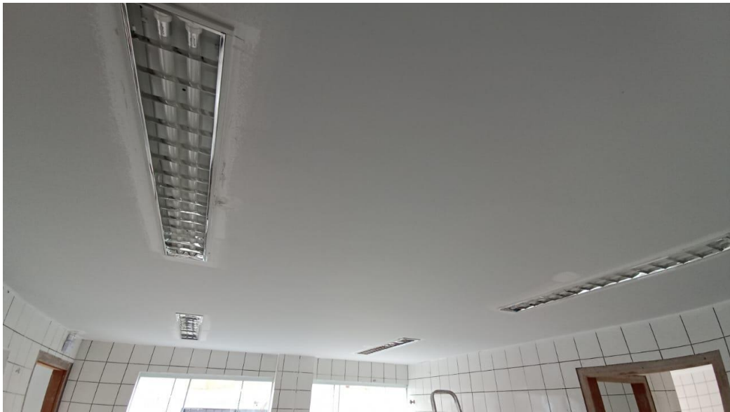
Figura 22 – Detalhe para luminária tipo calha – térreo