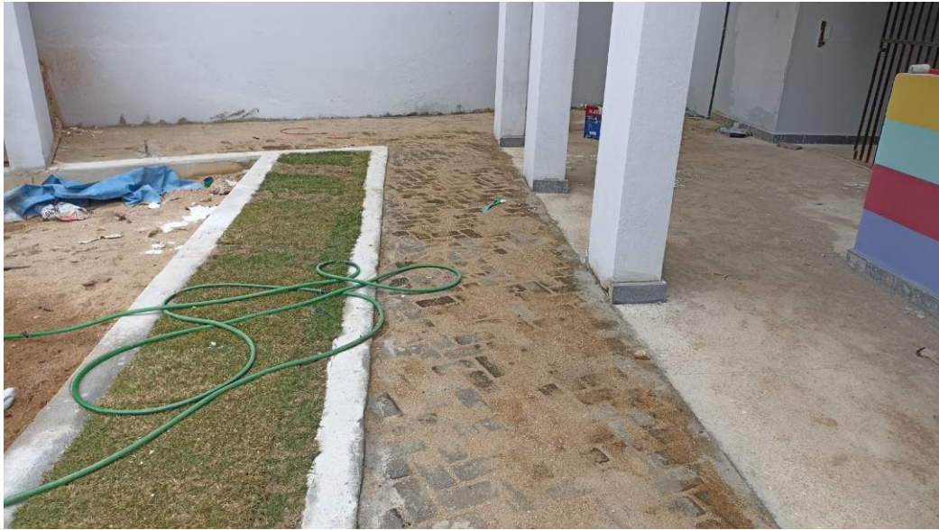
Figura 35 - Detalhe para pavimento piso intertravado – térreo