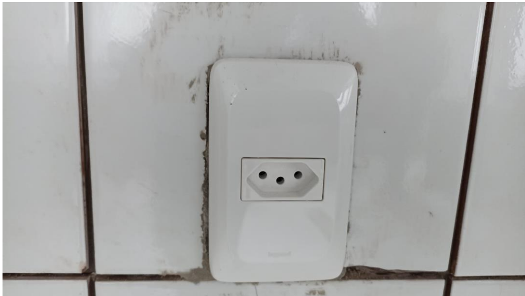
Figura 18 – Detalhe para tomadas – térreo