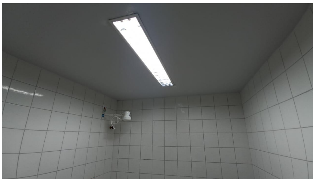
Figura 24 - Detalhe para luminária tipo calha e chuveiro elétrico – pavimento superior