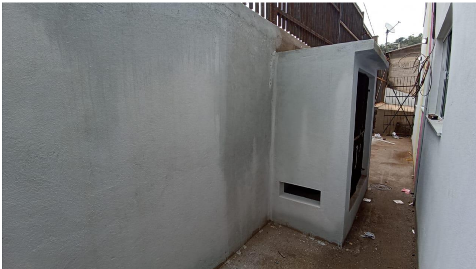
Figura 4 – Detalhe para abrigo de gás – térreo