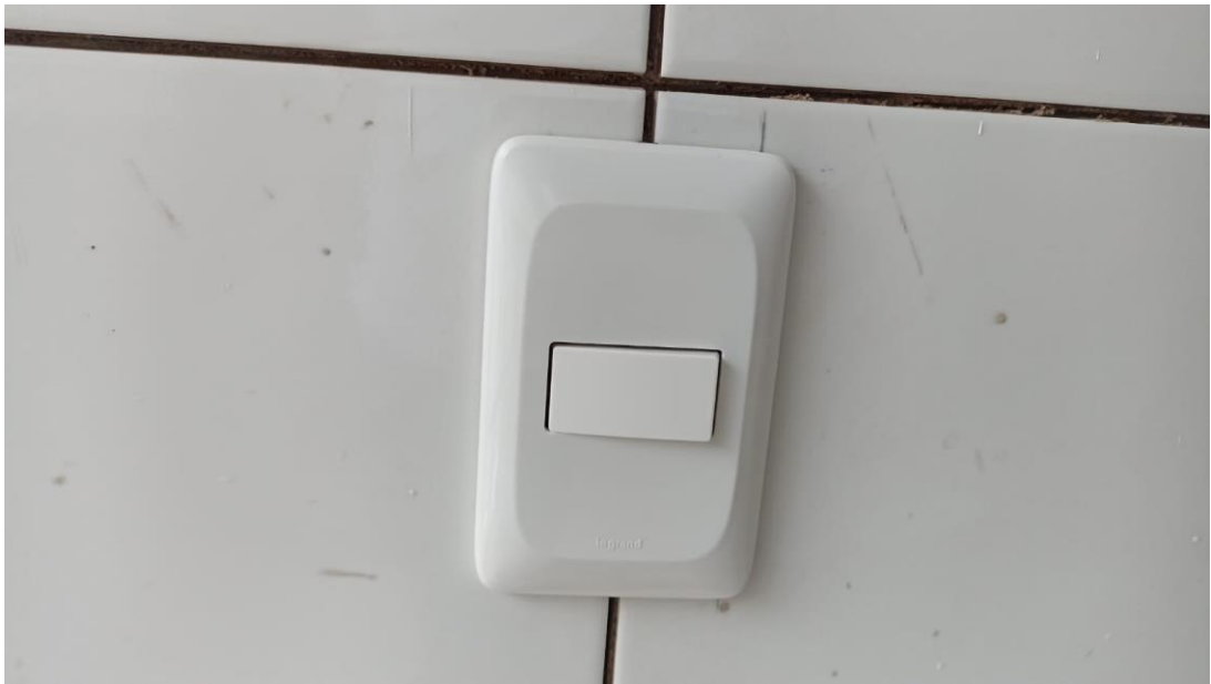
Figura 15 – Detalhe para interruptor uma tecla simples – pavimento superior