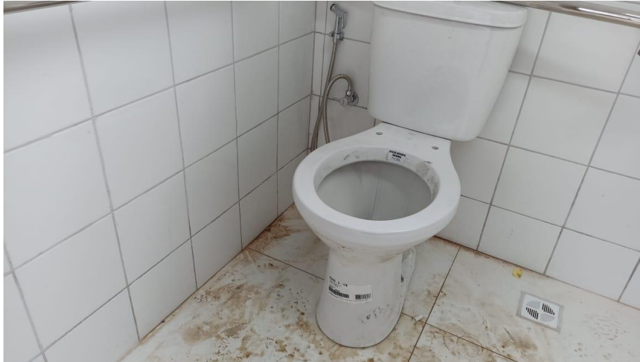
Figura 7 - Detalhe bacia sifonada para banheiro PNE e ducha – pavimento superior