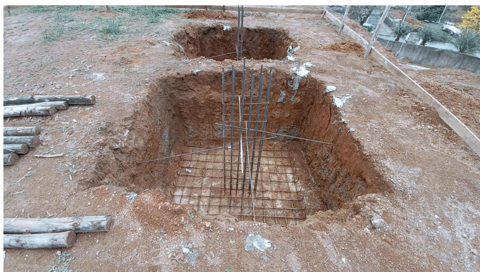
Figura 2 – Detalhe para escavação e armadura das sapatas