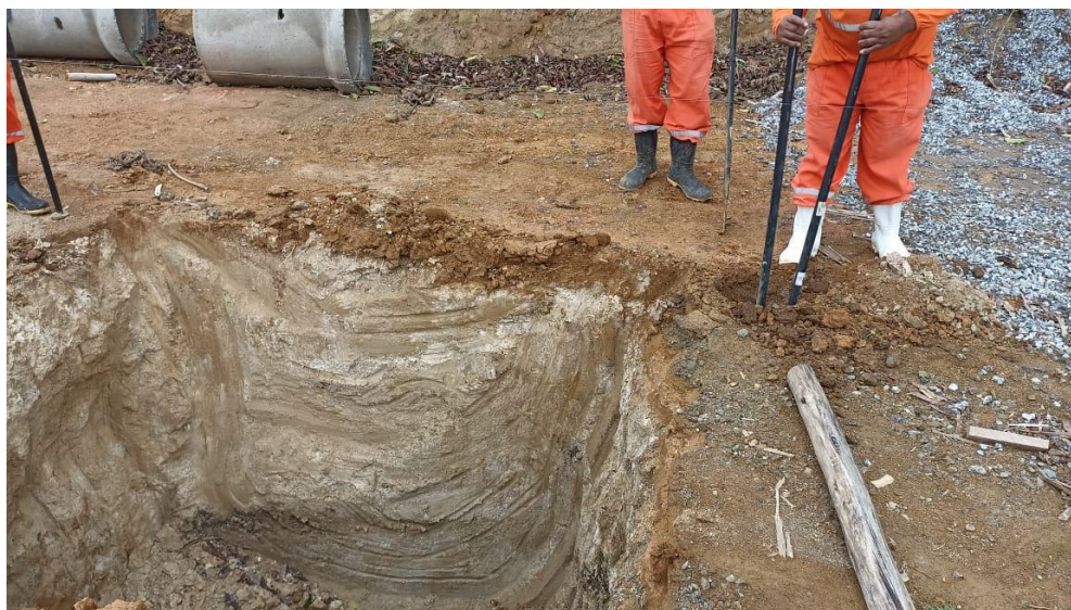
Figura 1 – Detalhe para escavação das sapatas