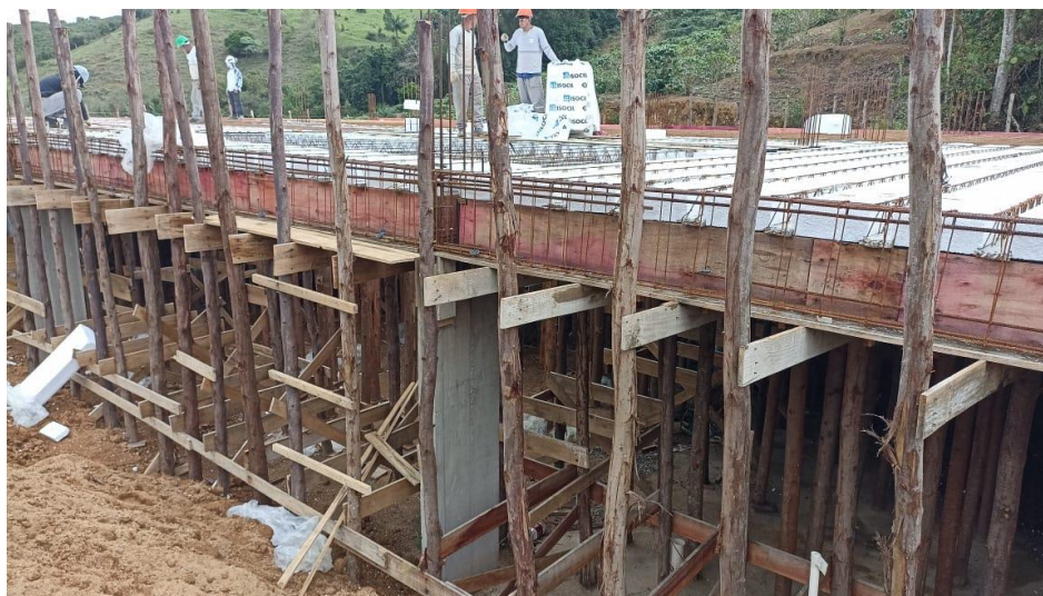
Figura 8 - Detalhe para formas e armaduras das vigas do térreo