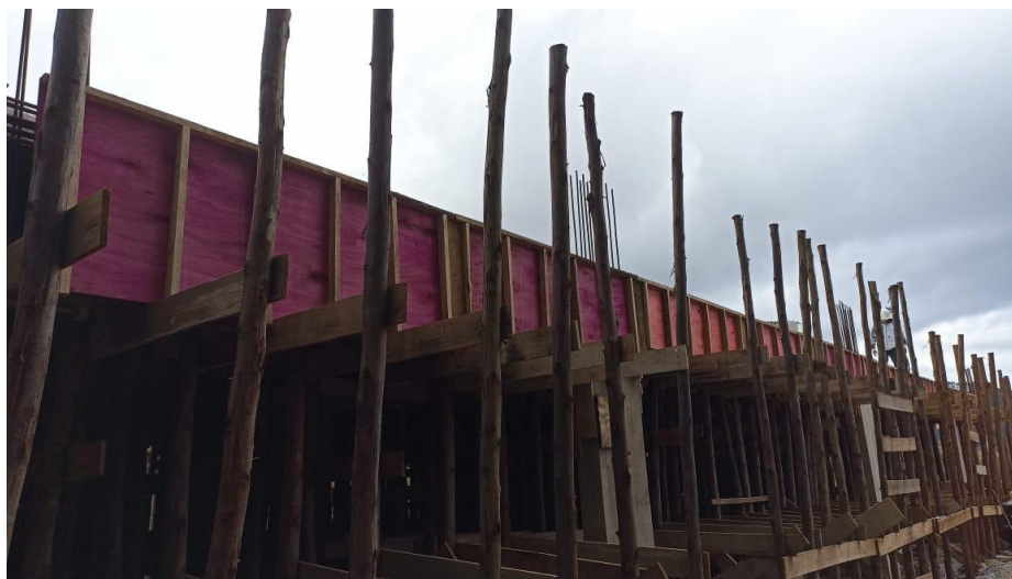
Figura 12 – Detalhe para formas e armaduras das vigas do térreo