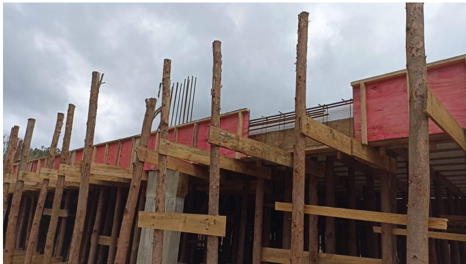
Figura 10 – Detalhe para formas e armaduras das vigas do térreo