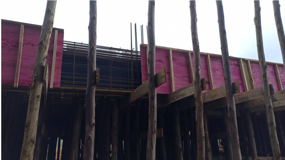
Figura 13 – Detalhe para formas e armaduras das vigas do térreo