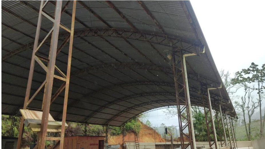
Figura 25 – Detalhe para retirada de gradil da quadra