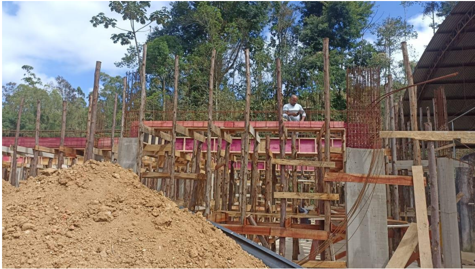
Figura 15 - Detalhe para pilares concretados do térreo