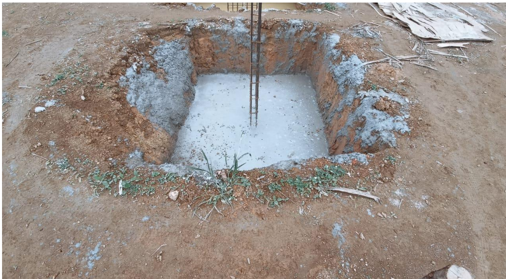
Figura 4- Detalhe para concretagem das sapatas