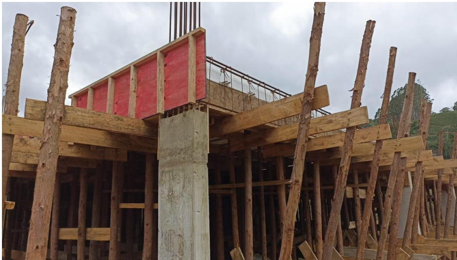
Figura 11 – Detalhe para formas e armaduras das vigas do térreo