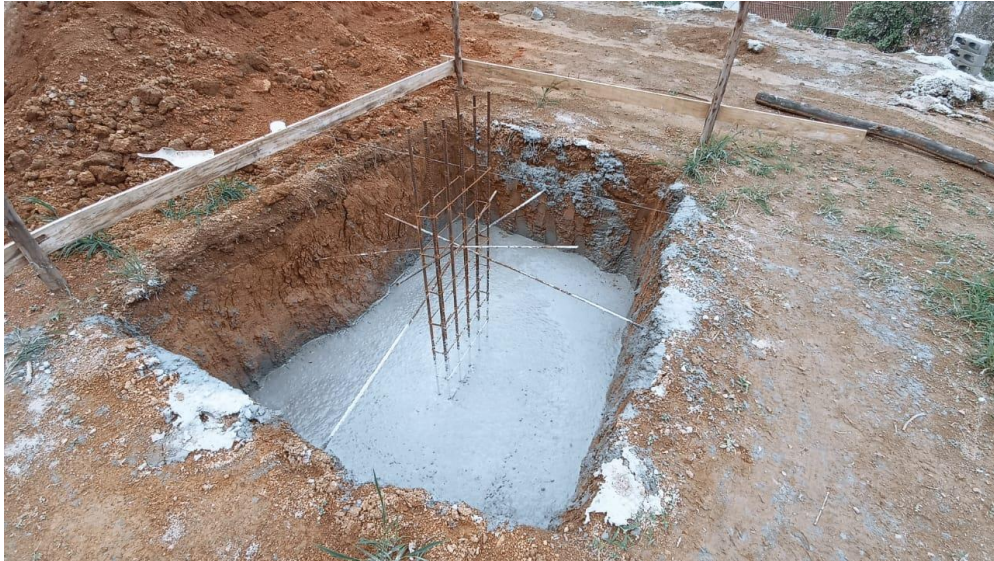
Figura 3 – Detalhe para concretagem das sapatas