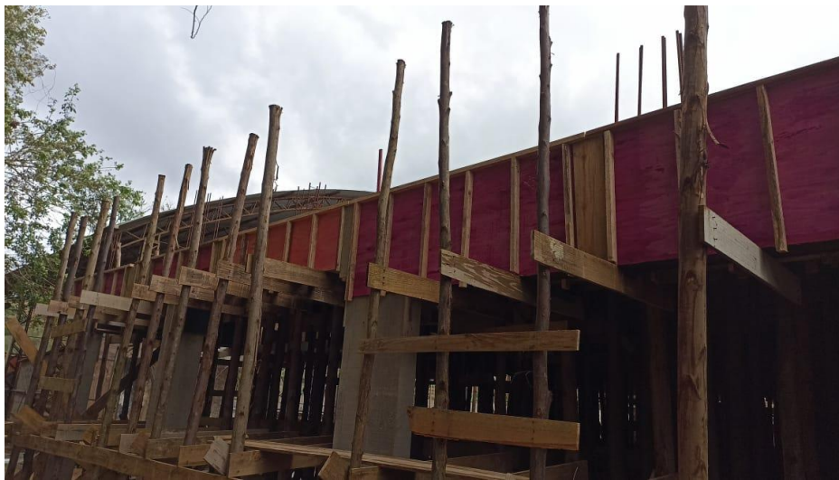
Figura 14 – Detalhe para formas e armaduras das vigas do térreo