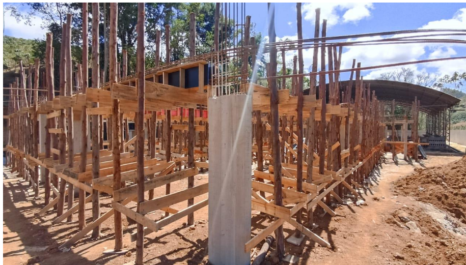
Figura 17 – Detalhe para pilares concretados do térreo