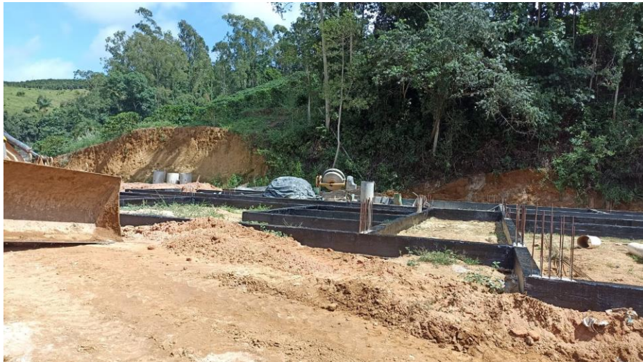
Figura 22 – Detalhe para impermeabilização vigas baldrames