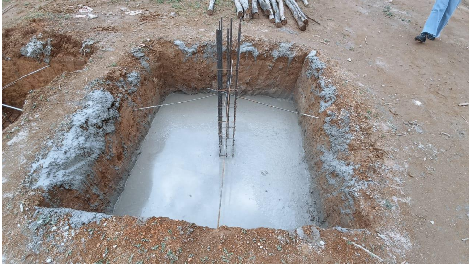
Figura 5- Detalhe para concretagem das sapatas