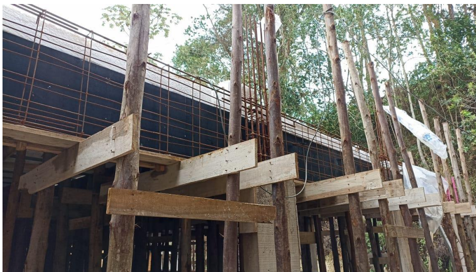
Figura 7 - Detalhe para formas e armaduras das vigas do térreo