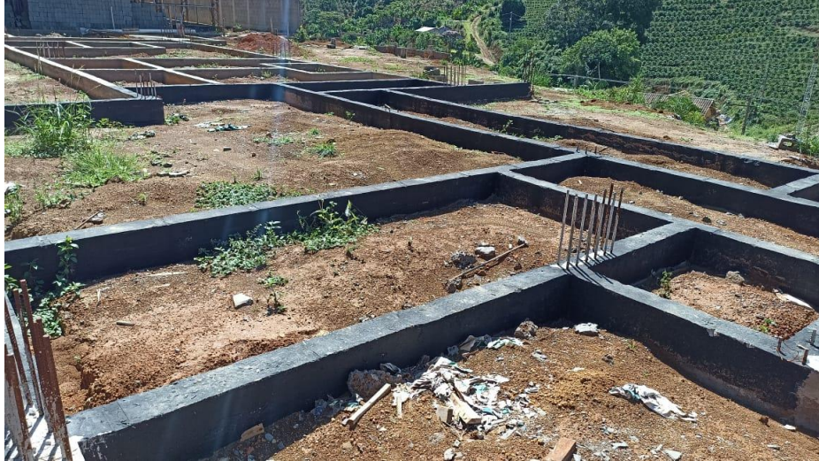
Figura 21 – Detalhe para impermeabilização vigas baldrames