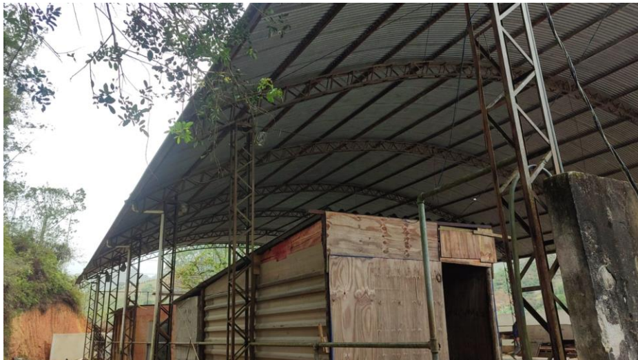
Figura 26 – Detalhe para retirada de gradil da quadra

Conceição do Castelo – ES, 22 outubro de 2025.