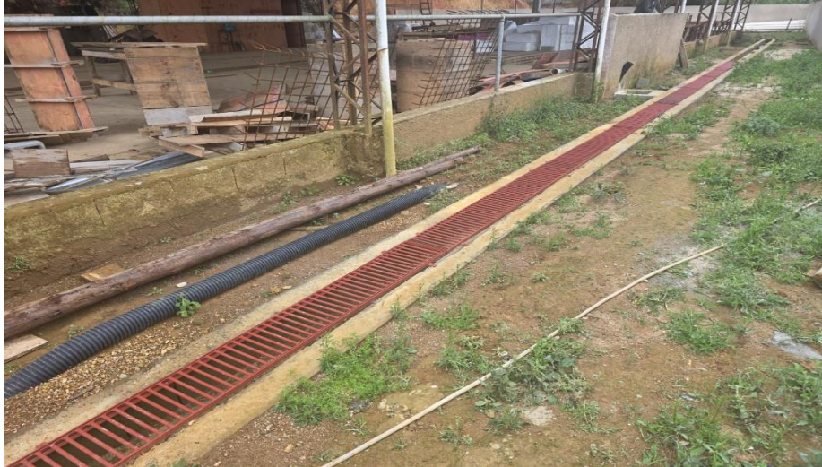
Figura 23 – Detalhe para grelha das canaletas