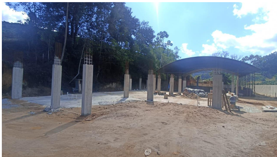
Figura 18 – Detalhe para pilares concretados do térreo