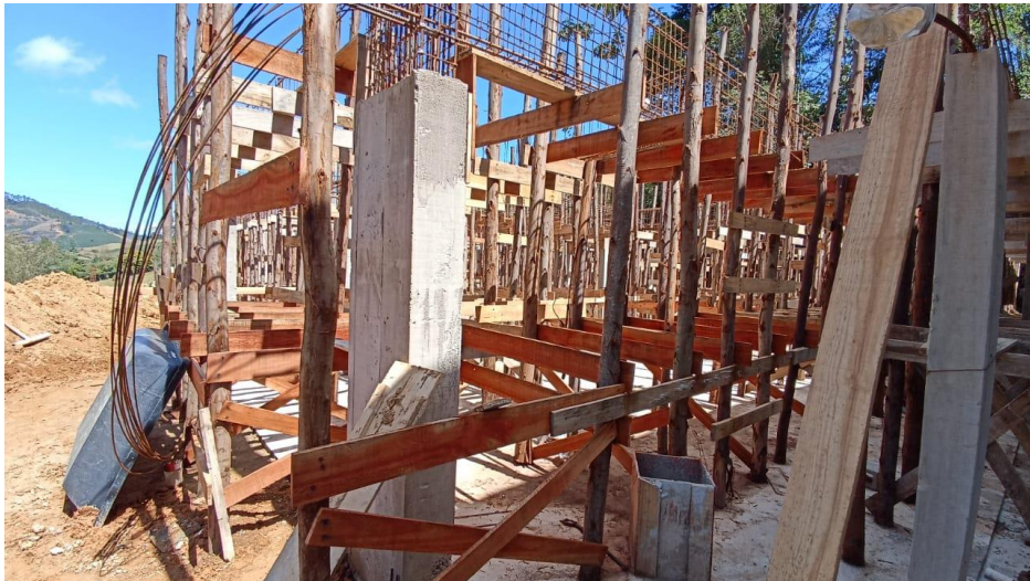
Figura 16 – Detalhe para pilares concretados do térreo