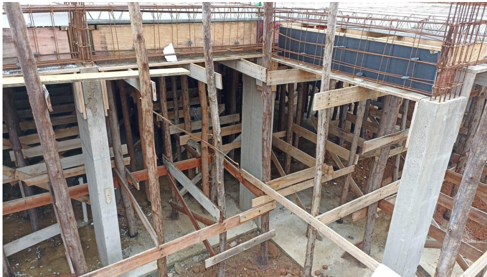
Figura 9 – Detalhe para formas e armaduras das vigas do térreo