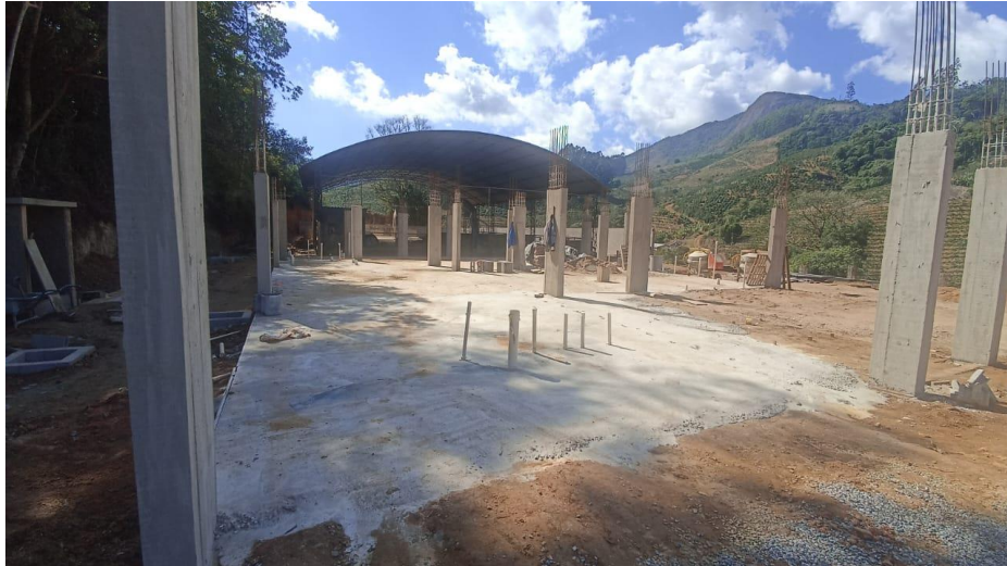
Figura 19 – Detalhe para pilares concretados do térreo