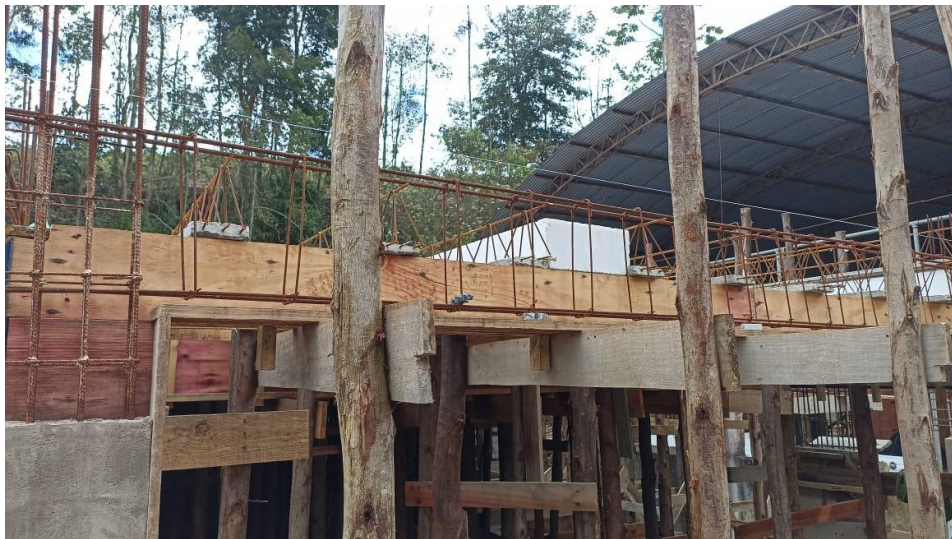
Figura 6 - Detalhe para formas e armaduras das vigas do térreo