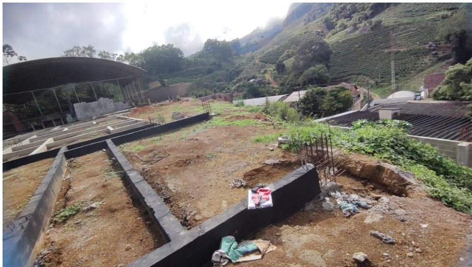
Figura 20 – Detalhe para impermeabilização vigas baldrame