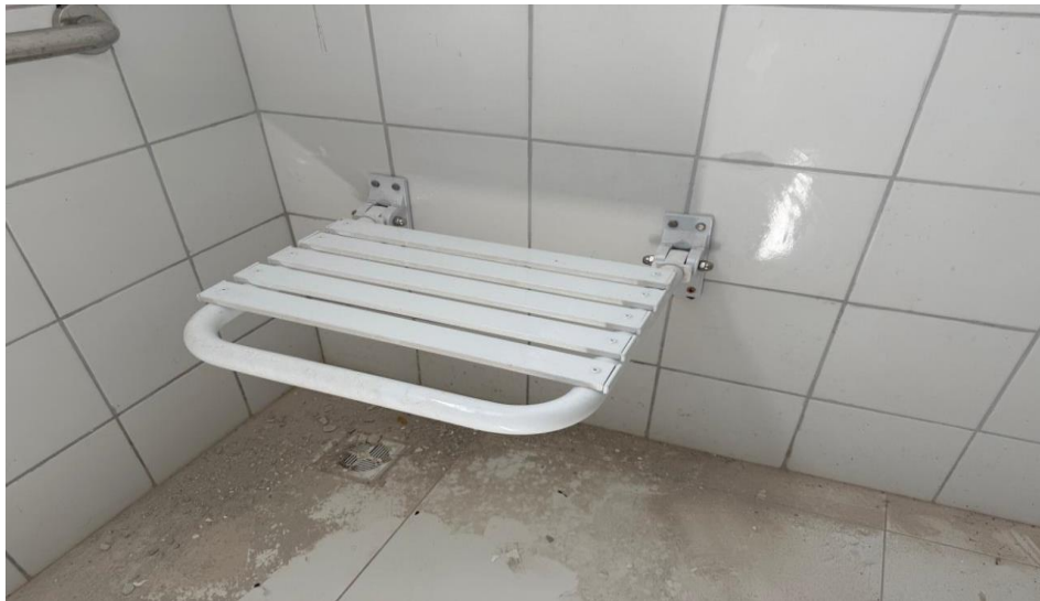
Figura 3 – Detalhe para banco articulado para pdc