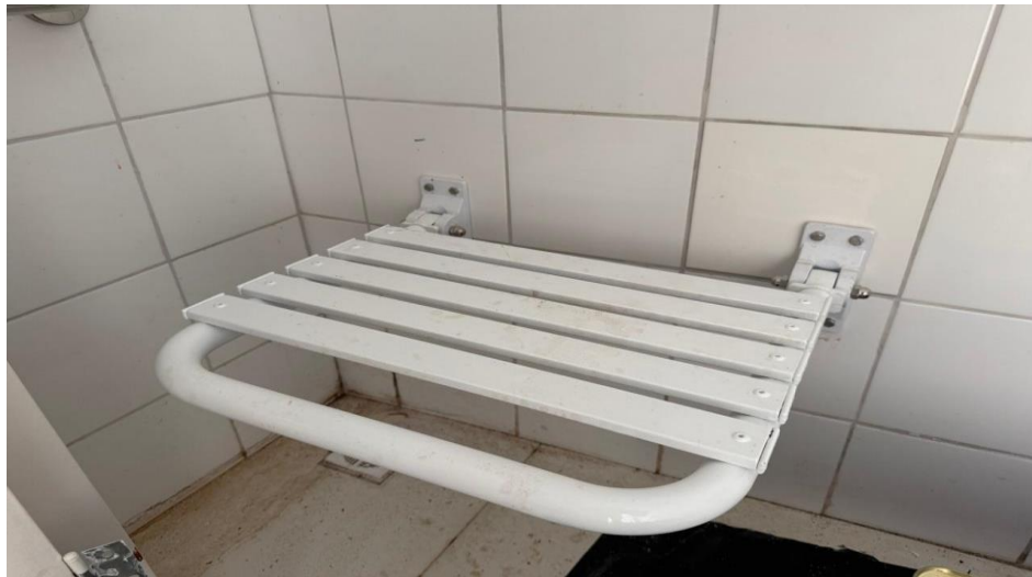
Figura 2 – Detalhe para banco articulado para pdc