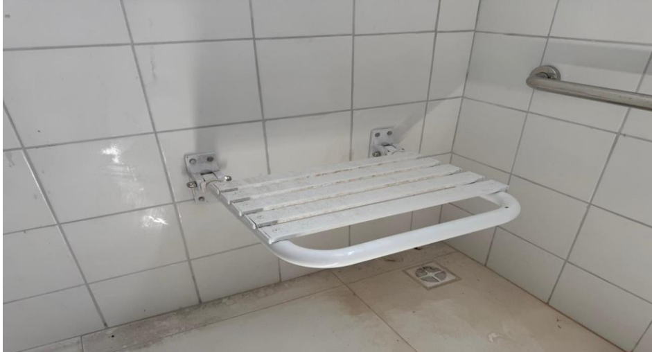
Figura 1 – Detalhe para banco articulado para pdc

OBJETO: RECONSTRUÇÃO DA EMEI VOVÓ CLARA CONTRATO: 078/2024