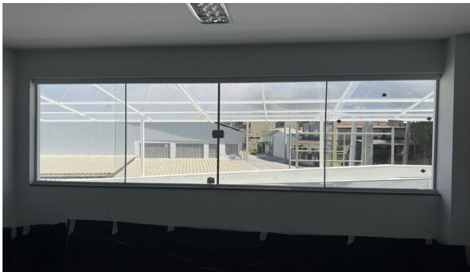
Figura 6 - Detalhe para janela de correr quatro folhas