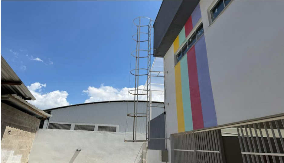
Figura 5 - Detalhe para escada tipo marinheiro