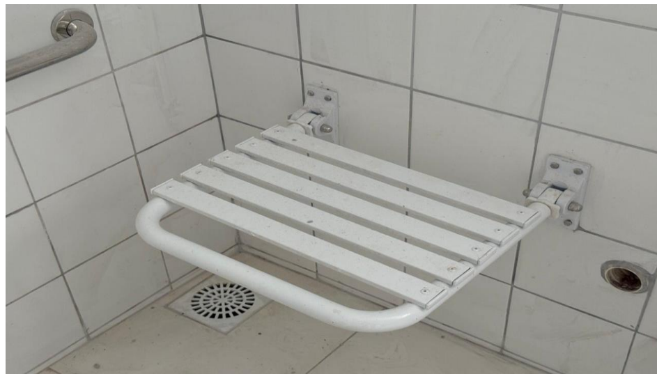
Figura 4 – Detalhe para banco articulado para pdc