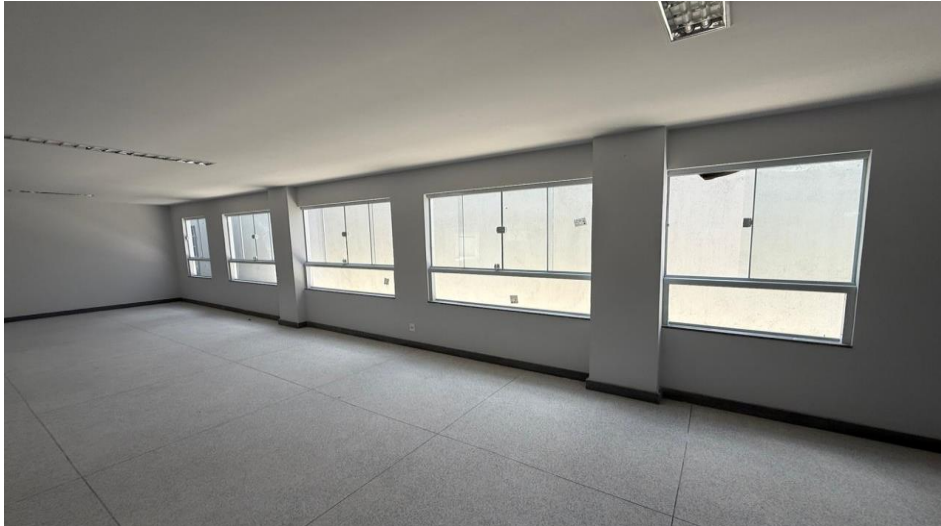
Figura 7 - Detalhe para janelas de correr quatro e duas folhas