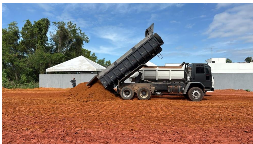
Figura 2: AQUISIÇÃO DE SOLO DE JAZIDA COMERCIAL (SAIBREIRA) - (BDI DIF 15,57%)