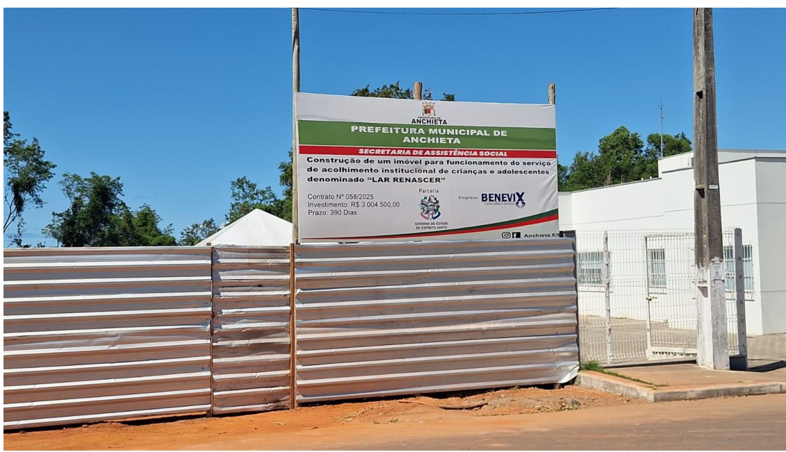
Figura 1: PLACA DE OBRA NAS DIMENSÕES DE 2.0 X 4.0 M, PADRÃO DER