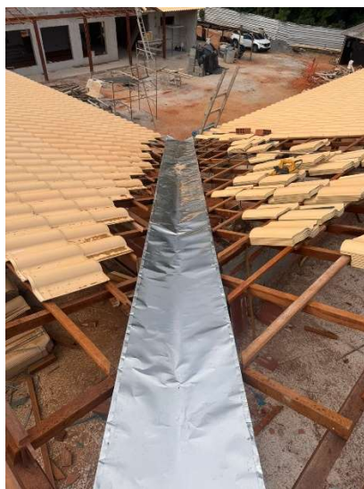
CALHA EM CHAPA DE AÇO GALVANIZADO NÚMERO 24, DESENVOLVIMENTO DE 100 CM, INCLUSO TRANSPORTE VERTICAL. AF_07/2019