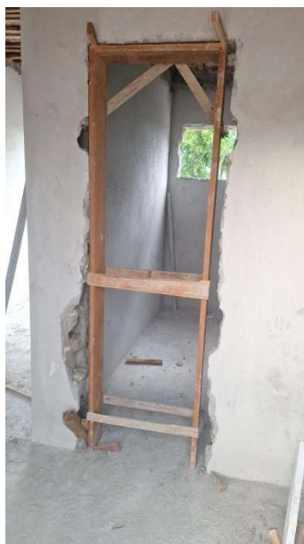
MARCO EM MADEIRA DE LEI TIPO PEROBA, IPÊ, ANGELIM PEDRA OU EQUIVALENTE, COM 15 X 3CM DE BATENTE, NAS DIMENSÕES: 0,60 X 2,10 M