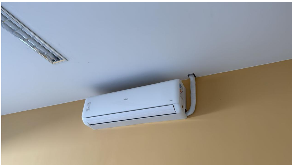
Figura 09: FORNECIMENTO E INSTALAÇÃO DE UNIDADE EVAPORADORA E CONDENSADORA DE AR CONDICIONADO TIPO SPLIT INVERTER PISO TETO DE 36.000 BTU'S 220V - CICLO QUENTE/FRIO CLASSIFICAÇÃO ENERGÉTICA A OU B (SELO PROCEL), INCLUSIVE AMORTECEDORES VIBRA-STOP