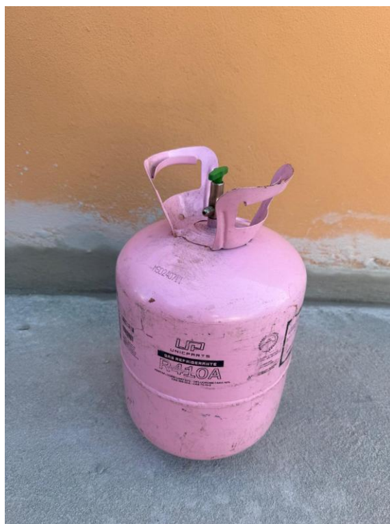
Figura 10: GÁS REFRIGERANTE R410A

Rua F, s/nº, Quadra 18, Bairro Portal de Anchieta, Anchieta – ES CEP. 29230-000 Tel.: (28) 3536-1755; 3536-2787; 3536-3675.