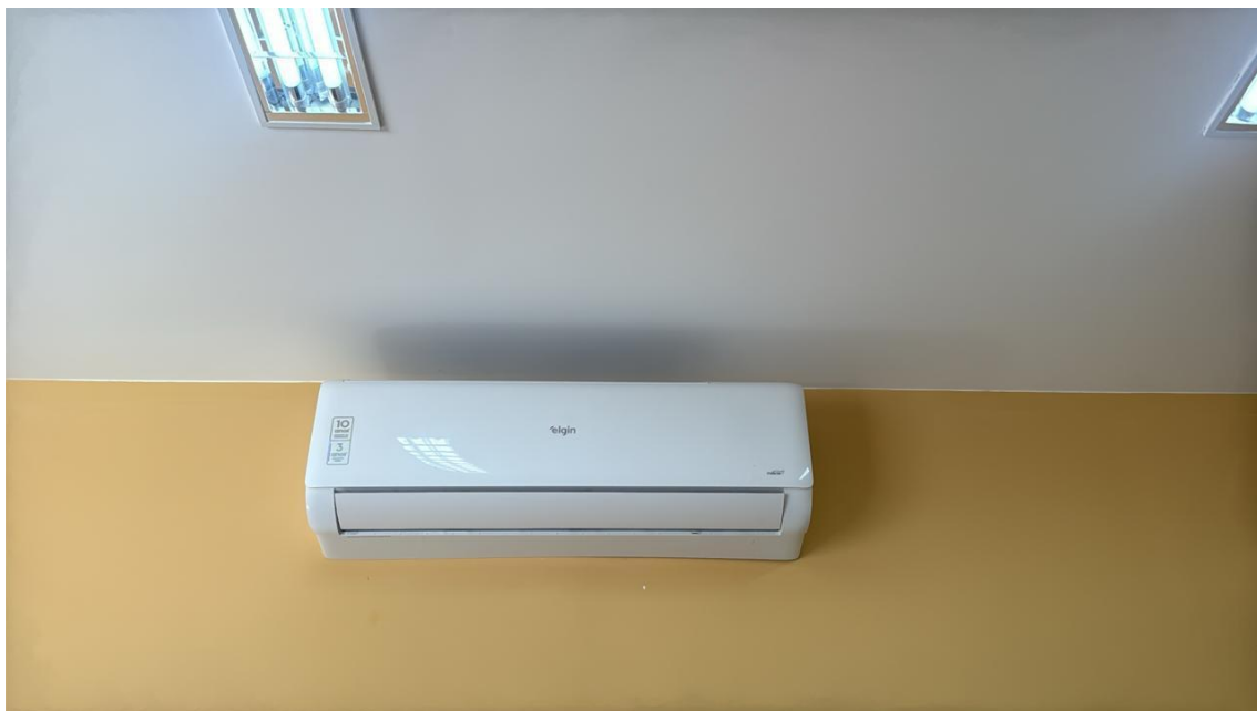
Figura 07: FORNECIMENTO E INSTALAÇÃO DE UNIDADE EVAPORADORA E CONDENSADORA DE AR CONDICIONADO TIPO SPLIT INVERTER HI-WALL (PAREDE) DE 24.000 BTU'S 220V - CICLO FRIO - CLASSIFICAÇÃO A (SELO PROCEL), INCLUSIVE AMORTECEDORES VIBRA-STOP