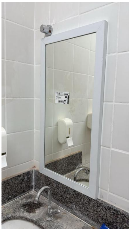
Figura 4: ESPELHO PARA BANHEIROS ESPESSURA 4 MM, INCLUINDO CHAPA COMPENSADA 10 MM, MOLDURA DE ALUMÍNIO EM PERFIL L 3/4", FIXADO COM PARAFUSOS CROMADOS

Rua F, s/nº, Quadra 18, Bairro Portal de Anchieta, Anchieta – ES CEP. 29230-000 Tel.: (28) 3536-1755; 3536-2787; 3536-3675.