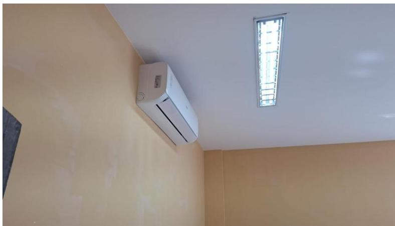
Figura 5: FORNECIMENTO E INSTALAÇÃO DE UNIDADE EVAPORADORA E CONDENSADORA DE AR CONDICIONADO TIPO SPLIT INVERTER HI-WALL (PAREDE) DE 12.000 BTU'S 220V - CICLO FRIO - CLASSIFICAÇÃO A (SELO PROCEL), INCLUSIVE AMORTECEDORES VIBRA-STOP