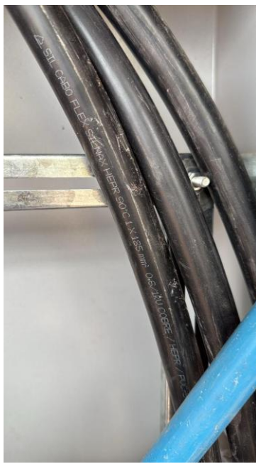
Figura 1: CABO DE COBRE TERMOPLÁSTICO, COM ISOLAMENTO PARA 1000V, SEÇÃO DE 185,0MM²

OBRA: CONTRATAÇÃO DE EMPRESA ESPECIALIZADA PARA CONSTRUÇÃO DA CRECHE MUNICIPAL DO BAIRRO ANCHIETA, LOCALIZADA NO MUNICÍPIO DE ANCHIETA, COM EMPREGO DE MÃO DE OBRA, MATERIAIS E EQUIPAMENTOS.