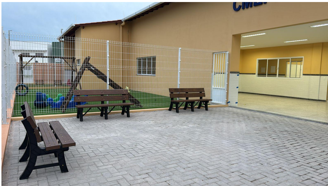
Figura 19: FORNECIMENTO DE BANCO SEM ENCOSTO 50 X 180CM EM MADEIRA CONFORME DETALHE DE PROJETO, TUDO INCLUÍDO.