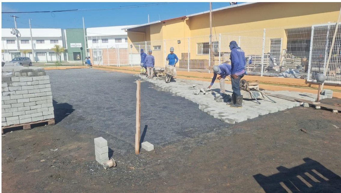
Figura 16: FORNECIMENTO E ASSENTAMENTO DE LADRILHO HIDRÁULICO PASTILHADO, VERMELHO, DIM. 20X20 CM, ESP. 1.5CM, ASSENTADO COM PASTA DE CIMENTO COLANTE, EXCLUSIVE REGULARIZAÇÃO E LASTRO

Rua F, s/nº, Quadra 18, Bairro Portal de Anchieta, Anchieta – ES CEP. 29230-000 Tel.: (28) 3536-1755; 3536-2787; 3536-3675.