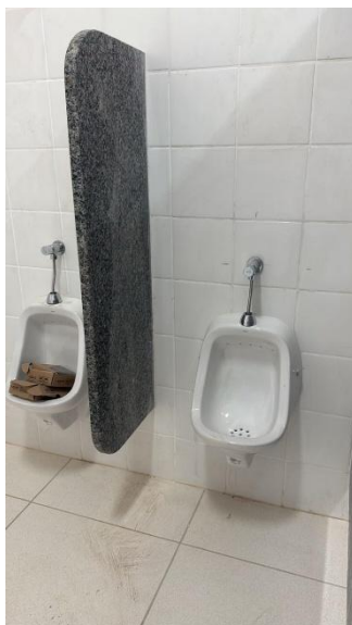
Figura 2: MICTÓRIO SIFONADO LOUÇA BRANCA □ PADRÃO MÉDIO □ FORNECIMENTO E INSTALAÇÃO. AF_01/2020