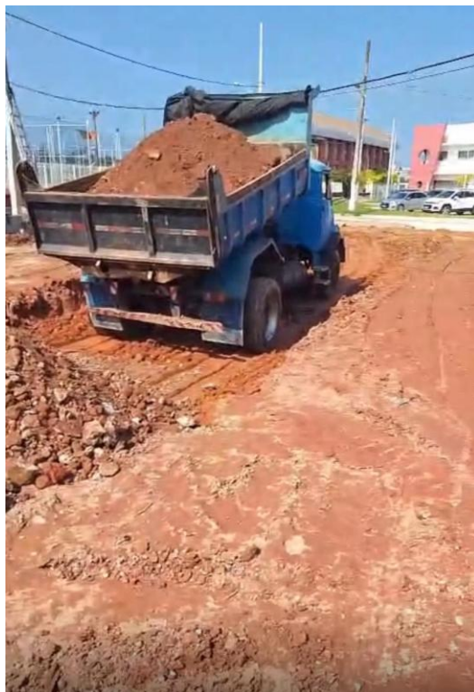
Figura 14: TRANSPORTE COM CAMINHÃO BASCULANTE DE 10 M 3 - RODOVIA PAVIMENTADA