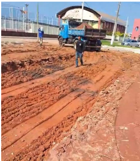
Figura 13: CARGA, MANOBRA E DESCARGA DE SOLOS E MATERIAIS GRANULARES EM CAMINHÃO BASCULANTE 10 M 3 - CARGA COM ESCAVADEIRA HIDRÁULICA (CAÇAMBA DE 1,20 M 3 / 155 HP) E DESCARGA LIVRE (UNIDADE: T). AF_07/2020