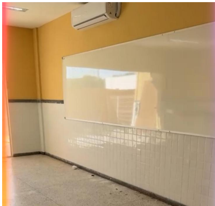
Figura 21: QUADRO PINCEL NOVO, COMPLETO, DE LAMINADO MELAMÍNICO ALTA PRESSÃO, "LOUSA" QUADRICULADO, COR BRANCO BRILHANTE, LINHA LOUSAS, PADRÃO F608 BRANCOLINE, ESP. 1MM, INCL. REQUADRO MADEIRA 2.5 X 5.0 CM E PORTA PINCEL, DIM. 3.95 X 1.29 M