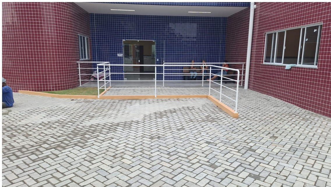
Figura 17: GUARDA-CORPO DE AÇO GALVANIZADO DE 1,10M DE ALTURA, MONTANTES TUBULARES DE 1.1/2" ESPAÇADOS DE 1,20M, TRAVESSA SUPERIOR DE 2", GRADIL FORMADO POR BARRAS CHATAS EM FERRO DE 32X4,8MM, FIXADO COM CHUMBADOR MECÂNICO. AF_04/2019_P