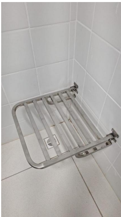
Figura 3: BANCO ARTICULADO, EM ACO INOX, PARA PCD, FIXADO NA PAREDE - FORNECIMENTO E INSTALAÇÃO. AF_01/2020