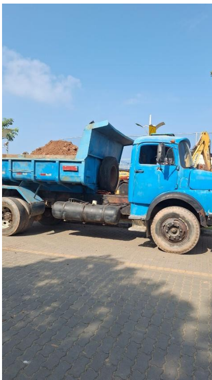
Figura 15: TRANSPORTE COM CAMINHÃO BASCULANTE DE 10 M 3 - RODOVIA EM LEITO NATURAL