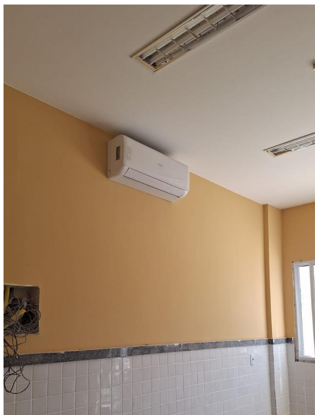
Figura 08: FORNECIMENTO E INSTALAÇÃO DE UNIDADE EVAPORADORA E CONDENSADORA DE AR CONDICIONADO TIPO SPLIT INVERTER HI-WALL (PAREDE) DE 30.000 BTU'S 220V - CICLO QUENTE/FRIO - CLASSIFICAÇÃO A (SELO PROCEL), INCLUSIVE AMORTECEDORES VIBRA-STOP

Rua F, s/nº, Quadra 18, Bairro Portal de Anchieta, Anchieta – ES CEP. 29230-000