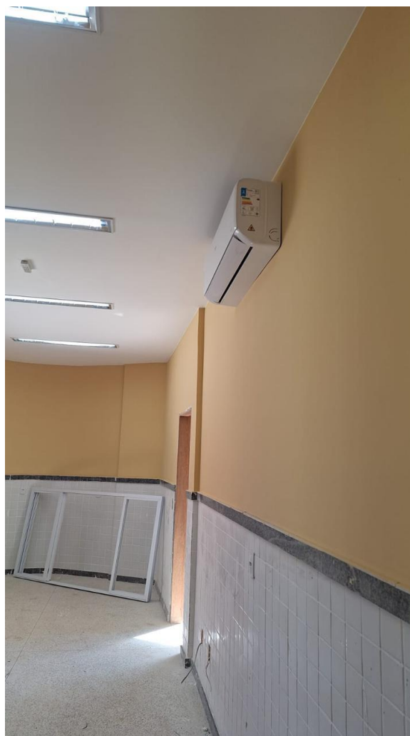
Figura 6: FORNECIMENTO E INSTALAÇÃO DE UNIDADE EVAPORADORA E CONDENSADORA DE AR CONDICIONADO TIPO SPLIT INVERTER HI-WALL (PAREDE) DE 18.000 BTU'S 220V - CICLO FRIO - CLASSIFICAÇÃO A (SELO PROCEL), INCLUSIVE AMORTECEDORES VIBRA-STOP

Rua F, s/nº, Quadra 18, Bairro Portal de Anchieta, Anchieta – ES CEP. 29230-000 Tel.: (28) 3536-1755; 3536-2787; 3536-3675.