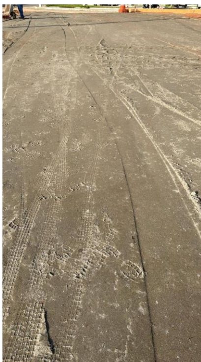
Figura 12: BASE DE BRITA GRADUADA, INCLUSIVE FORNECIMENTO, EXCLUSIVE TRANSPORTE DA BRITA EM VIAS URBANAS

Rua F, s/nº, Quadra 18, Bairro Portal de Anchieta, Anchieta – ES CEP. 29230-000 Tel.: (28) 3536-1755; 3536-2787; 3536-3675.