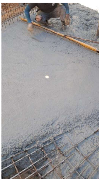
Figura 45 e 46: ITEM 09.02.04 – CONCRETO FCK 30MPA