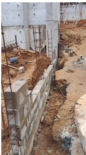
Figura 15 e 16: ITEM 05.05.01 – MURO PADRÃO CESAN