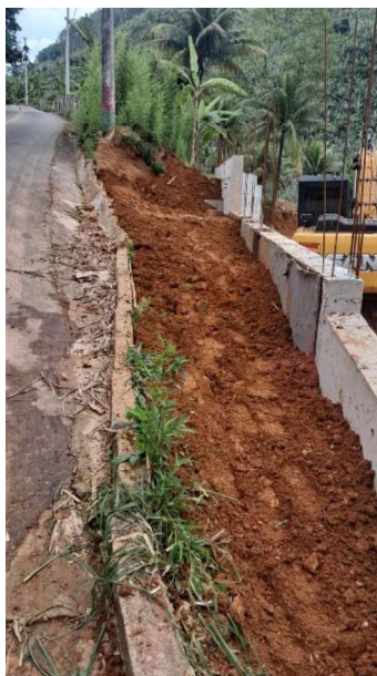
Figura 31 e 32: ITEM 06.02.05 – REATERRO