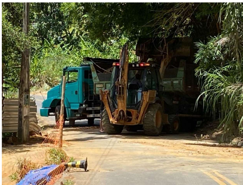
Figura 13 e 14: ITEM 05.03.07 – REMOÇÃO DE ENTULHO