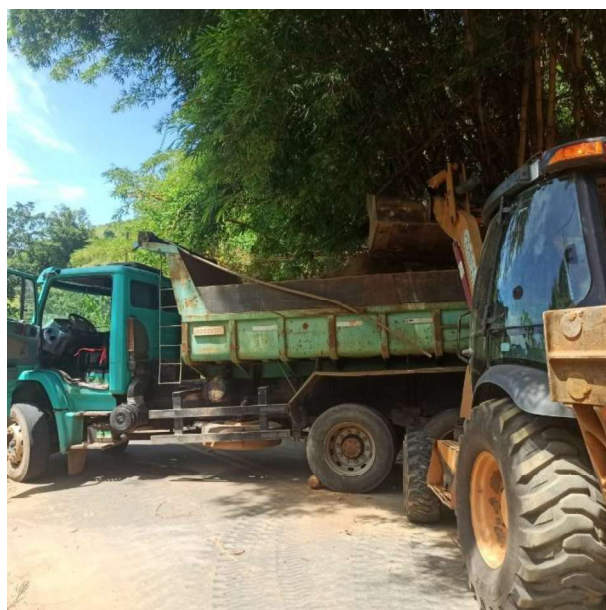
Figura 33 e 34: ITEM 06.02.06 – REMOÇÃO DE ENTULHO