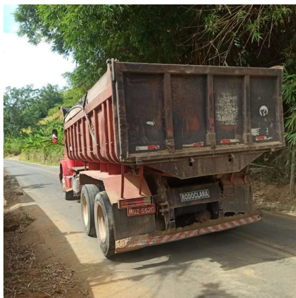
Figura 9 e 10: ITEM 05.03.05 – TRANSPORTE BASCULANTE