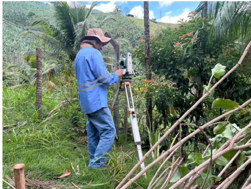
Figura 35 e 36: ITEM 08.01.01 – TOPOGRAFIA