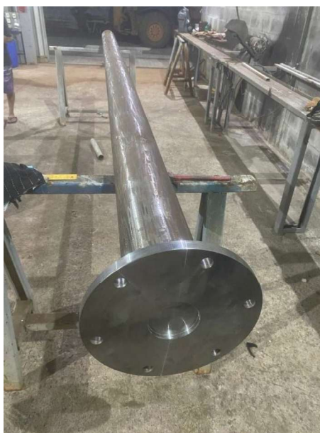
Figura 47 e 48: ITEM 09.04.01 – MONTAGEM DO DECANTADOR