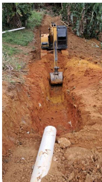
Figura 25 e 26: ITEM 06.02.02 – ESCAVAÇÃO PARA VALA