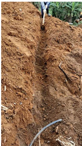
Figura 1 e 2: ITEM 04.03.01 – ESCAVAÇÃO DE VALA