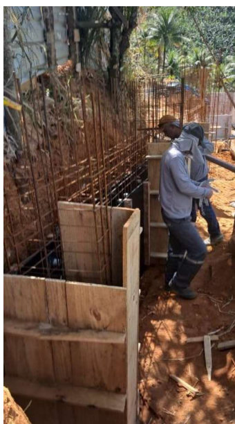
Figura 41 e 42: ITEM 09.02.02 – FORMA PARA PILAR