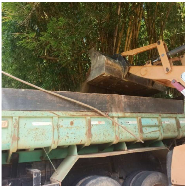
Figura 11 e 12: ITEM 05.03.06 – TRANSPORTE BASCULANTE VIA PAVIMENTADA