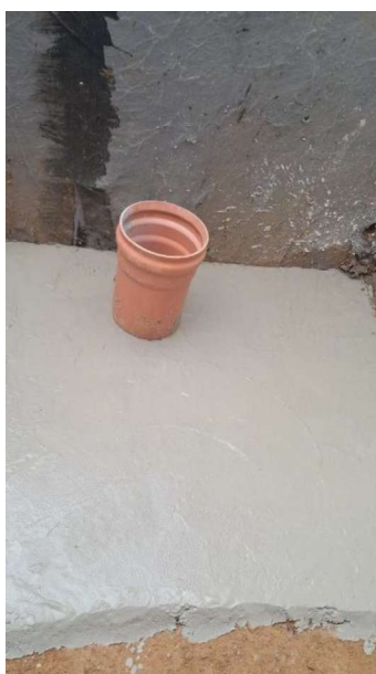
Figura 39 e 40: ITEM 09.02.01 – CONCRETO MAGRO