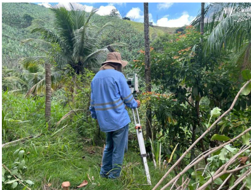
Figura 21 e 22: ITEM 06.1.02 – LOCAÇÃO