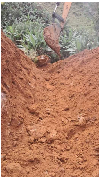
Figura 5 e 6: ITEM 05.03.01 – ESCAVAÇÃO HORIZONTAL