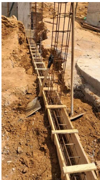
Figura 29 e 30: ITEM 06.02.04 – ESCAVAÇÃO PARA VIGA