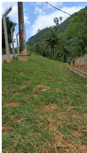
Figura 17 e 18: ITEM 05.06.01 – PLANTIO DE GRAMA