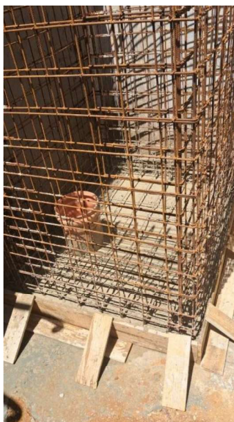
Figura 43 e 44: ITEM 09.02.03 – ARMAÇÃO DE ESTRUTURA