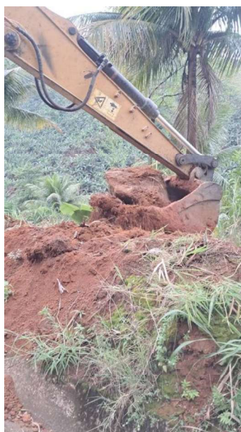
Figura 27 e 28: ITEM 06.02.03 – ESCAVAÇÃO MECÂNZADA