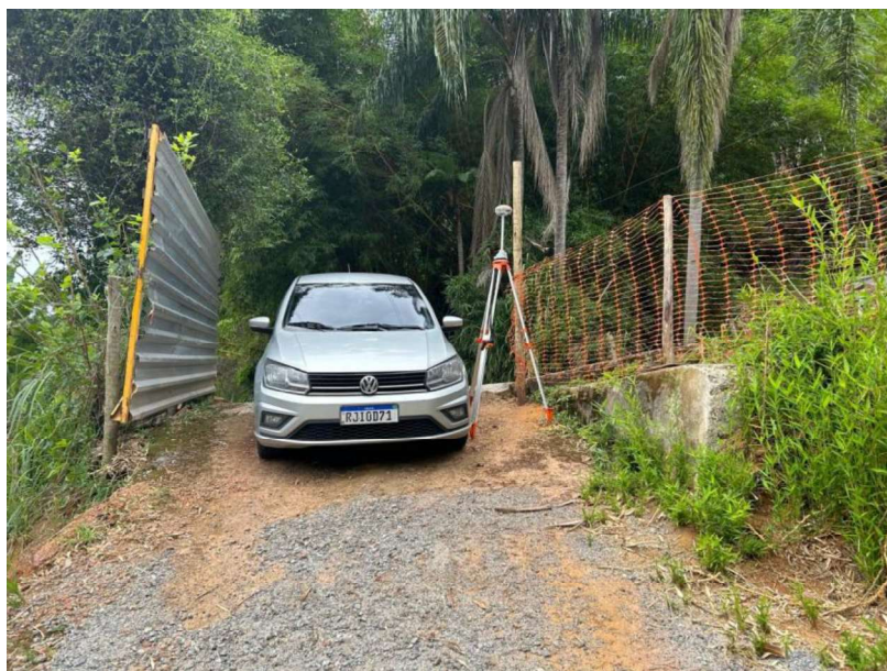
Figura 37 e 38: ITEM 08.01.02 – LOCAÇÃO