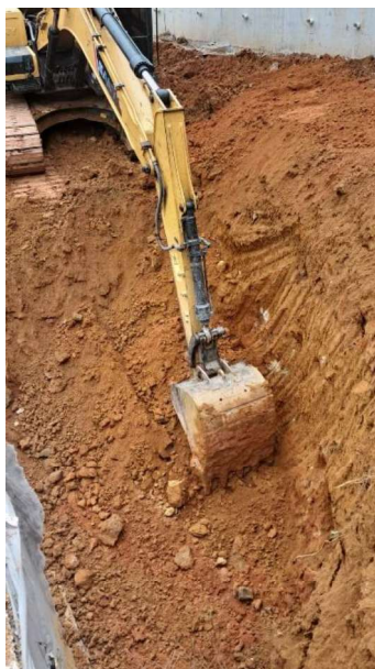
Figura 23 e 24: ITEM 06.02.01 – ESCAVAÇÃO PARA BLOCO