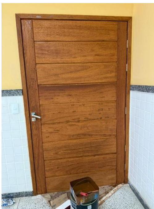
Figura 2: PORTA EM MADEIRA COMPENSADA, LISA, SEMI-ÔCA, 0.90 X 2.10 M, PARA SANITÁRIO DE DEFICIENTE FÍSICO (INCLUSIVE MARCO, BATENTE, FERRAGENS, FECHADURA, SUPORTE E CHAPA DE ALUMÍNIO E=1MM, EXCLUSIVE ALIZAR)