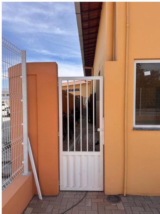
Figura 6: PORTÃO DE FERRO DE ABRIR EM BARRA CHATA, CHAPA E TUBO, INCLUSIVE CHUMBAMENTO