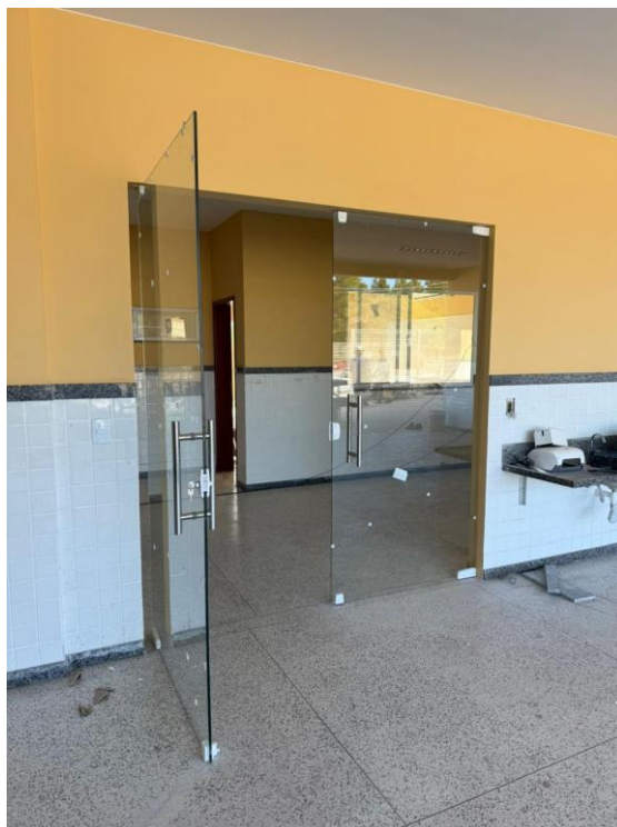
Figura 8: PORTA DE VIDRO TEMPERADO DUAS FOLHAS DE ABRIR, INCLUSIVE FERRAGENS E VIDRO. FORNECIMENTO E COLOCAÇÃO. DIM 1,80 X 2,00M