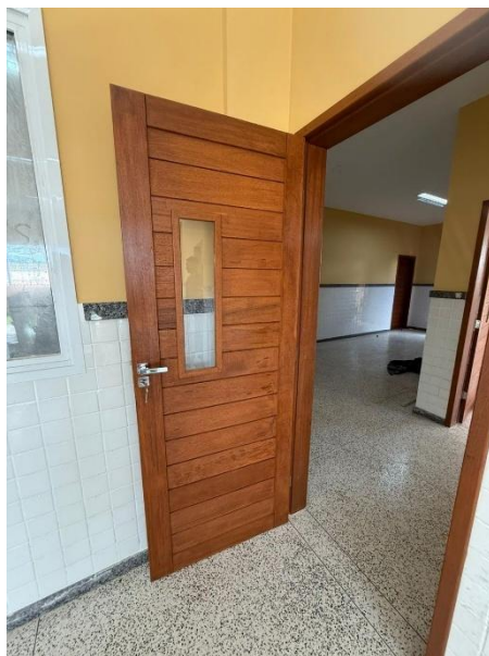
Figura 3: PORTA EM MADEIRA DE LEI TIPO ANGELIM PEDRA OU EQUIV. C/ ENCHIMENTO EM MADEIRA DE 1ª QUALIDADE ESP. 30MM, COM VISOR DE VIDRO, INCLUSIVE ALIZARES, DOBRADIÇAS E FECHADURAS EXTERNAS EM LATÃO CROMADO LA FONTE/EQUIV. EXCLUSIVE MARCO, NAS DIMENSÕES: 0.80 X 2.10 M