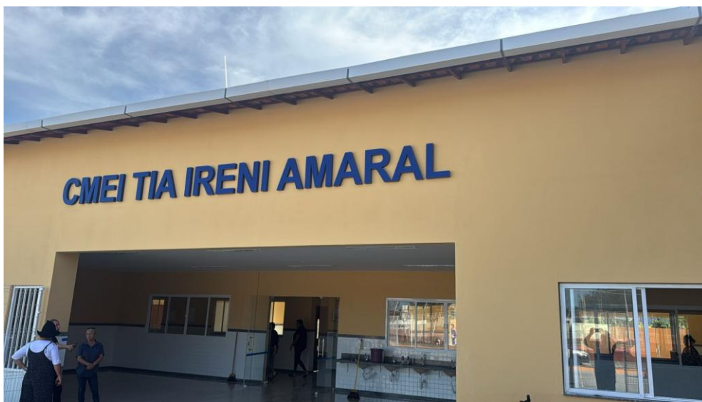
Figura 1: LETREIRO DE IDENTIFICAÇÃO EM RELEVO INOX COM 25 LETRAS COM 40 CM DE ALTURA, FORNECIMENTO E INSTALAÇÃO.

OBRA: CONTRATAÇÃO DE EMPRESA ESPECIALIZADA PARA CONSTRUÇÃO DA CRECHE MUNICIPAL DO BAIRRO ANCHIETA, LOCALIZADA NO MUNICÍPIO DE ANCHIETA, COM EMPREGO DE MÃO DE OBRA, MATERIAIS E EQUIPAMENTOS.