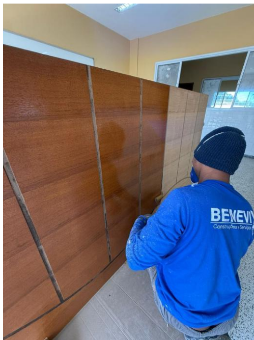
Figura 12: PINTURA COM VERNIZ BRILHANTE, LINHA PREMIUM, MARCAS DE REFERÊNCIA SUVINIL, CORAL OU METALATEX, EM MADEIRA, A TRÊS DEMÃOS