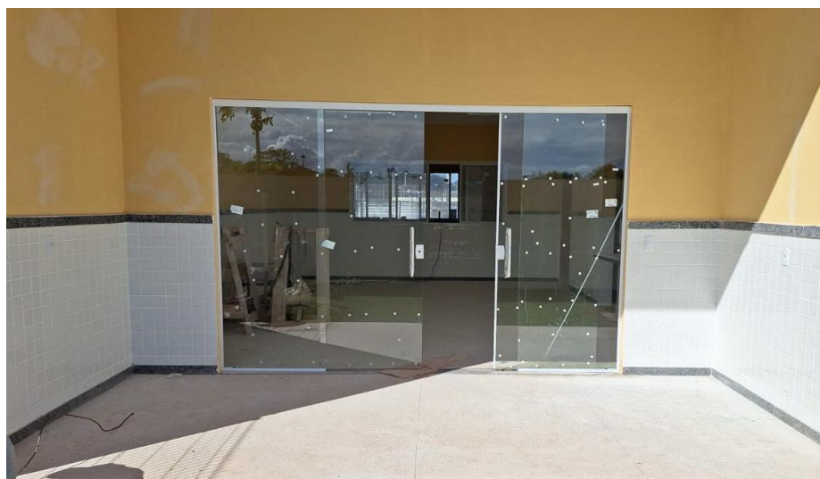
Figura 7: PORTA DE VIDRO TEMPERADO DUAS FOLHAS DE ABRIR, INCLUSIVE FERRAGENS E VIDRO. FORNECIMENTO E COLOCAÇÃO. DIM 3,00 X 2,10M