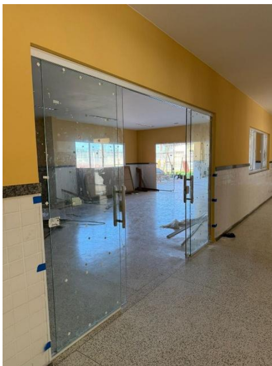
Figura 6: PORTA EM VIDRO DE CORRER EM VIDRO 3,50 X 2,30M TEMPERADO 10MM, QUATRO FOLHAS, INCLUSIVE FERRAGENS, VIDRO E INSTALAÇÃO.

Rua F, s/nº, Quadra 18, Bairro Portal de Anchieta, Anchieta – ES CEP. 29230-000 Tel.: (28) 3536-1755; 3536-2787; 3536-3675.