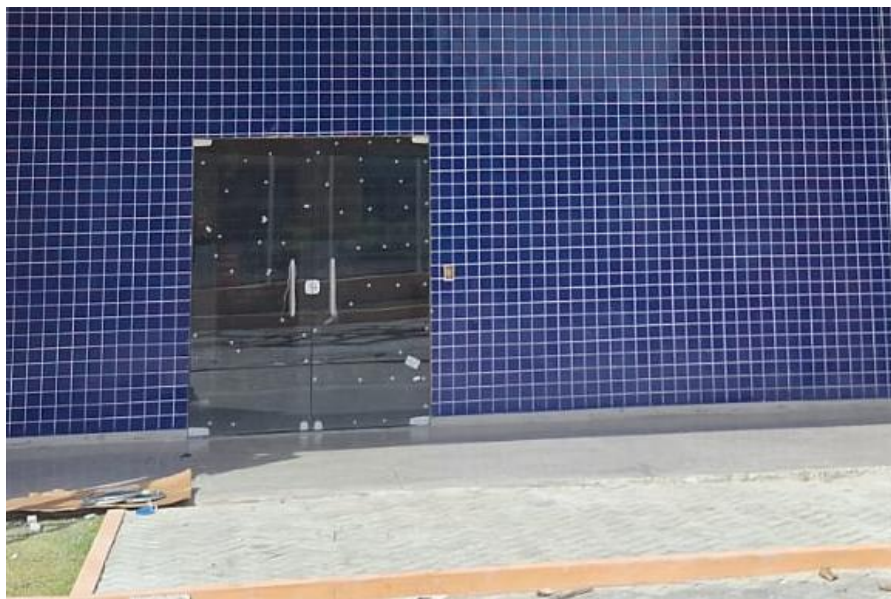
Figura 10: PORTA DE ABRIR DE 1,80 X 2,10M, EM VIDRO TEMPERADO, 2 FOLHAS, COM BARRA ANTIPÂNICO, ESPESSURA 10MM, INCLUSIVE ACESSÓRIOS.