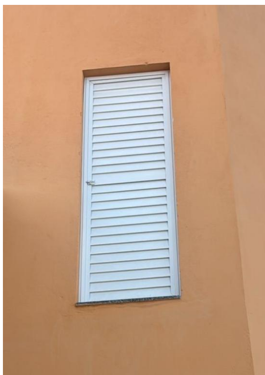
Figura 9: PORTA EM ALUMÍNIO DE ABRIR TIPO VENEZIANA COM GUARNIÇÃO, FIXAÇÃO COM PARAFUSOS - FORNECIMENTO E INSTALAÇÃO. AF_12/2019

Rua F, s/nº, Quadra 18, Bairro Portal de Anchieta, Anchieta – ES CEP. 29230-000 Tel.: (28) 3536-1755; 3536-2787; 3536-3675.