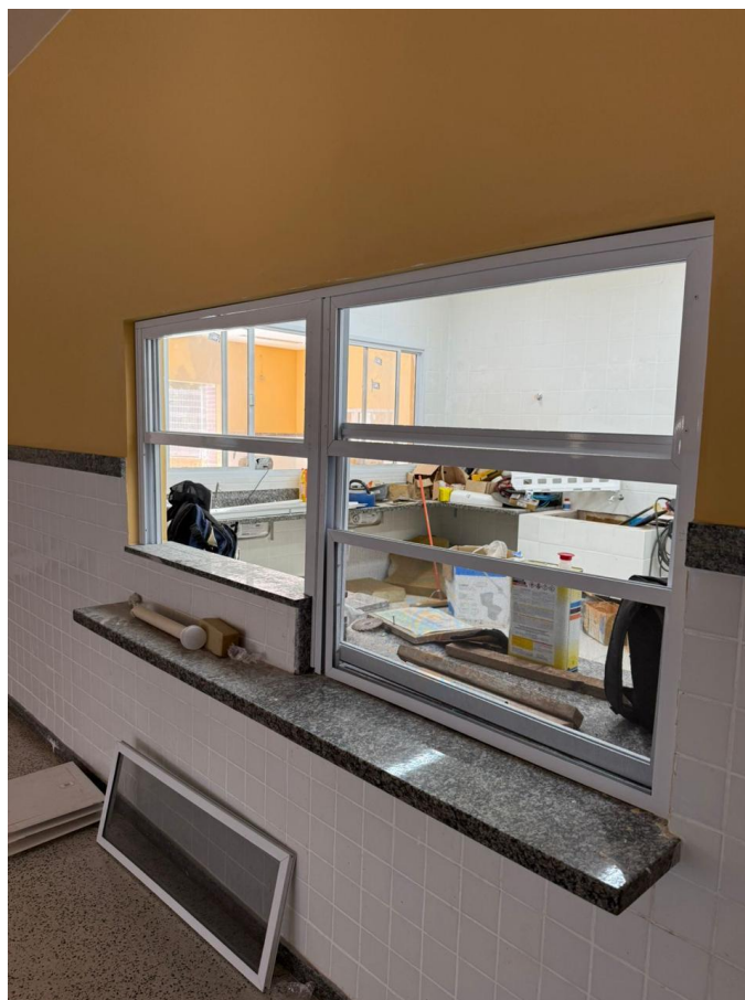
Figura 11: JANELA DE ALUMINIO TPO GUILHOTINA, PASSA PRATO, INCLUSIVE VIDRO, BANCADA, FORNECIMENTO E INSTALAÇÃO.

Rua F, s/nº, Quadra 18, Bairro Portal de Anchieta, Anchieta – ES CEP. 29230-000 Tel.: (28) 3536-1755; 3536-2787; 3536-3675.