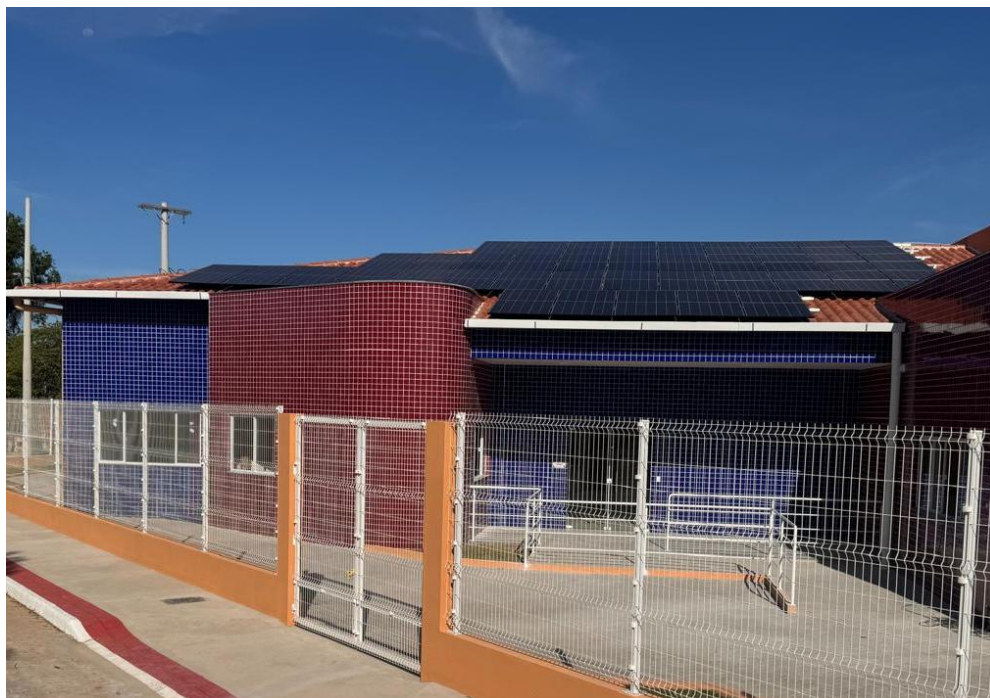
Figura 13: FORNECIMENTO E INSTALAÇÃO DE SISTEMA FOTOVOLTAICO

Rua F, s/nº, Quadra 18, Bairro Portal de Anchieta, Anchieta – ES CEP. 29230-000 Tel.: (28) 3536-1755; 3536-2787; 3536-3675.