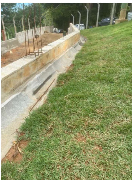
Figura 1 e 2: ITEM 02.07 – CANALETA