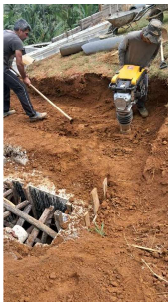
Figura 5 e 6: ITEM 05.03.03 – COMPACTAÇÃO