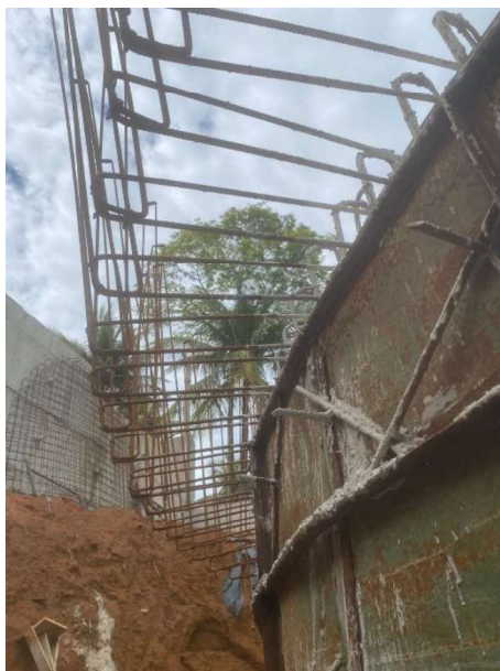
Figura 19 e 20: ITEM 12.04.02 – FORNECIMENTO E MONTAGEM DE CHICANA