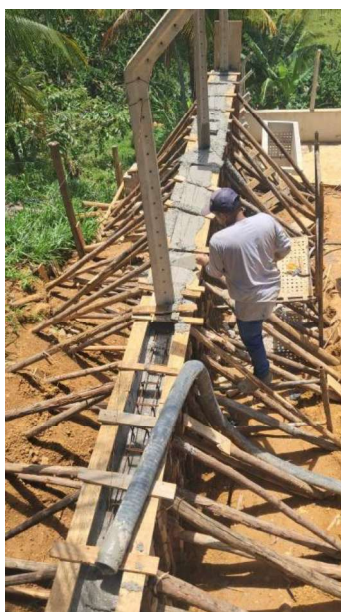
Figura 13 e 14: ITEM 09.02.04 –CONCRETO FCK 30MPA