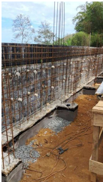
Figura 23 e 24: ITEM 16.02 – CORTE E DOBRA DE AÇO DE 6,3 A 10,0MM