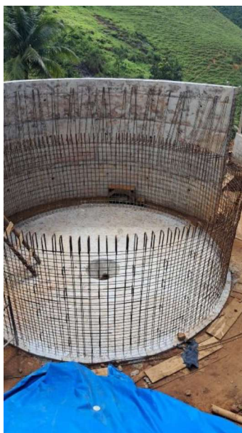
Figura 11 e 12: ITEM 09.02.03 – ARMAÇÃO DE ESTRUTURAS DE CONCRETO ARMADO