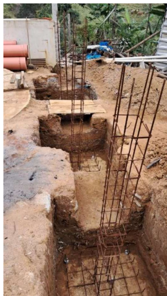
Figura 25 e 26: ITEM 16.03 – CORTE E DOBRA DE AÇO DE 4,0 A 7,0MM