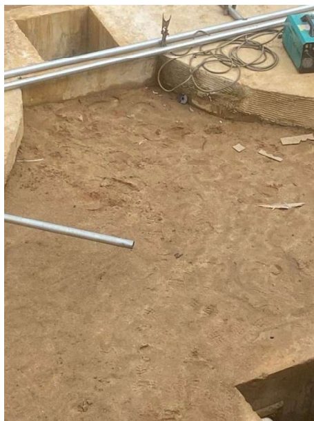
Figura 3 e 4: ITEM 05.03.02 – PÓ DE PEDRA