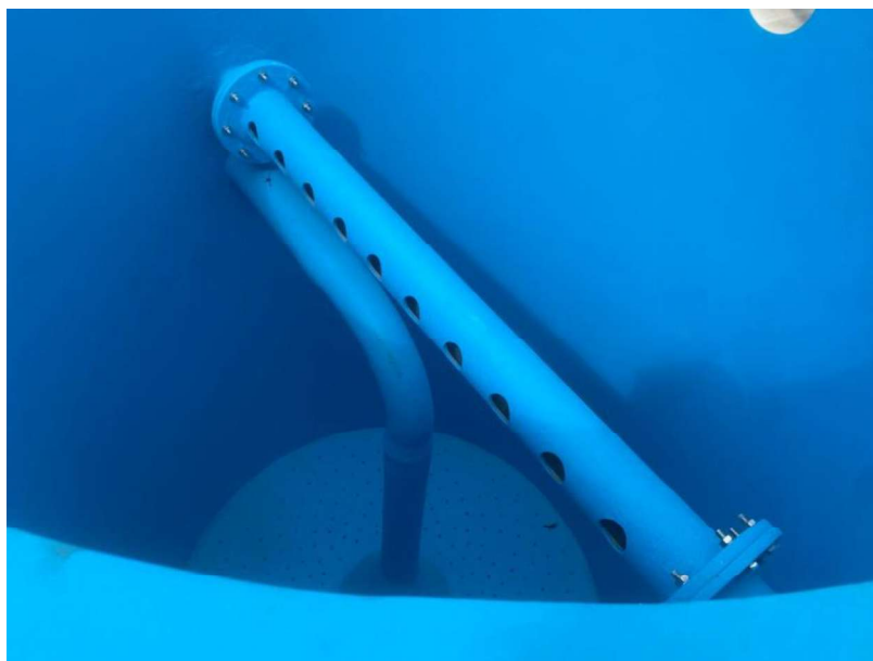
Figura 17 e 18: ITEM 10.03.01 – FILTRO TIPO ARVORE