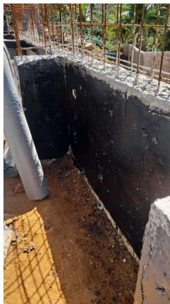
Figura 27 e 28: ITEM 16.07 – PINTURA IMPERMEABILIZANTE