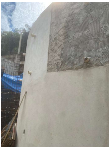
Figura 29 e 30: ITEM 16.12 – REBOCO TIPO PAULISTA