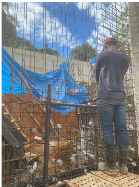
Figura 21 e 22: ITEM 16.01 –CORTE E DOBRA DE AÇO DE 12,5 A 25,0MM