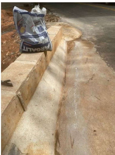
Figura 7 e 8: ITEM 05.04.02 – GUIA DE CONCRETO