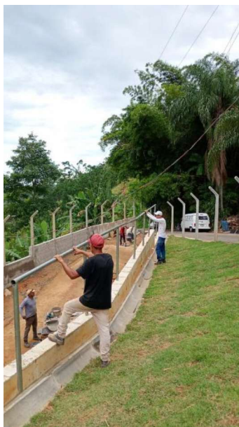
Figura 9 e 10: ITEM 05.05.04 – GUARDA CORPO