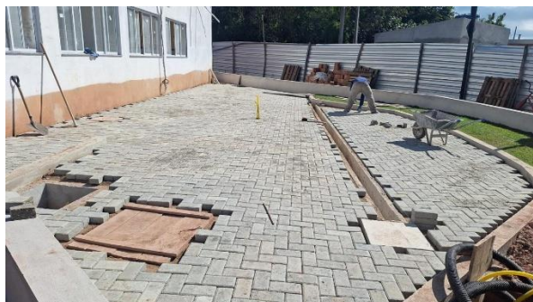
Figura 4: EXECUÇÃO DE PÁTIO/ESTACIONAMENTO EM PISO INTERTRAVADO, COM BLOCO RETANGULAR COR NATURAL DE 20 X 10 CM, ESPESSURA 8 CM. AF_12/2015