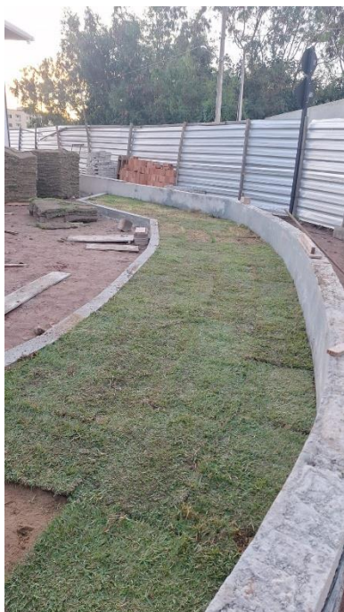
Figura 5: Mureta em alvenaria de blocos cerâmicos 10x20x20cm, h=0.60m, para fechamento de quadra, com pilaretes de travamento em concreto armado a cada 3m, inclusive chapisco