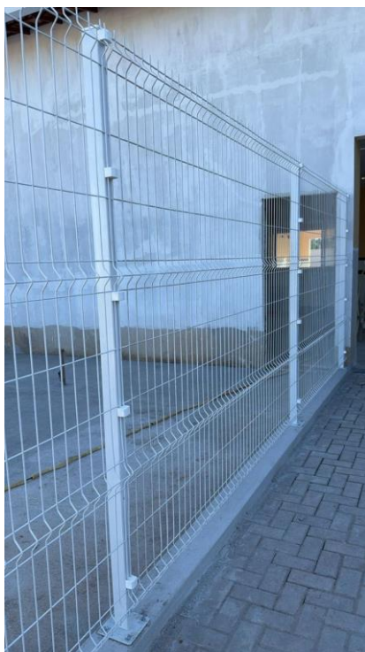
Figura 6: FOR Gradil H = 1.90m padrão SEDU em tudo de FG 2" e barra chata de 1 1/2"x1/4", para fixação sobre mureta conforme projeto, exclusive a mureta.

Rua F, s/nº, Quadra 18, Bairro Portal de Anchieta, Anchieta – ES CEP. 29230-000 Tel.: (28) 3536-1755; 3536-2787; 3536-3675.