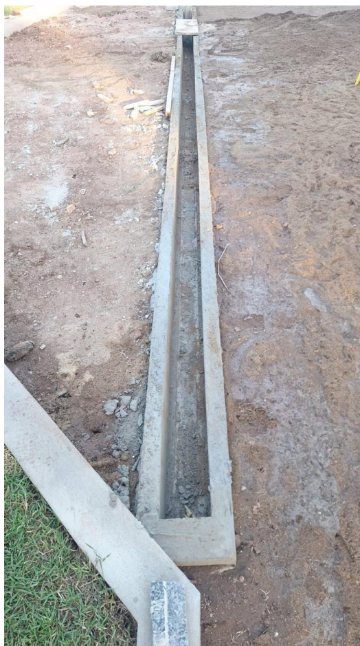
Figura 4: CANALETA NO PISO EM CONCRETO SIMPLES COM DIMENSÕES INTERNAS DE 20 X 10 CM E GRELHA EM FERRO DIAM. 1/2" A CADA 3 CM FIXADOS EM CANTONEIRA DE 3/4" X 1/8" APOIADA SOBRE REQUADRO EM CANTONEIRA DE 1" X 3/16"