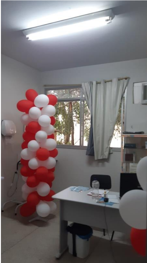
Fonte: fotos registradas no dia 17.08.2022. Sala de Atendimento Médico da Unidade de Saúde – ESF São Pedro.