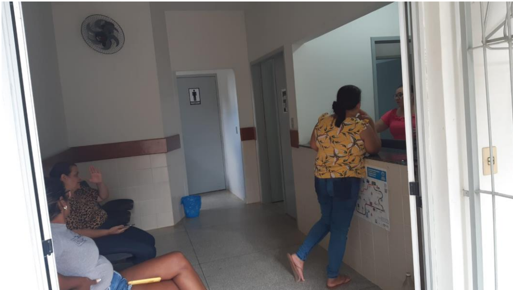
Fonte: fotos registradas no dia 17.08.2022. Recepção da Unidade de Saúde – ESF São Pedro.