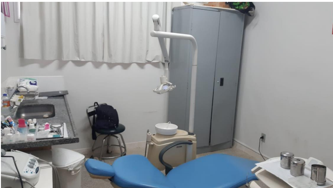
Fonte: fotos registradas no dia 17.08.2022. Sala Odontológica da Unidade de Saúde – ESF São Pedro.