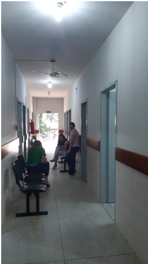
Fonte: fotos registradas no dia 17.08.2022. Recepção da Unidade de Saúde – ESF São Pedro.