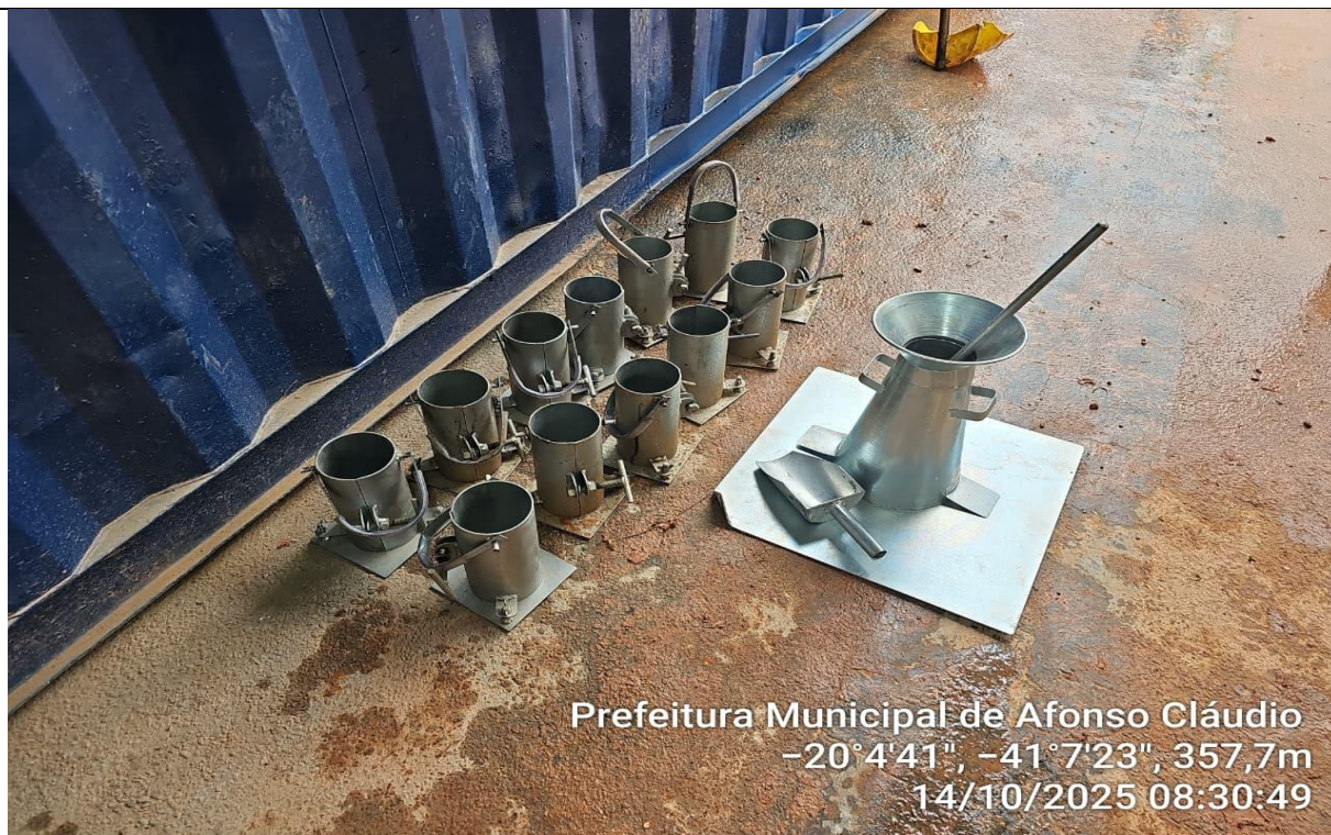
Prefeitura Municipal de Afonso Cláudio -20°4'41", -41°7'23", 357,7m 14/10/2025 08:30:49