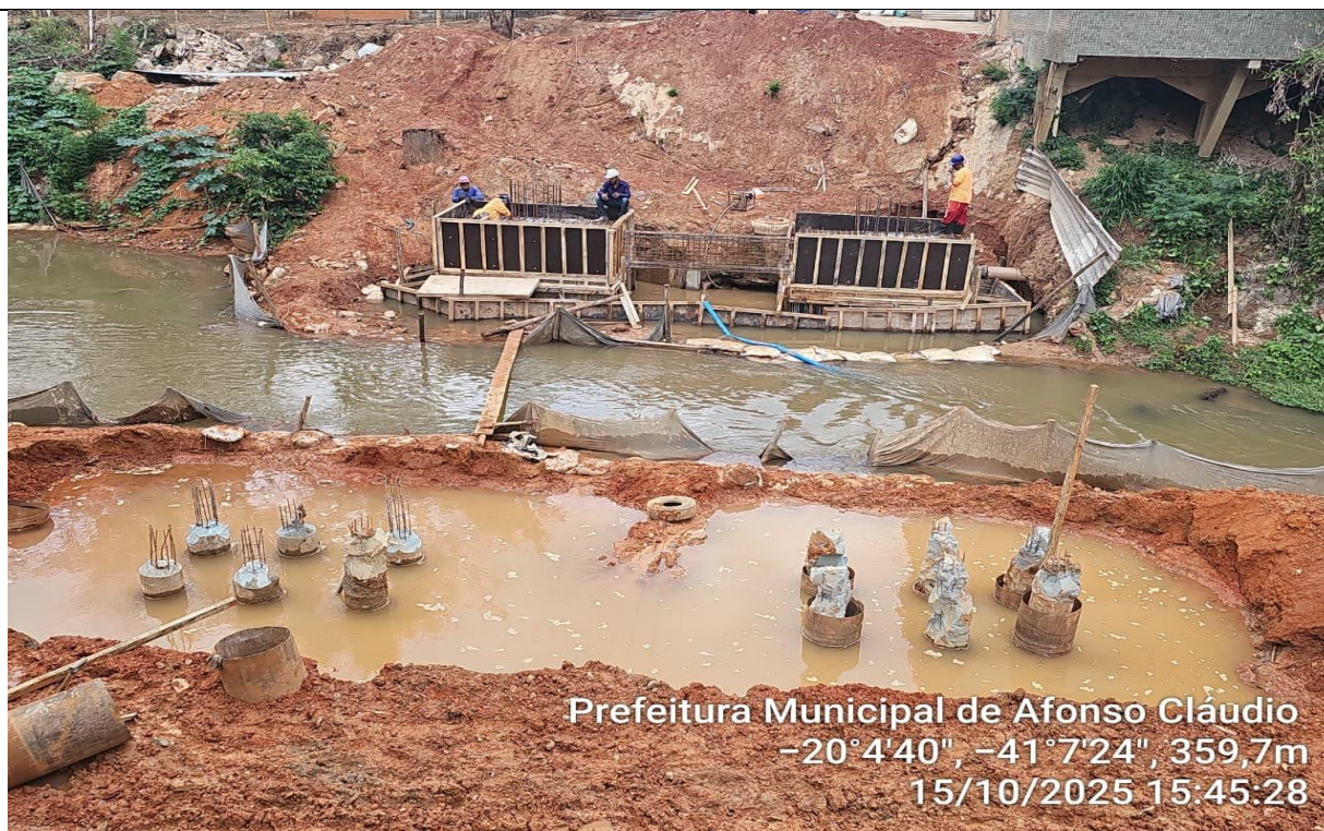
Prefeitura Municipal de Afonso Cláudio -20°4'40", -41°7'24", 359,7m 15/10/2025 15:45:28