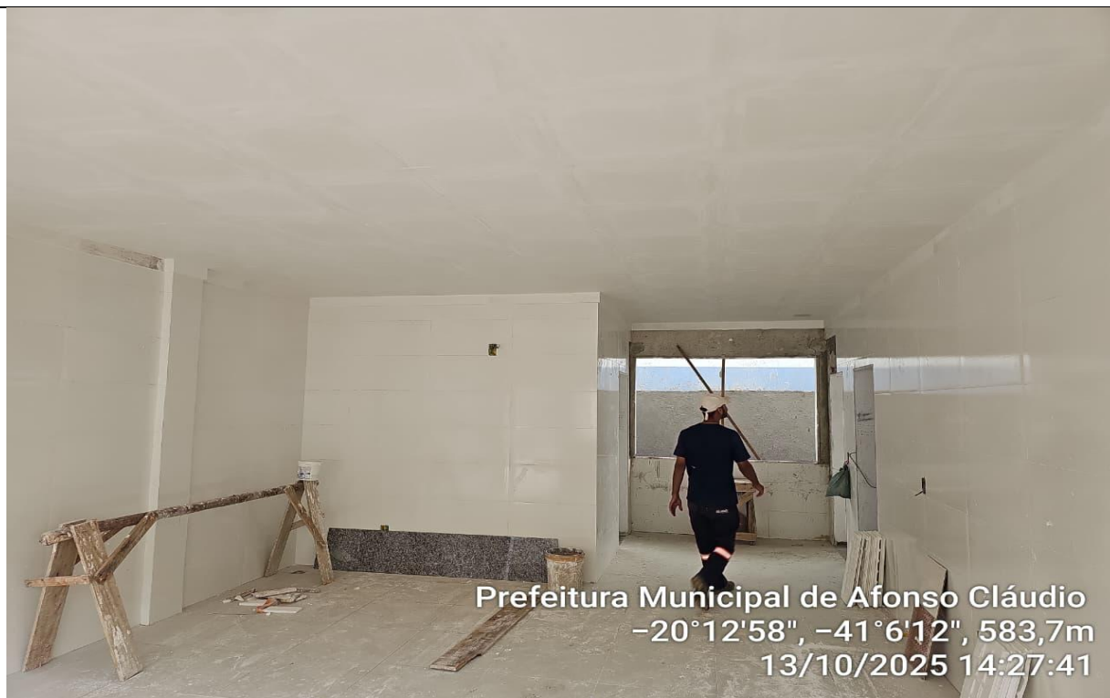
Prefeitura Municipal de Afonso Cláudio -20°12'58", -41°6'12", 583,7m 13/10/2025 14:27:41