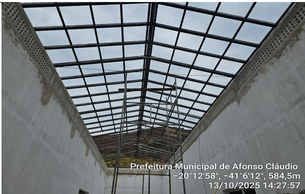
Prefeitura Municipal de Afonso Cláudio -20°12'58", -41°6'12", 584,5m 13/10/2025 14:27:57