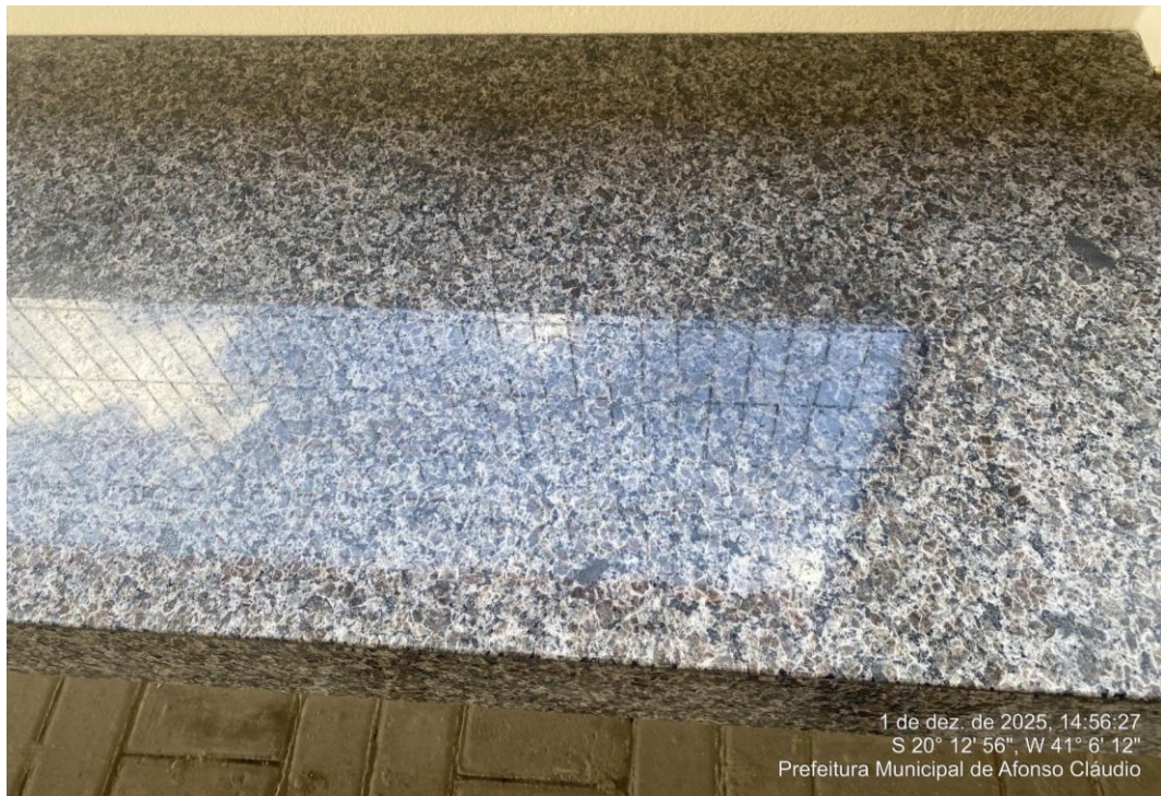
Figura 38 - Banco de Granito