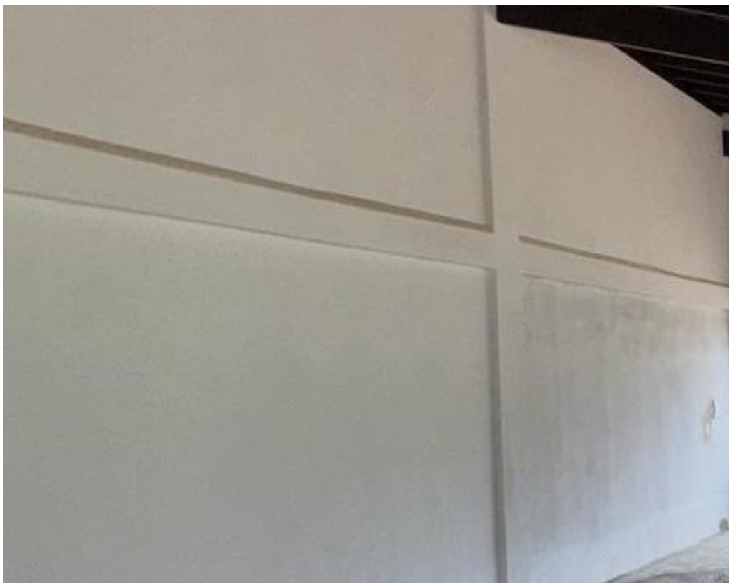
Figura 8 - Execução de Pintura