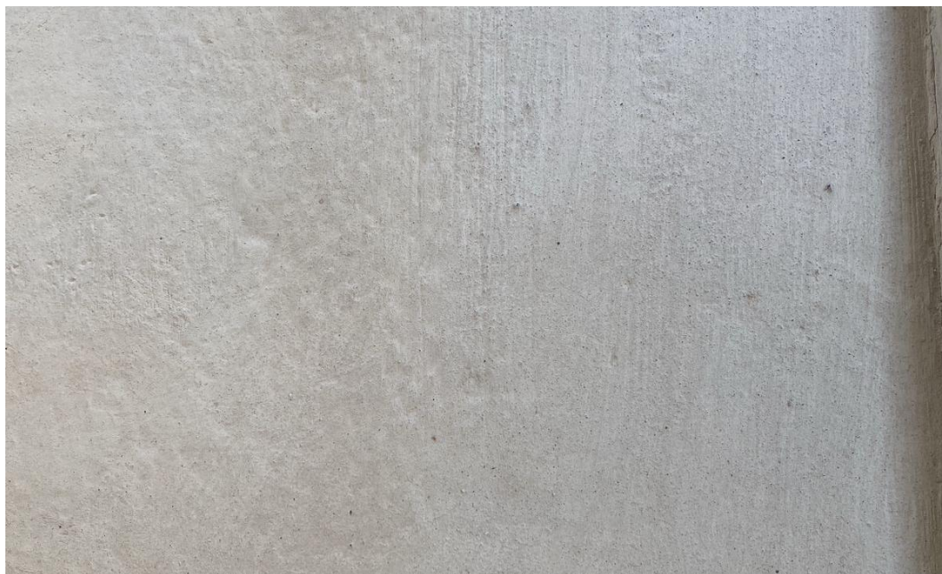
Figura 22 - Execução Passeio Cimentado