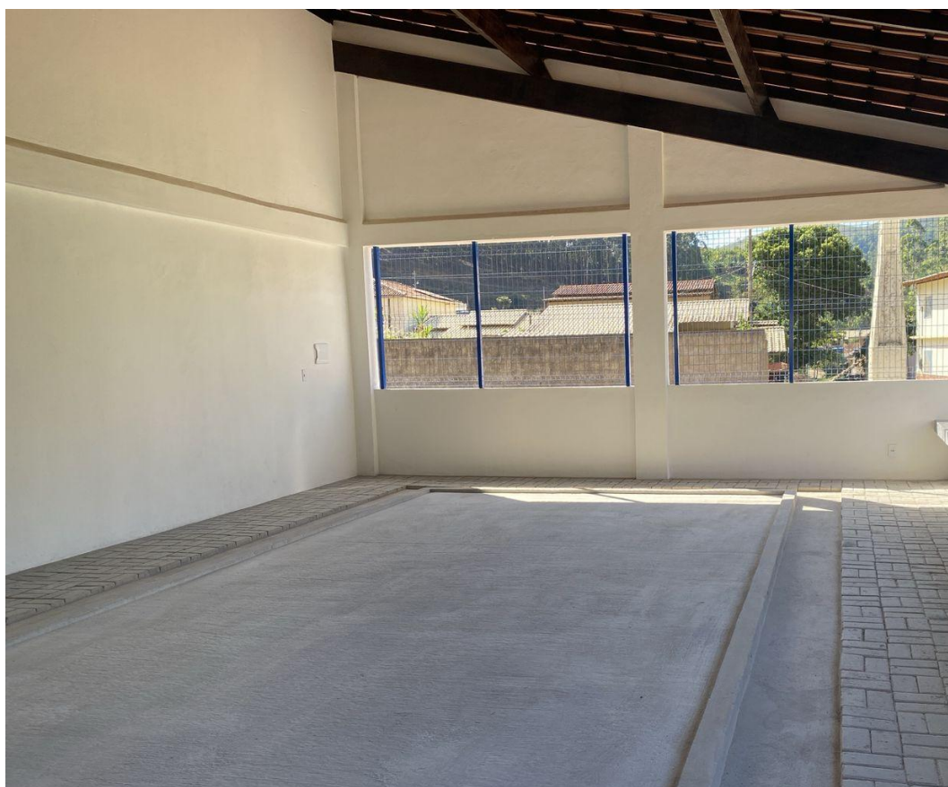
Figura 23 - Execução de Passeio Cimentado