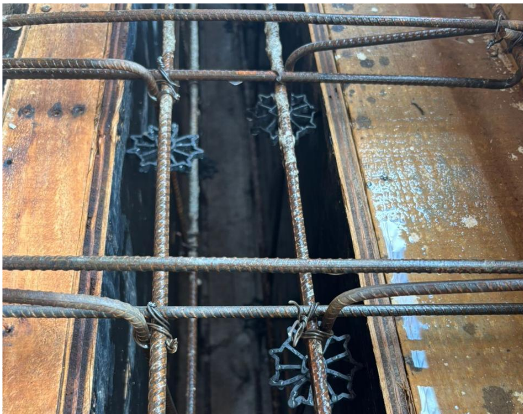
Figura 28 - Forma em Chapa de Madeira e Armadura