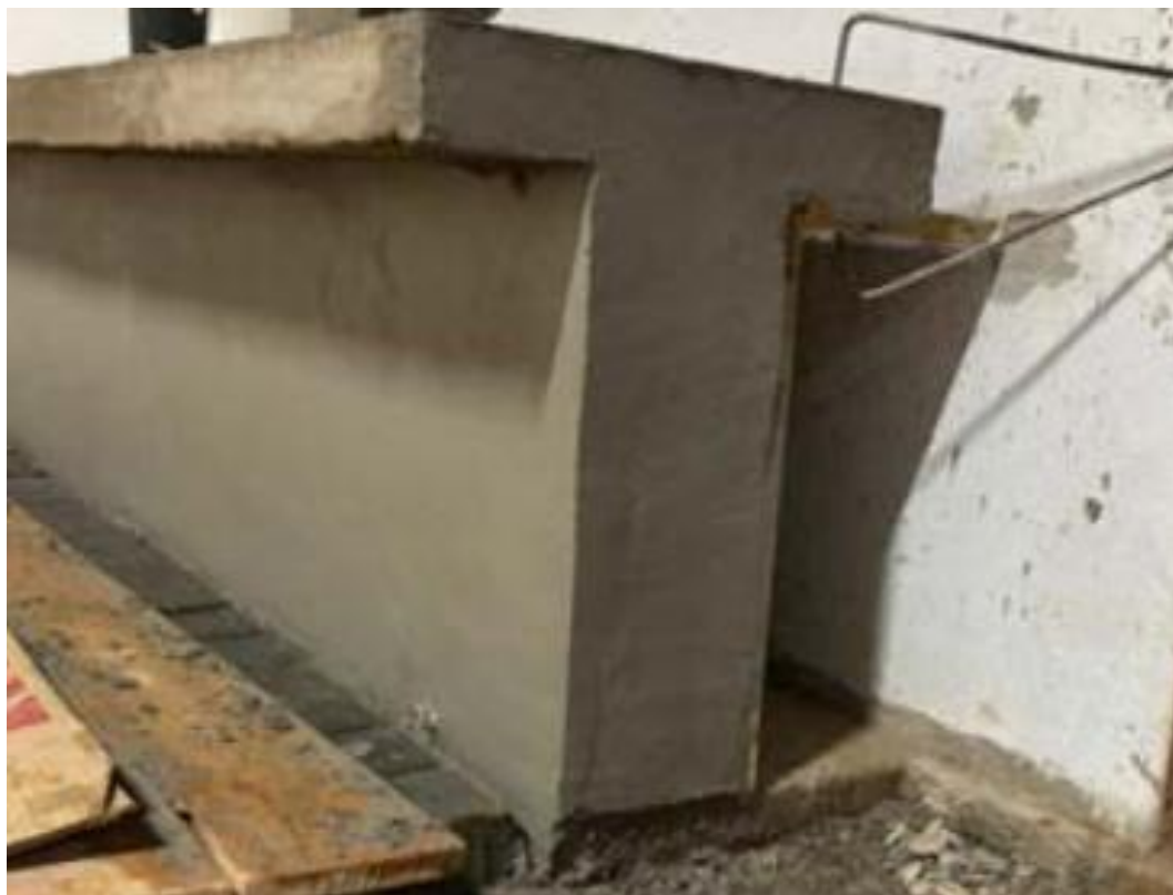
Figura 32 - Concreto Fck 25Mpa