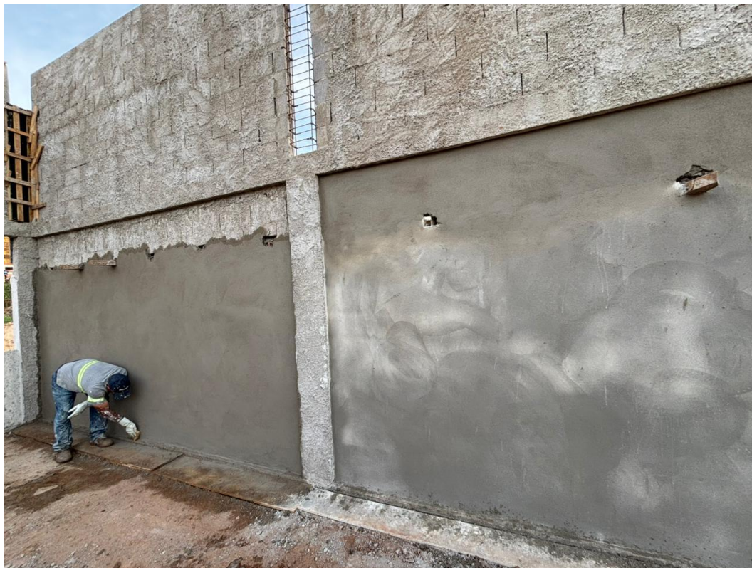
Figura 1 - Execução da Camada de Reboco