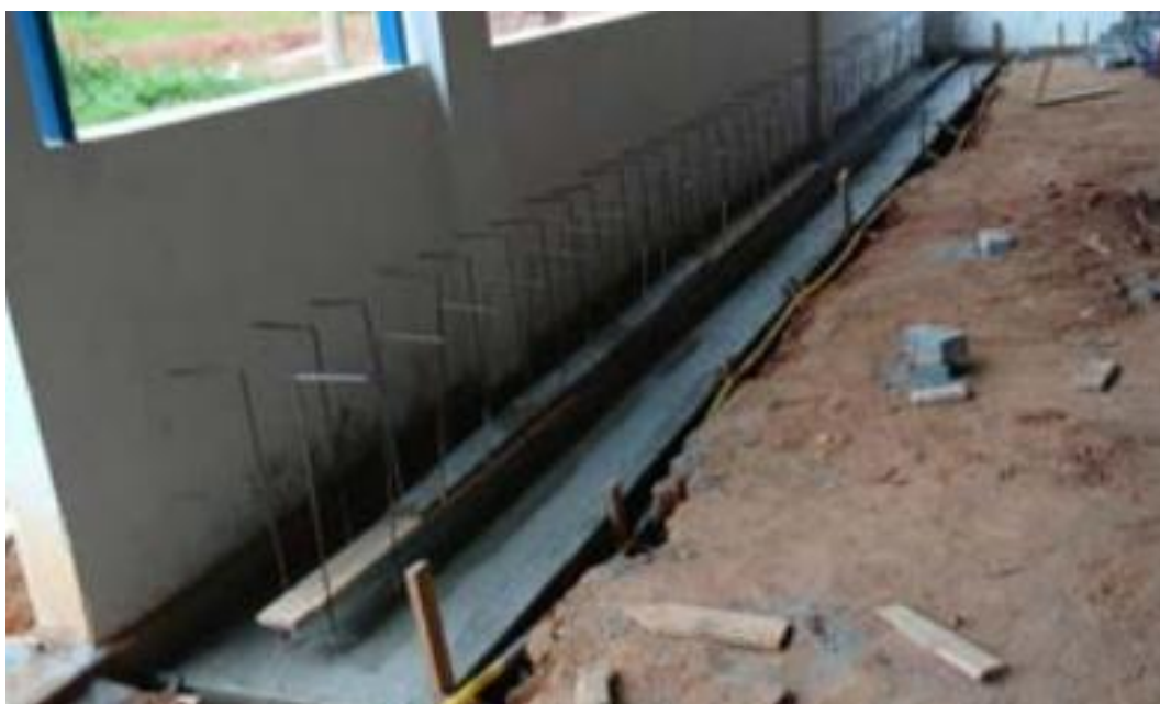
Figura 31- Concreto Fck 25Mpa