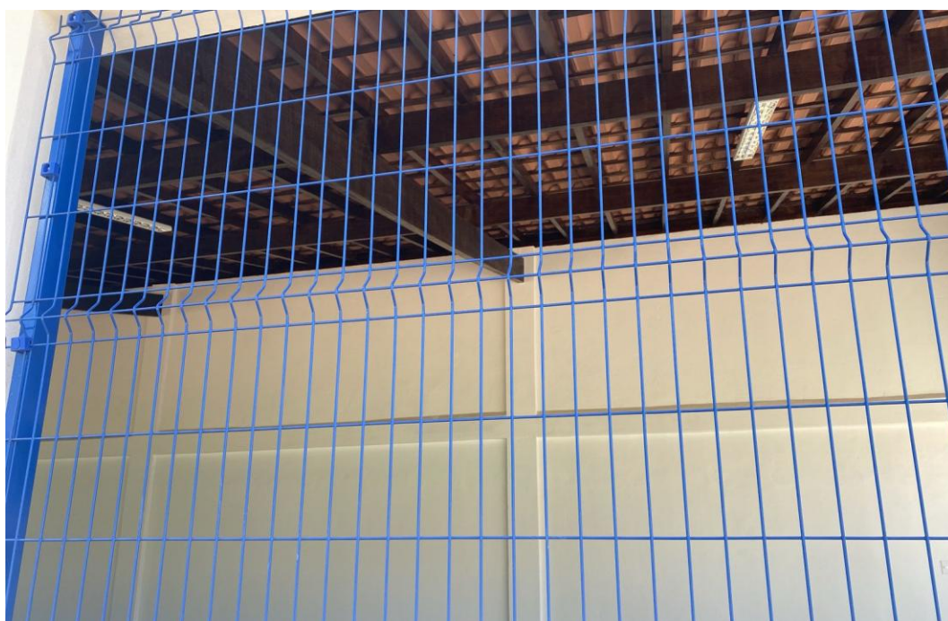
Figura 33 - Alambrado