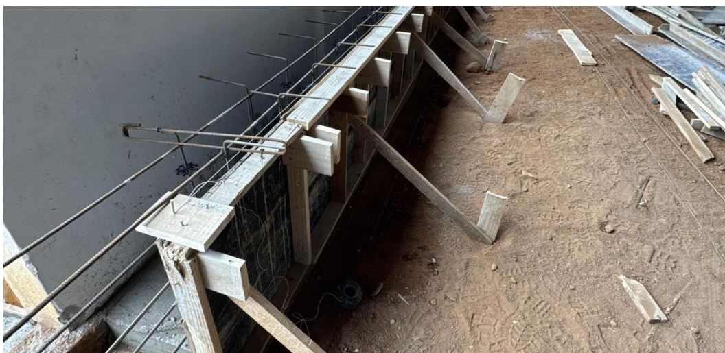
Figura 29 - Forma em Chapa de Madeira e Armadura