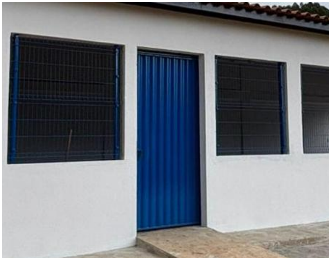
Figura 14 - Portão de Ferro