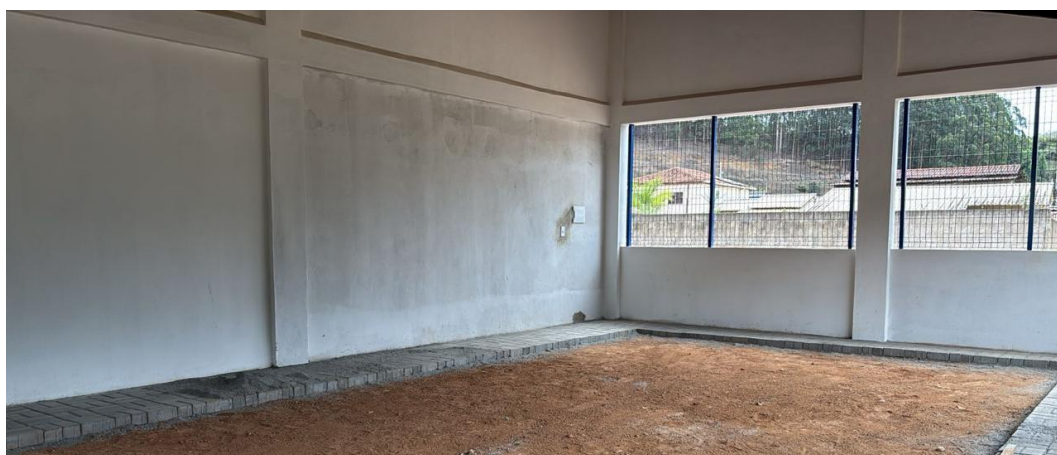
Figura 9 - Execução de Pintura