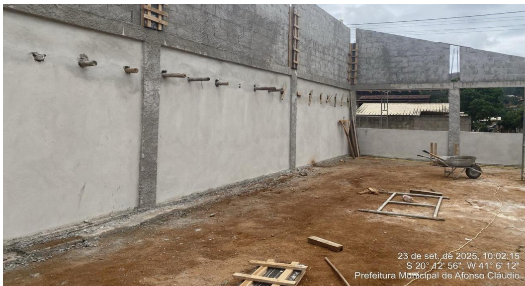
Figura 6 - Execução de Camada de Reboco