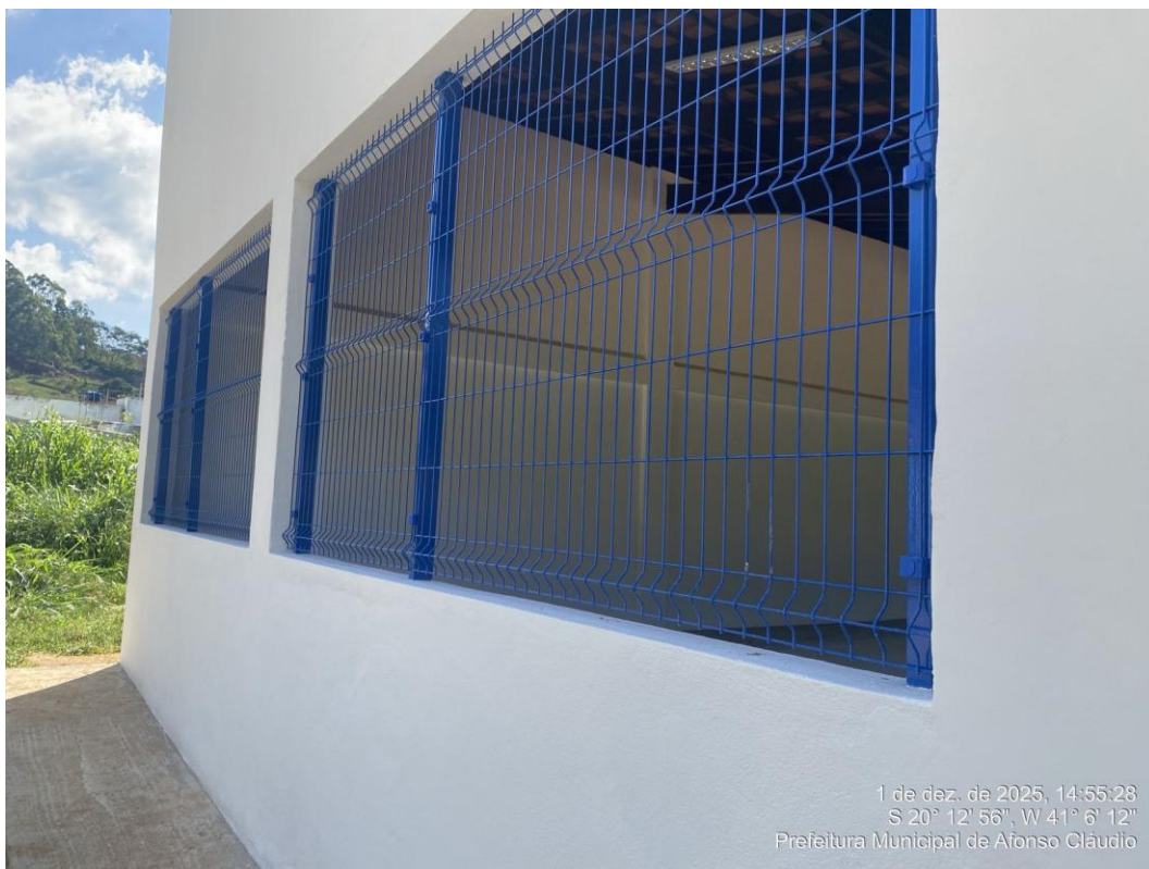
Figura 35 - Alamedado