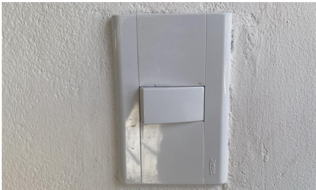
Figura 24 - Ponto de Interruptor