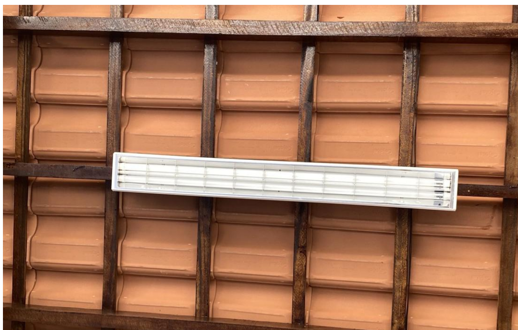
Figura 25 - Ponto de Luz e Luminária