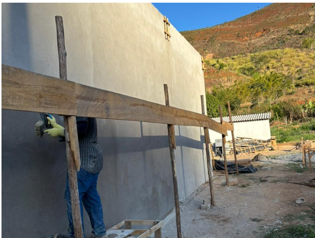
Figura 7 - Execução de Camada de Reboco