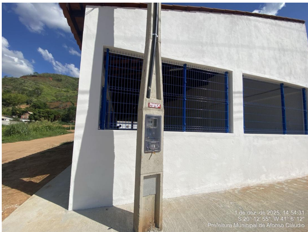
Figura 36 - Alamedado