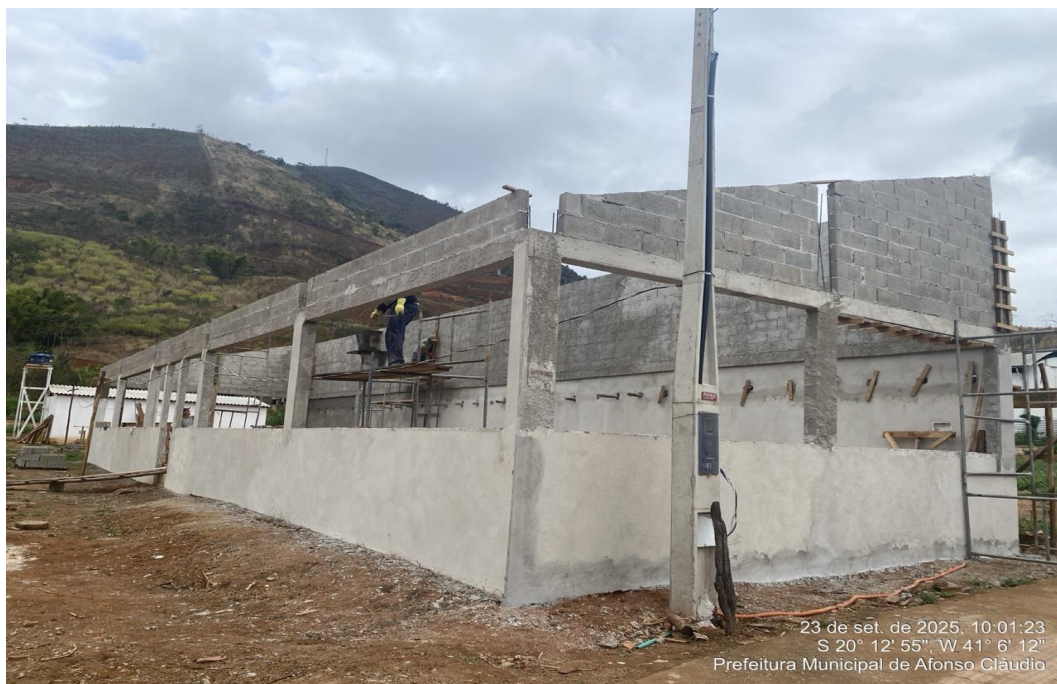
Figura 2 - Execução da Camada de Reboco