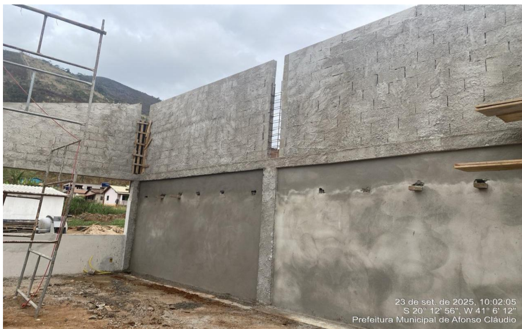
Figura 3 - Execução da Camada de Reboco