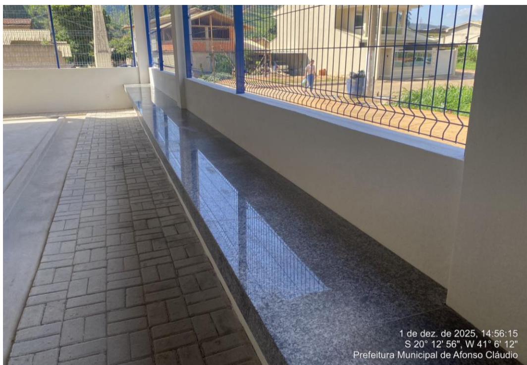
Figura 39 - Banco de Granito