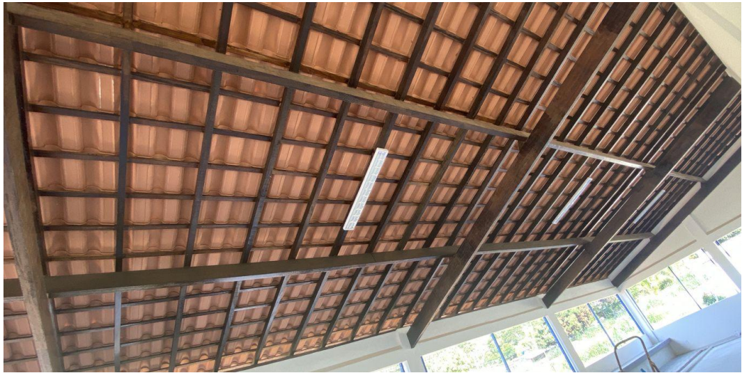
Figura 26 - Ponto de Luz e Luminária