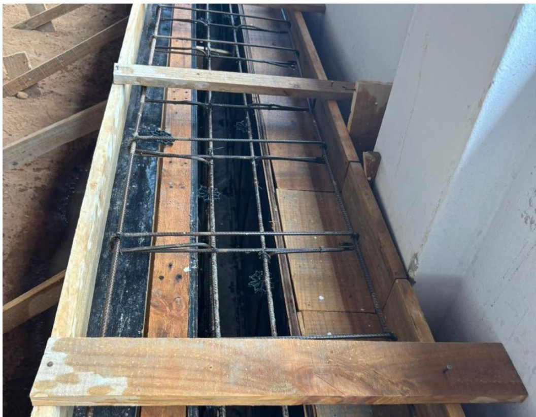
Figura 30 - Forma em Chapa de Madeira e Armadura