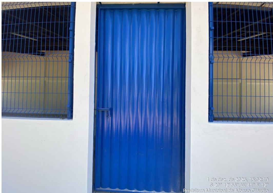
Figura 13- Portão de Ferro