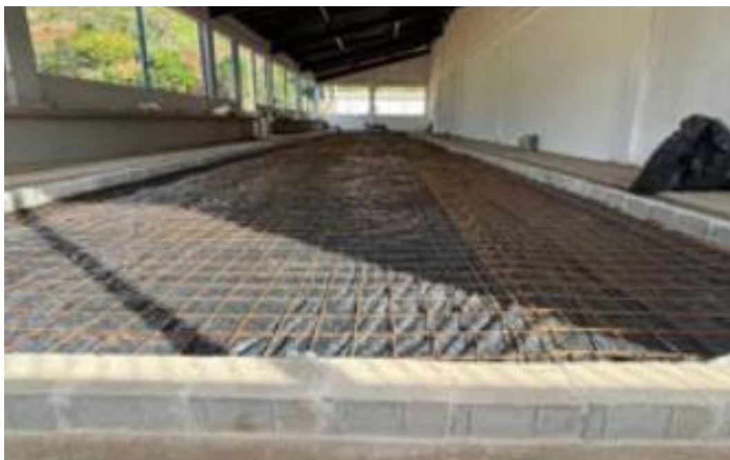
Figura 19 - Armação para Piso e Lona