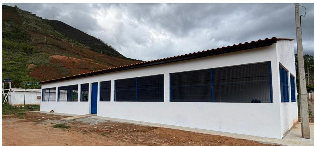
Figura 37 - Alamedado