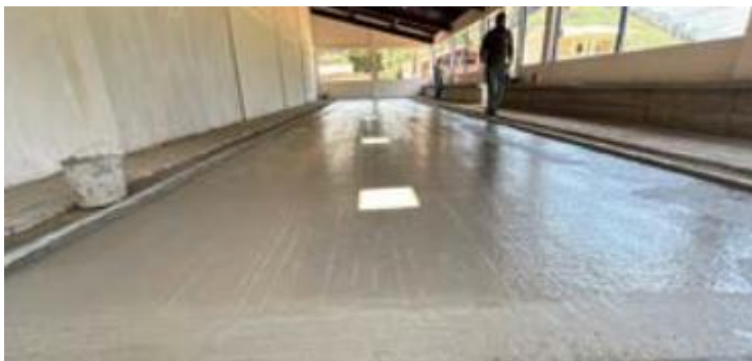
Figura 21 - Execução Passeio Cimentado