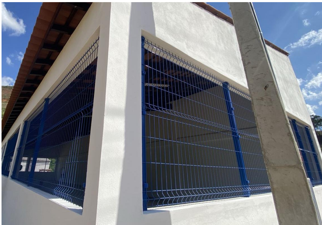
Figura 34 - Alamedado