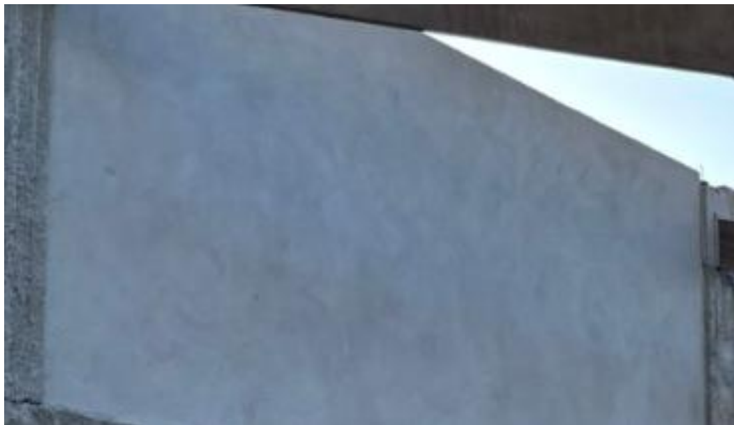
Figura 4 - Execução de Camada de Reboco