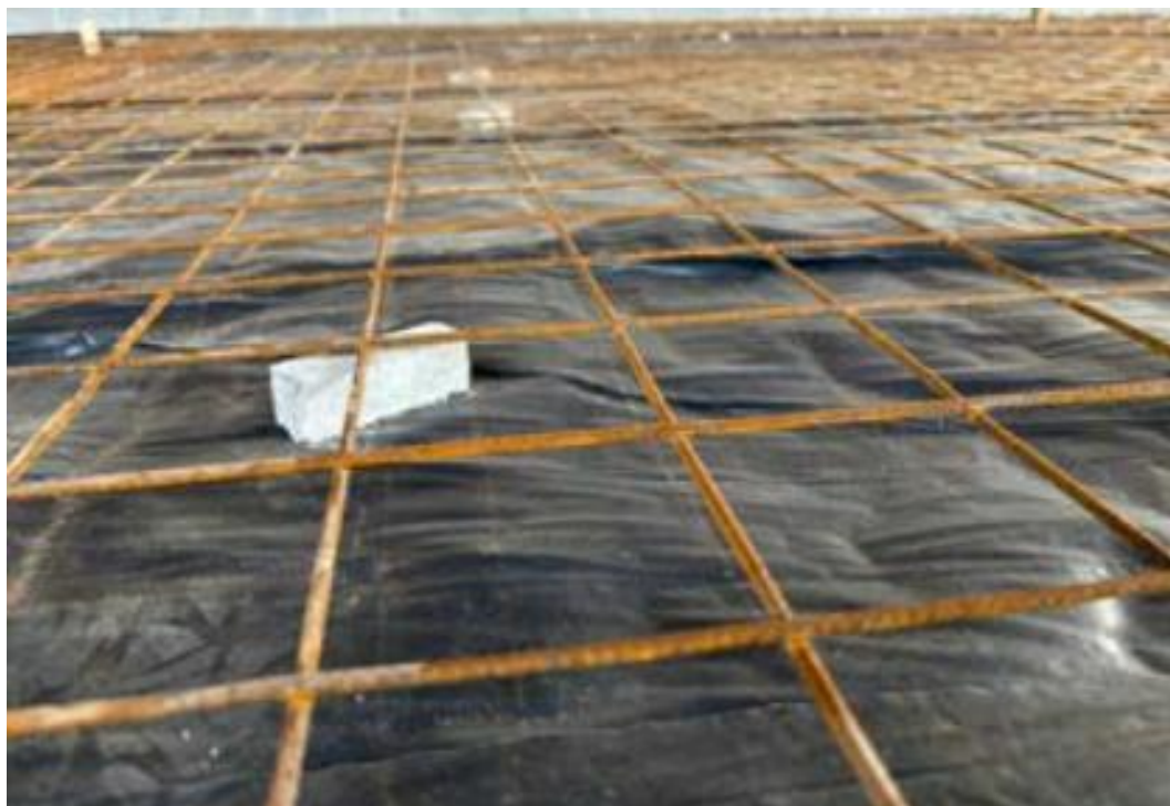
Figura 20 - Armação para Piso e Lona