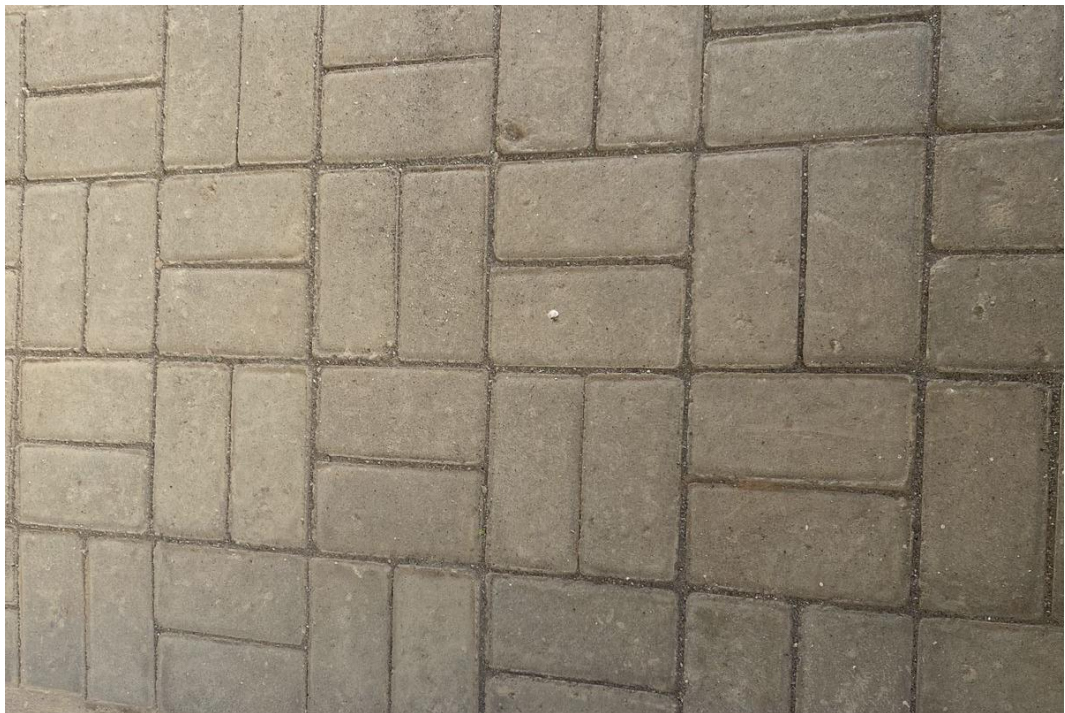
Figura 17 - Execução Blocos Pavi-S