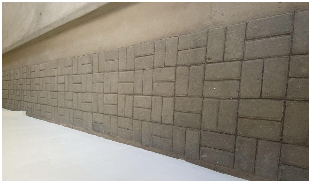
Figura 18 - Execução Blocos Pav-S