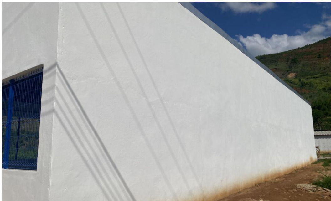
Figura 10 - Execução de Pintura