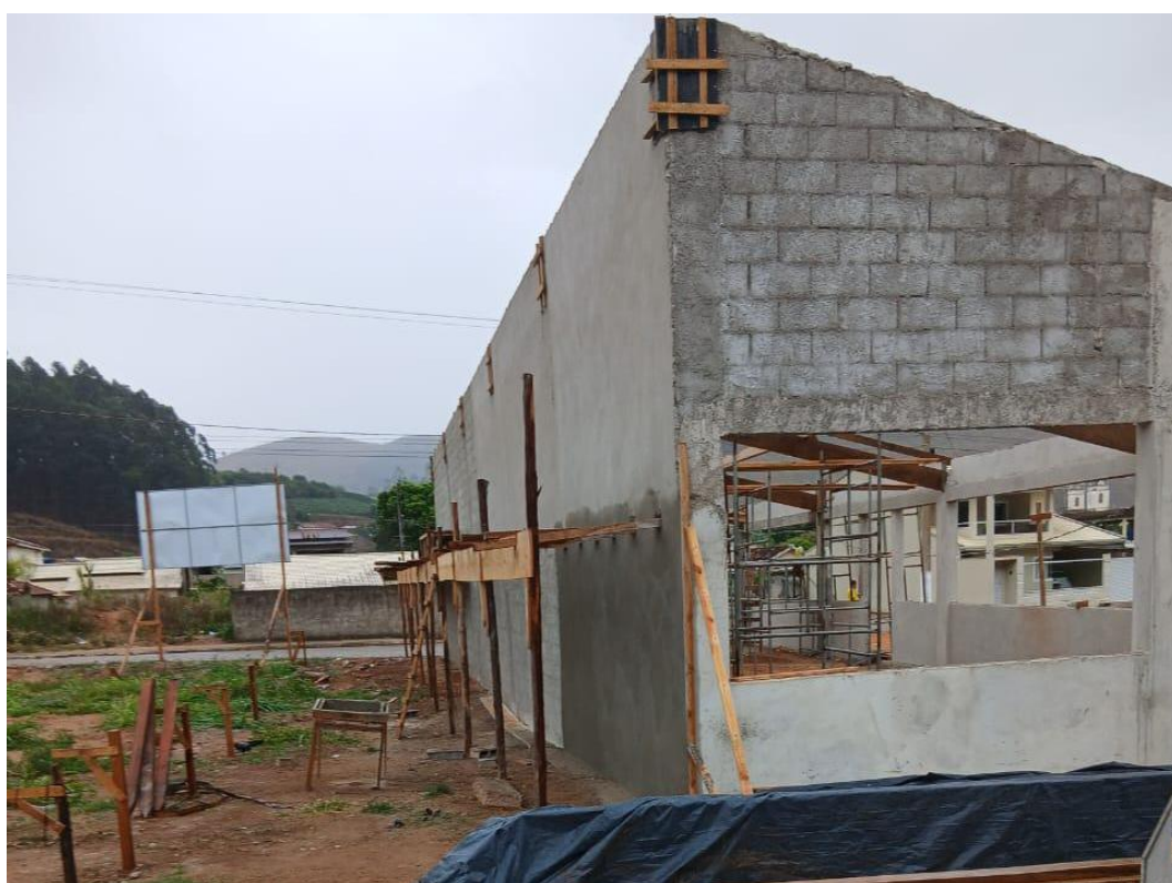
Figura 5 - Execução de Camada de Reboco