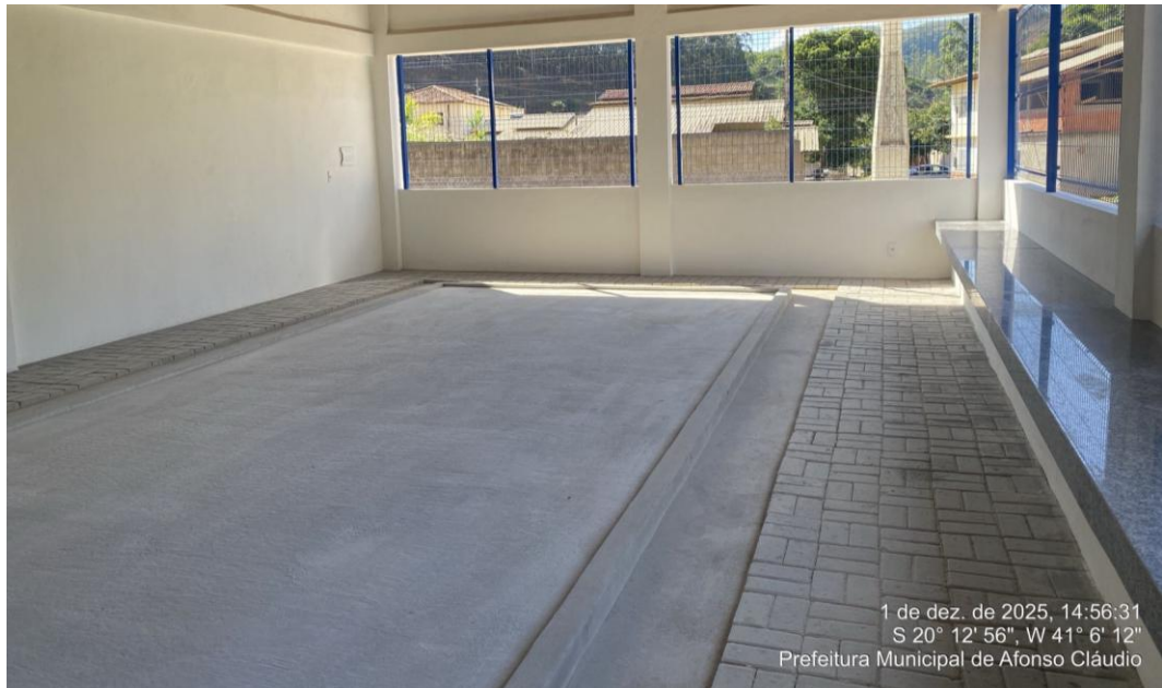
Figura 12 - Execução de Pintura