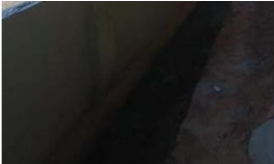
Figura 27 - Concreto Magro