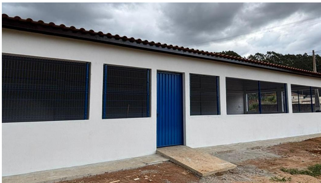
Figura 15 - Portão de Ferro