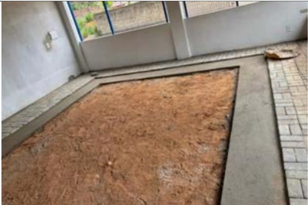
Figura 16 - Execução Blocos Pav-S