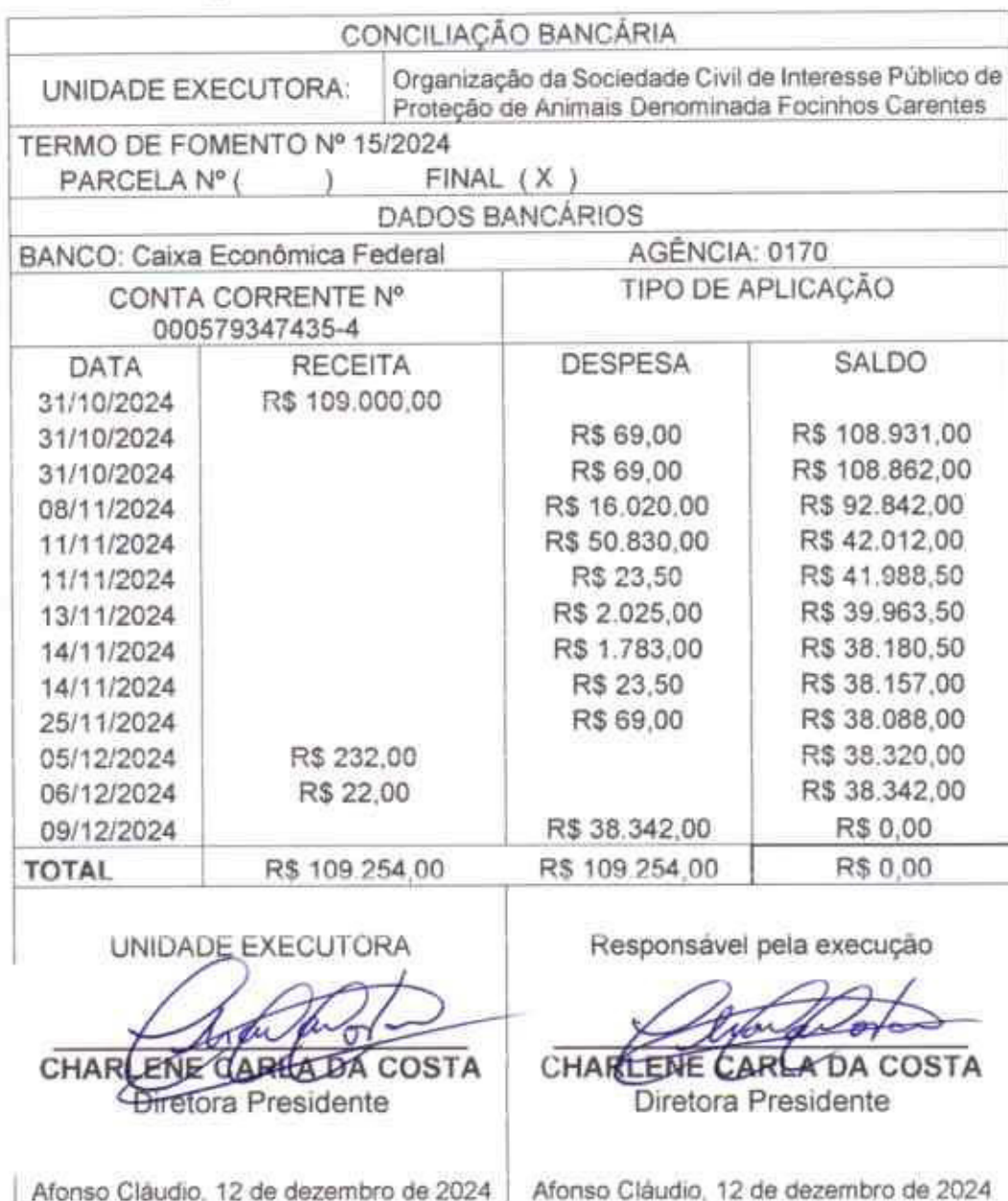
Tabela 03. Conciliação bancária.

Email: projetofofocinhoscarentes.afc@hotmail.com