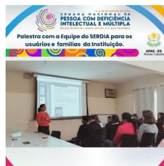
Atendimento Gerente Geral