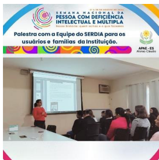
Ação/Gerente Geral da instituição

Fonoaudiólogo, Auxiliar de Desenvolvimento Infantil e Cuidador, além de uma infraestrutura voltada para a realização do atendimento a este público possuindo salas individuais equipadas com recursos destinadas a cada profissional.