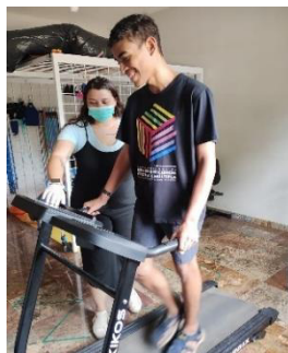
Atendimento de Fisioterapia