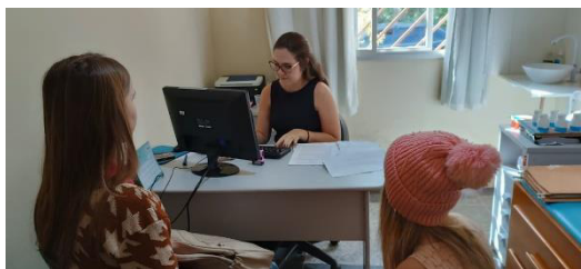
Atendimento com médica Clínica Geral