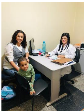
Atendimento com Neurologista