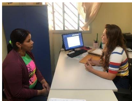
Atendimento Serviço Social