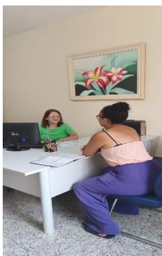
Atendimento de Psicologia