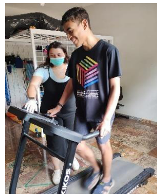
Atendimento de Fisioterapia