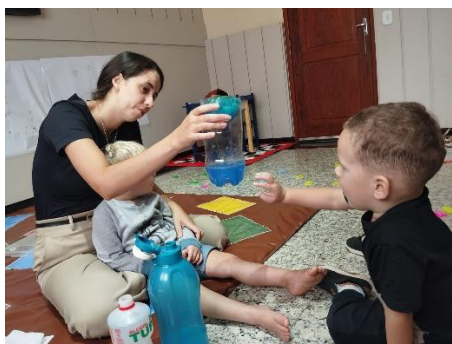
Atendimento de Estimulação Precoce