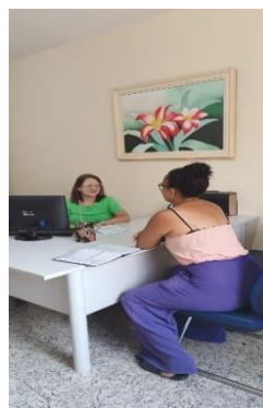
Atendimento de Psicologia