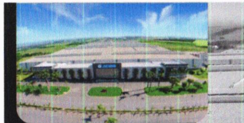
Fábrica XCMG Brasil Indústria, em Pouso Alegre, Minas Gerais.

Ocupando uma área de 1 milhão de m², dos quais 150 mil são de construção de galpões. São quatro galpões principais de produção e mais de 10 instalações auxiliares, gerando todas as condições necessárias para a preparação de peças, solda, usinagem, montagem e pintura.