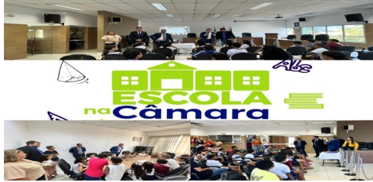
Visita realizada pela EMEF Praia Grande, no dia 28/06/2023.