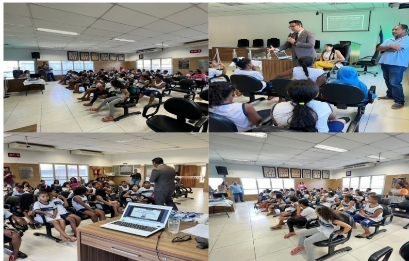
Visita realizada pela EMEF Praia Grande, no dia 05/07/2023.