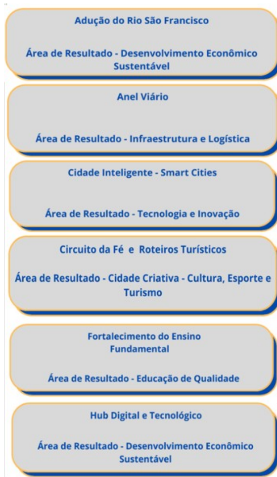
Figura 2: Projetos estruturantes por área de resultado

A figura abaixo apresenta os projetos estruturantes por área de resultado: