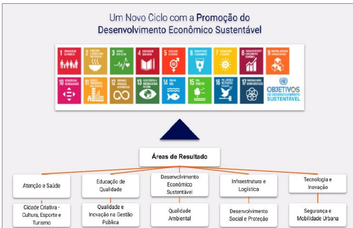
Figura 1: Áreas de resultado.

A partir das diretrizes da atual gestão municipal foram definidos 10 (dez) Áreas de Resultados que explicitam os objetivos estratégicos das várias áreas de atuação da Prefeitura e onde estão agrupados os programas e ações.