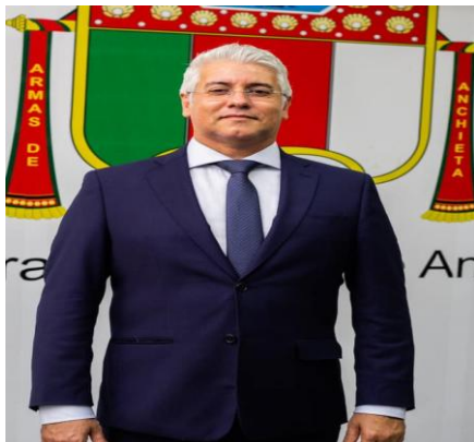
EDINHO ED +

Sem biografia informada pela Assessoria.