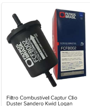
Filtro Combustível Captur Clio Duster Sandero Kwid Logan