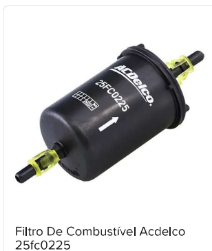
Filtro De Combustível Acdelco 25fc0225