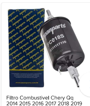
Filtro Combustível Chery Qq 2014 2015 2016 2017 2018 2019