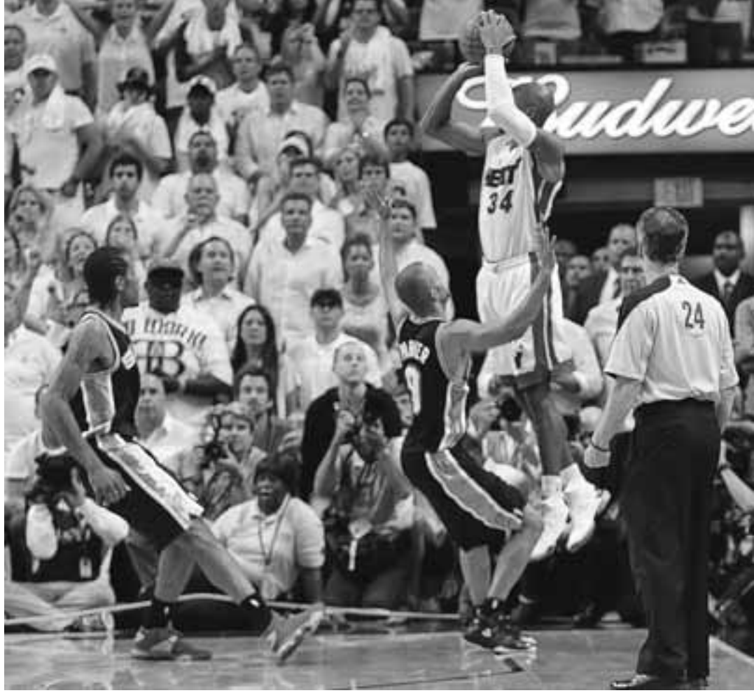
Είναι η στιγμή που η ανάσα των οπαδών των Χιτ κόβεται καθώς ο Ρέι Αλεν σιτάρει υπό πίεση στην τελευταία επίθεση της κανονικής διάρκειας του ματς. Ο έμπειρος γκαρντ σκόραρε το πρώτο του τρίποντο στο ματς και έστειλε το παιχνίδι στην παράταση.