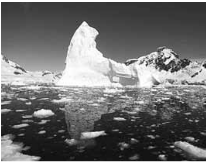
Κατά τέσσερις βαθμούς Κελσίου θα αυξηθεί η θερμοκρασία μέχρι το 2100 αναφέρει σε έκθεσή της η Παγκόσμια Τράπεζα.

Η έκθεση συμπληρώνει μελέτη της Παγκόσμιας Τράπεζας, που δόθηκε στη δημοσιότητα τον Νοέμβριο, η οποία δείχνει τον αντίκτυπο που θα έχει πα-