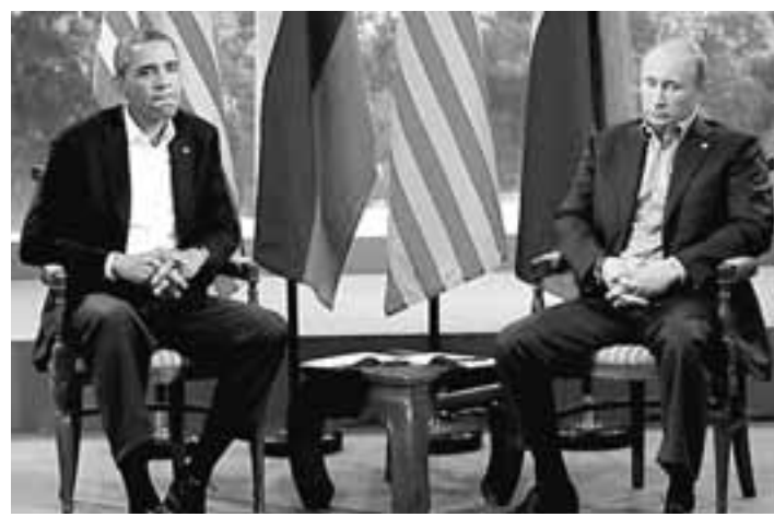
NEW YORK TIMES

«Στην Ευρώπη, ιδιαίτερα, ο Ομπάμα έγινε δεκτός με ανοιχτές αγκάλες, και μερικοί άνθρωποι είχαν μη ρεαλιστικές προσδοκίες γι' αυτόν», δήλωσε ο Νίκολας Μπερνς, επί χρόνια υψηλόβαθμος διπλωμάτης των Ηνωμένων Πο-