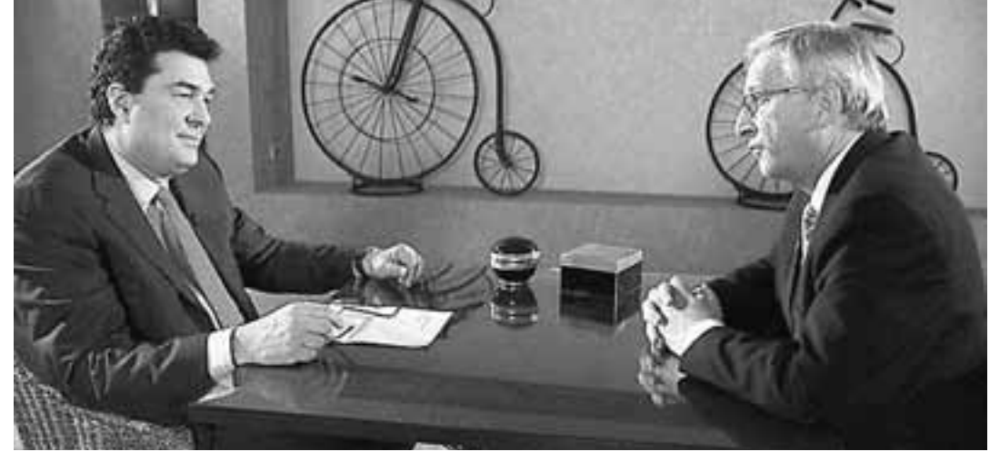
Ο δημοσιογράφος Αλέξης Παπαχελάς (αριστερά) και ο Ζαν Κλοντ Γιούνκερ.

«Πιστεύω ότι το πλουσιότερο κομμάτι της ελληνικής κοινωνίας δεν είχε την ίδια συνεισφορά σε σχέση με τον πιο αδύναμο μέρος των Ελλήνων. Είναι οι ταπεινοί, οι πιο φτωχοί Έλληνες, που υπέφεραν περισσότερο. Αυτοί που έχουν χρήματα δεν υπέφεραν το ίδιο με αυτούς που δεν έχουν. Αυτές ήταν και είναι οι αμφιβολίες μου. Και το ΔΝΤ δεν