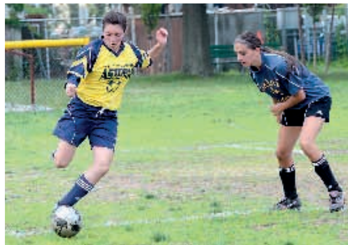
ΕΘΝΙΚΟΣ ΚΗΡΥΞ/ΝΤΙΝΟΣ ΑΥΛΟΝΙΤΗΣ