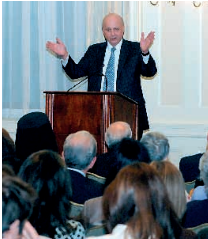
Ο ομογενής πρώην αναπληρωτής υπουργός Εξωτερικών των ΗΠΑ, Τζον Νεγκροπόντε ενώ μιλά στους ομογενείς.

Οι παριστάμενοι στο διάσημο University Club στο Μανχάταν ήταν πρόθυμοι να ακούσουν την άποψή του για το πρόγραμμα παρακολούθησης που αποκαλύφθηκε πρόσφατα ή την άποψή του σχετικά με την ισορροπία σε μια Δημοκρατία ανάμεσα στην ασφάλεια και στις ελευθερίες των πολιτών. Ωστόσο, κανένας από τους παρισταμένους δεν έθεσε τα θέματα αυτά στις ερωτήσεις που ακολούθησαν.