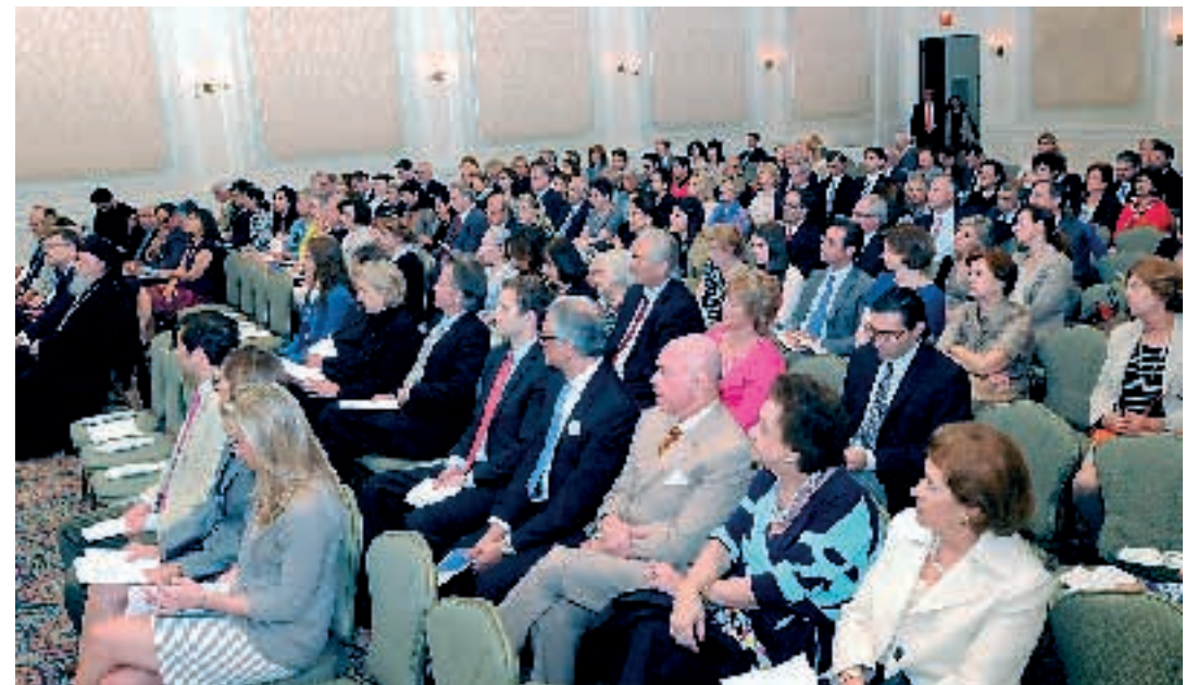
Στο στιγμιότυπο από την εκδήλωση του Ελληνοαμερικανικού Πολιτιστικού Ιδρύματος διακρίνονται οι ομογενείς οι οποίοι παρακολουθούν την ομιλία του Τζον Νεγκροπόντε.

Ο Αρχιεπίσκοπος Δημήτριος σημείωσε ότι τα θέματα των βιογραφιών και αυτοβιογραφιών συχνά σκοντάφτουν σε ναρκισσισμό ή αλαζονεία, αλλά αυτό δεν αφορά την περίπτωση του Νεγκροπόντε. Ήταν, επομένως, απαραίτητο για τον Αρχιεπίσκοπο να ενημερώσει το κοινό σχε-