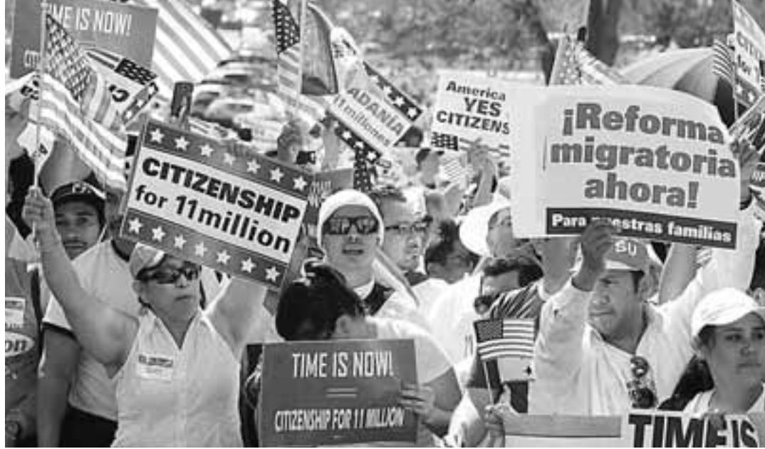
Σε περίπου 11 εκατομμύρια υπολογίζονται αυτά τη στιγμή οι παράνομοι μετανάστες στις ΗΠΑ.

Η Γερουσία ψήφισε με ευρεία πλειοψηφία την άρση ενός διαδικαστικού εμποδίου κατά του νομοσχεδίου. Ακόμη και ορισμένοι γερουσιαστές που είχαν εκφράσει την αντίθεσή τους στο νομοσχέδιο αυτό, όπως είναι στη σημερινή του μορφή, ψήφισαν υπέρ του να επιτραπεί η συζήτηση της συζήτησής του.