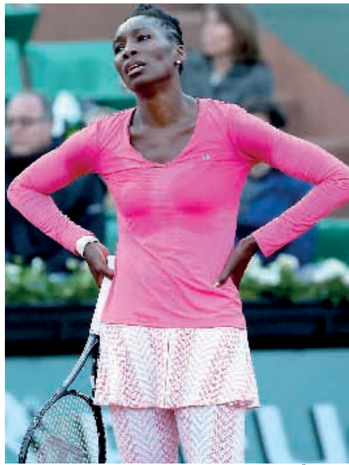
ΜΙΣΕΛ ΟΛΕ/ΑΣΟΣΙΕΤΕΝΤ ΠΡΕΣ

Βέβαια όσο ο Βερδού δεν απαντήσει επίσημα στον Ολυμπιακό όλα θα «παίζουν». Πάντως οι «ερυθρόλευκοι» δεν θέλουν σε καμία περίπτωση το θέμα της μεταγραφής του πρώην μέσου της Εσπανιόλ να εξελιχθεί σε σφάλμα και γι' αυτό σύμφωνα με πληροφορίες θα του θέσουν ως τελική προθεσμία προκειμένου να γνωστοποιήσει τις προθέσεις του την ερχόμενη Παρασκευή.