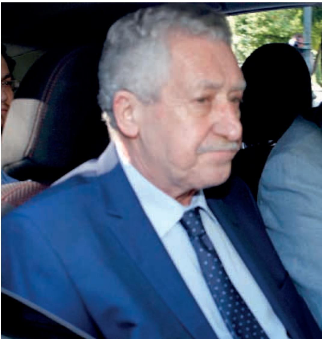
Ο πρόεδρος της ΔΗΜΑΡ, Φώτης Κουβέλης, που διακρίνεται κατά την προσέλευσή του στο Μέγαρο Μαξίμου, ζητούσε μέχρι τελευταία στιγμή την άμεση επαναλειτουργία της ΕΡΤ.