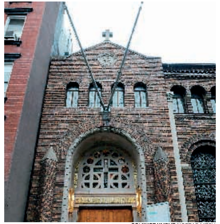
Κατέβασαν και την αμερικανική σημαία από τον Αρχιεπισκοπικό Καθεδρικό Ναό Νέας Υόρκης όπως μαρτυρεί η φωτογραφία.

Ο Καθεδρικός Ναός ιδρύθηκε από πρωτοπόρους Έλληνες μετανάστες. Πεντακόσιοι άνδρες και 20 γυναίκες υπήρχαν το 1891 στη Νέα Υόρκη, οι οποίοι αρχικά ίδρυσαν την Αδελφότητα «Αθήνα» αφιερωμένη στον Ελληνισμό και την Ελληνική Ορθοδοξία. Από την οργάνωση αυτή προήλθε ο Καθεδρικός Ναός της Αγίας Τριάδος. Στην αρχή νοίκιαζαν ένα μικρό μέρος της Ευαγγελικής Εκκλησίας στη δυτική πλευρά του Μανχάταν στη διεύθυνση 53rd Street κοντά στην Ενάτη Οδό προς 50 δολάρια το μήνα. Ήταν η δεύτερη Ελληνορθόδοξη Κοινότητα που ιδρύονταν στην Αμερική και η πρώτη στην πόλη της Νέας Υόρκης.