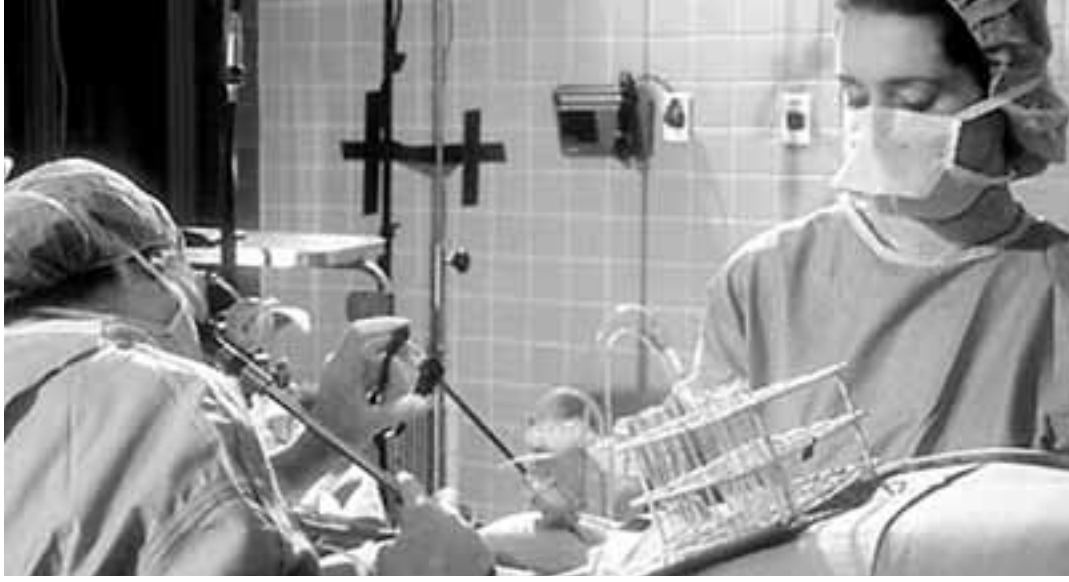
Για πρώτη φορά παγκοσμίως μια γυναίκα στη Βρετανία έφερε στον κόσμο ένα υγιέστατο αγοράκι με χρήση μιας ασφαλέστερης μεθόδου εξωσωματικής γονιμοποίησης (IVF).

το σύνδρομο, οι ωοθήκες της αντί να παράγουν λίγα ωάρια, όπως επιθυμούν οι ειδικοί, παράγουν πολύ μεγάλο αριθμό ωαρίων ως απόκριση στα ισχυρά φάρμακα που εκείνη λαμβάνει.