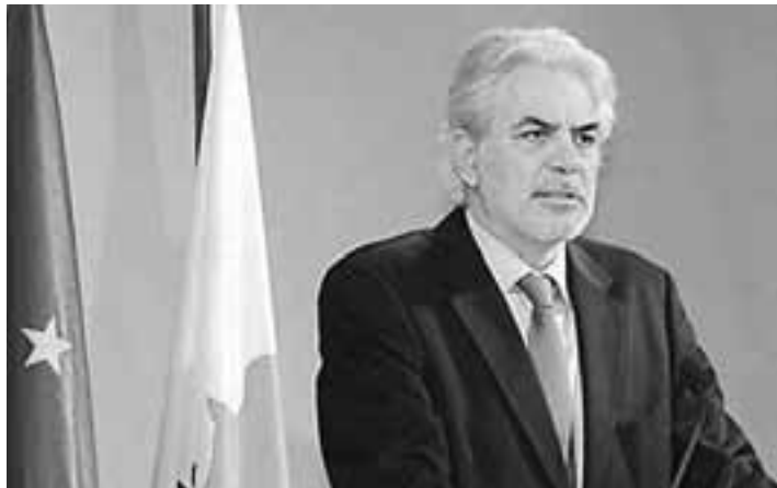
Ο κυβερνητικός εκπρόσωπος Χρήστος Στυλιανίδης.

«Για την κυβέρνηση η συνεπής και πειθαρχημένη εφαρμογή του