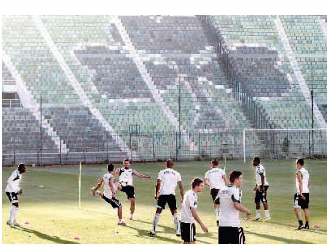
Στο «σπίτι» του, το θρυλικό «Απόστολος Νικολαΐδης» στη Λεωφόρο Αλεξάνδρας επέστρεψε χθες ο Παναθηναϊκός και πραγματοποιήσε την πρώτη του προπόνηση εν όψει του αγώνα μπαράζ με την Ξάνθη.