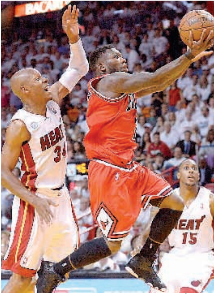
NBA: Σκληρό καρδίι οι Μπουλς

Απ' ό,τι φαίνεται, οδηγούμαστε σε ένα μίνι σιριαλ το οποίο κανένας δεν μπορεί να προβλέψει που θα καταλήξει.