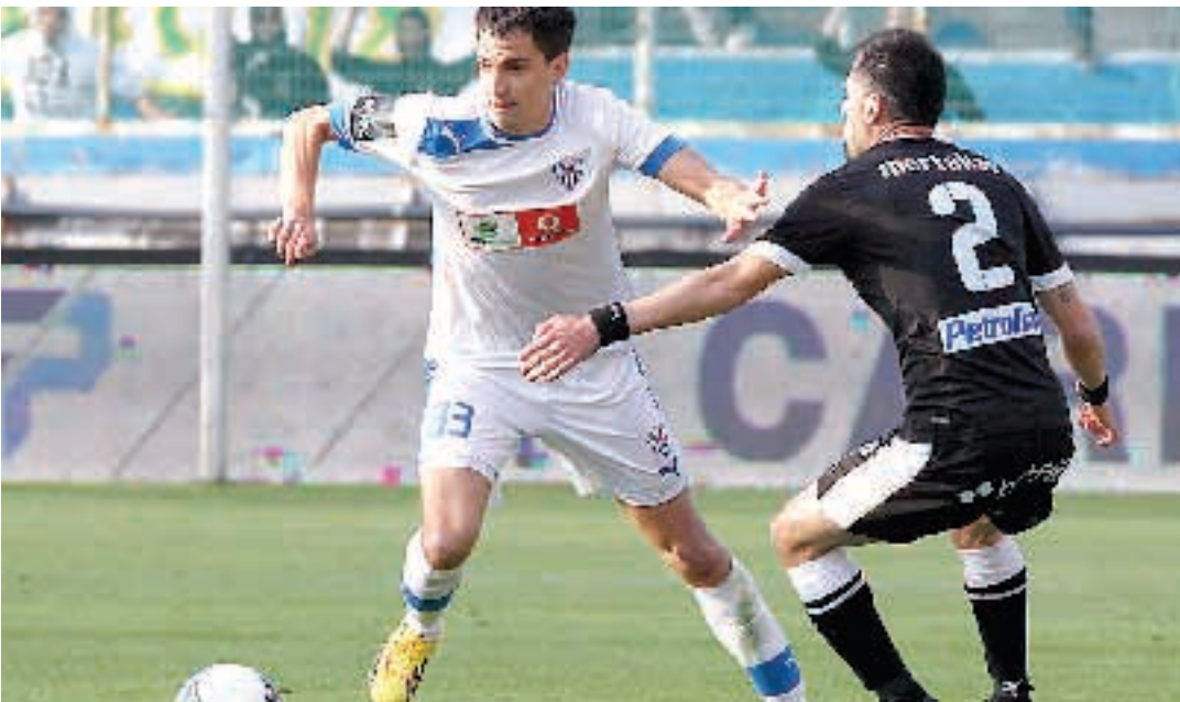
Η πτώση της απόδοσης του Ιλιτς και οι εμφάνισεις του Ζόρζε έφεραν την Ανόρθωση εκτός στόχων.

ΛΕΥΚΩΣΙΑ. (Πραφείο Εθνικού Κύρουκα). Η απόλυτη της αμυντικής συνοχής της Ανόρθωσης στο καταστροφικό διάστημα Φεβρουαρίου - Απριλίου έχει τρεις βασικές εξηγήσεις: