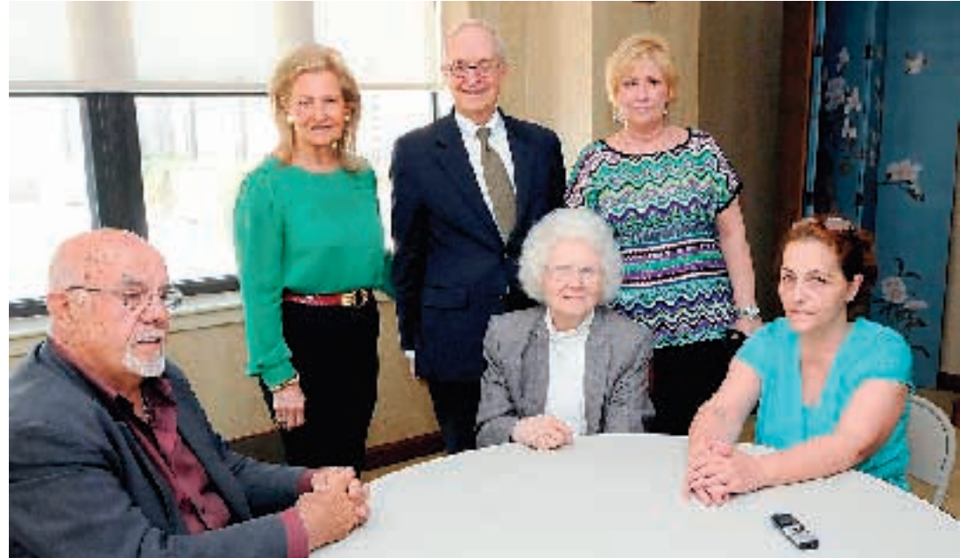
ΕΘΝΙΚΟΣ ΚΗΡΥΞ/ΚΩΣΤΑΣ ΜΠΕΗ

πολύ και το είχε πολύ ανάγκη κι η δε κ. Τσιβιδάκη γιατί «καθόλου δεν το πίστευε».