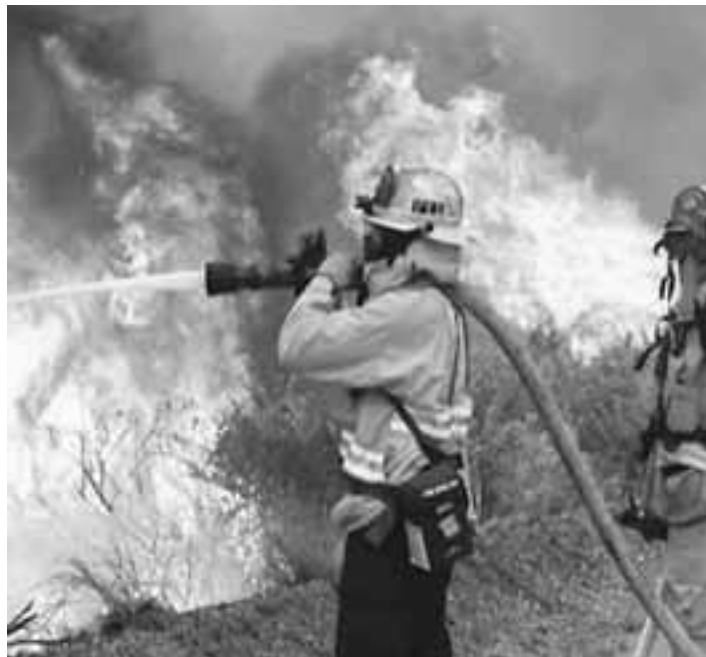
Πυροσβέστης δίνει μάχη αποφασιστικά με τις τεράστιες φλόγες 17 ποδιών που απειλούσαν την οικία ομογενή.