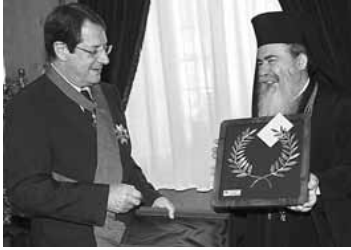
Συνάντηση με τον Πατριάρχη Ιεροσολύμων Θεόφιλο Γ' είχε στο Ελληνορθόδοξο Πατριαρχείο, στην Ιερουσαλήμ, ο πρόεδρος της Δημοκρατίας Νίκος Αναστασιάδης.

Στη συνέχεια, ο Πατριάρχης Ιεροσολύμων αναγόρευσε τον πρόεδρο Αναστασιάδη Μέγα Σταυροφόρο του Τάγματος των Ορθοδόξων Ιπποτών του Πανα-