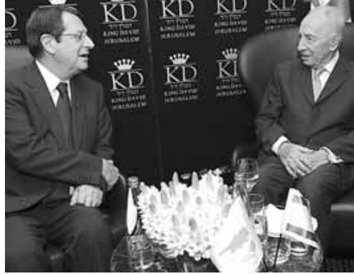
Ο πρόεδρος του Ισραήλ Σιμόν Πέρες παρέθεσε γεύμα εργασίας προς τιμή του προέδρου της Κυπριακής Δημοκρατίας Νίκου Αναστασιάδη και της συνοδείας του, κατά τη διάρκεια της τριήμερης επίσκεψης του Προέδρου στο Ισραήλ.

Ερωτηθείς αν το Ισραήλ αντιμετωπίζει θετικά το θέμα δημιουργίας τερματικού στην Κύπρο, ο Πρόεδρος της Δημοκρατίας είπε ότι «είμαστε στο στάδιο των διαβουλεύσεων» αλλά και πως «υπάρχει έκδηλο το ενδιαφέρον από ισραηλινές εταιρείες που εμπλέκονται στην αξιοποίηση του φυσικού αερίου να είναι και συμμε-