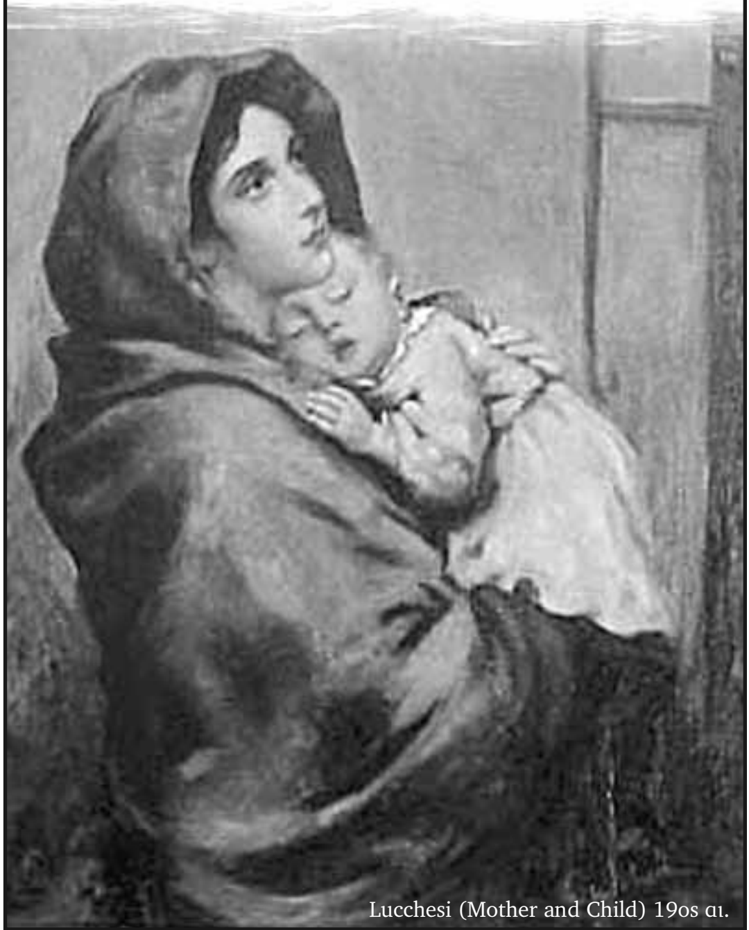
Lucchesi (Mother and Child) 19ος αι.

Βέβαια όλα αυτά τα τελετουργικά και φαντασμαγορικά προσόδια μια φολκλορική κίνηση και αίσθηση. Το ζητούμενο είναι η ουσία η οποία δεν εκφράζεται με λόγια αλλά με βιωματική μετοχή.