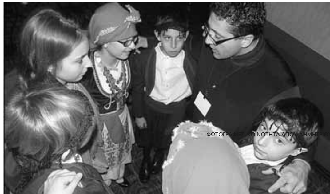
ΦΩΤΟΓΡΑΦΙΑ ΚΟΙΝΟΤΗΤΑΣ ΑΓΙΟΥ ΔΗΜΗΤΡΙΟΥ

Σύμφωνα με τον π. Κυριάκου, η κοινότητα συγκροτείται «από 165 οικογένειες» και συμπλήρωσε πως «οι περισσότεροι