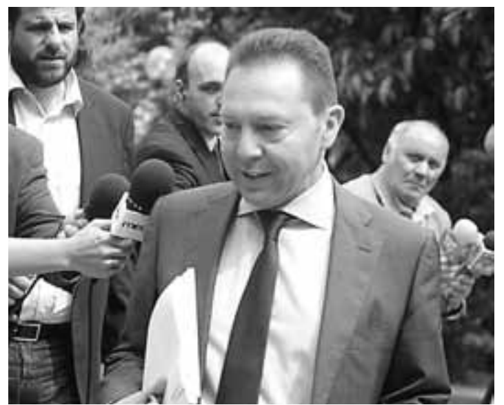
Ο υπουργός Οικονομικών Γ. Στουρνάρας έξω από το Μαξίμου.

Το ίδιο ισχύει και στην περίπτωση της Ελλάδας, η οποία κατατάσσεται -για το 2012- στη 17η θέση μεταξύ των 27 κρατών-μελών, με βάση το ποσοστό των εργαζομένων ηλικίας 25-34 ετών με πανεπιστημιακό πτυχίο. Το ποσοστό αυτό πλησιάζει το 35%.