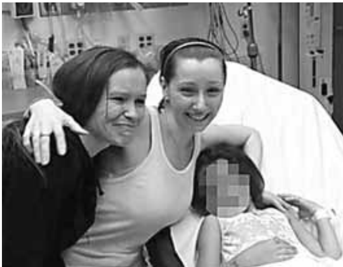
«NEW YORK DAILY NEWS»

Σύμφωνα με τον γιατρό Τζέραλντ Μαλόι, και οι τρεις είναι «σε καλή κατάσταση». «Αυτό δεν είναι το τέλος που συνήθως έχουμε σε τέτοιες περιπτώσεις, συνεισφέρει εμείς χαρούμενοι. Είμαστε χαρούμενοι γι' αυτές» τόνισε, μεταξύ άλλων, ο γιατρός μιλώντας προς τους δημοσιογράφους. Ο ίδιος, όμως, αρνήθηκε να σχολιάσει πληροφορίες των Μέσων Ενημέρωσης ότι μαζί με τις τρεις γυναίκες βρέθηκαν και δύο παιδιά.