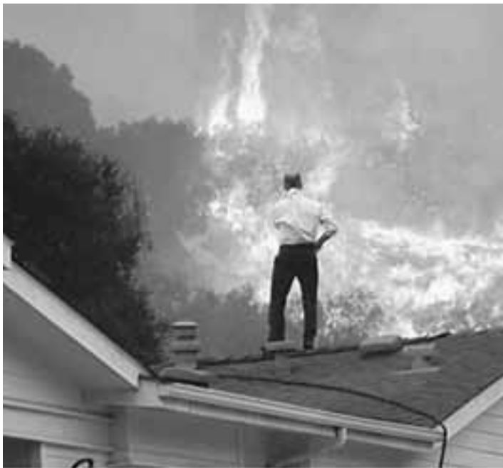
Κάτοικος της Καλιφόρνιας ανεβασιμένος πάνω στη σκεπή του σπιτιού βλέπει τις τεράστιες φλόγες να πλησιάζουν.