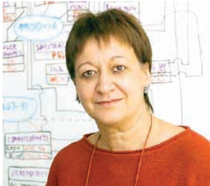
Η αστροφυσικός της Αμερικανικής Διαστημικής Υπηρεσίας (NASA) Χρύσα Κουβελιώτου, η οποία επελέγη ως νέο μέλος της Εθνικής Ακαδημίας Επιστημών των Ηνωμένων Πολιτειών.

Όπως έχει δηλώσει η κ. Κουβελιώτου, «όταν ήμουν ακόμα στην Ελλάδα, παρακολούθησα τον Νιλ Αρμστρονγκ να κάνει το διάσημο βήμα του στο φεγγάρι. Γοητεύτηκα τόσο που αποφάσισα αμέσως ότι ήθελα να γίνω αστροναύτης. Ομως, δεν υπήρχαν Έλληνες αστροναύτες κι έτσι επέλεξα ένα άλλο μονοπάτι: την Αστρονομία».