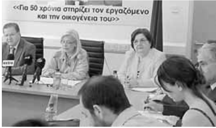
Η υπουργός Εργασίας και Κοινωνικών Ασφαλίσεων Ζέτα Αιμιλιανίδου ανακοινώνει τα μέτρα για μείωση της ανεργίας.

Σύμφωνα με τα στατιστικά στοιχεία, τον Απρίλιο του 2013 οι καταγεγραμμένοι άνεργοι ήταν 45.000 εκ των οποίων οι 33.500 ήταν Ελληνοκύπριοι.