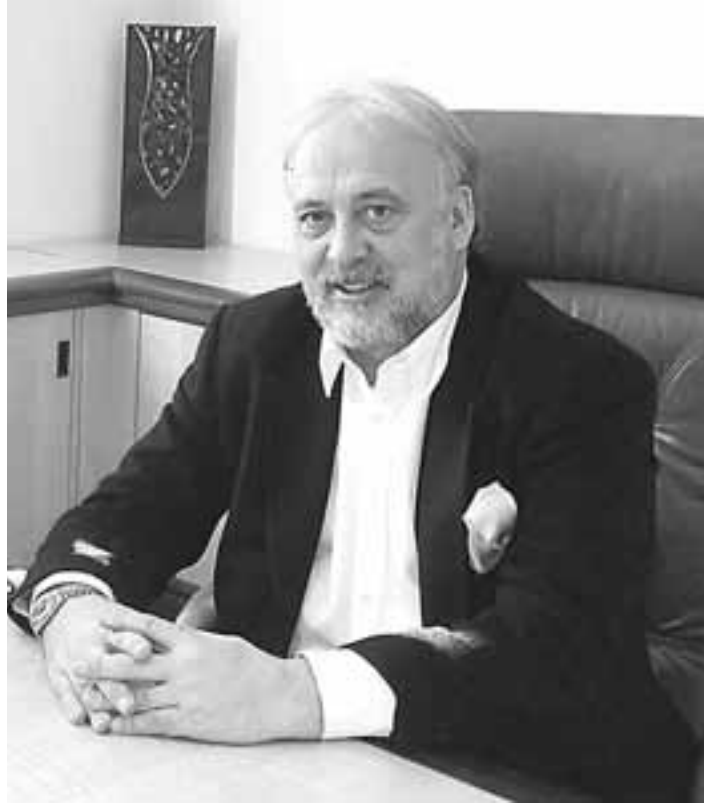
ΕΘΝΙΚΟΣ ΚΗΡΥΞ/ΚΩΝΣΤΑΝΤΙΝΟΣ ΣΥΡΙΓΟΣ

«Εγώ ψήφισα υπέρ του Αντώνη Σαμαρά, αλλά πάντα