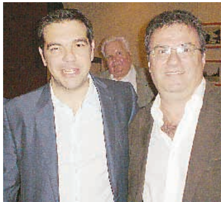
Ο επικεφαλής του ΣΥΡΙΖΑ, Αλέξης Τσίπρας με τον Σταύρο Κυριόπουλο, πρόεδρο της ελληνικής κοινότητας του Σάο Πάολο.