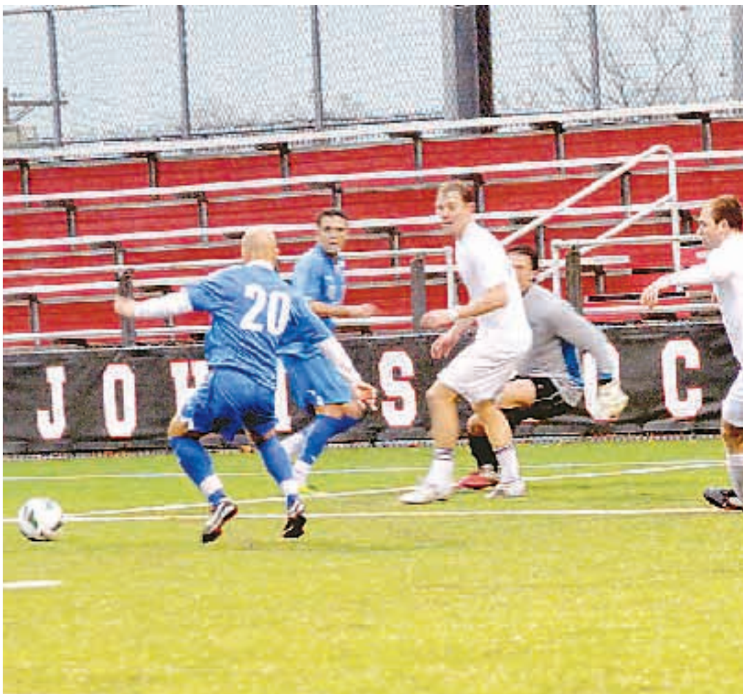
ΕΘΝΙΚΟΣ ΚΗΡΥΞ/ΝΤΙΝΟΣ ΑΥΛΩΝΙΤΗΣ

Το στραπάτσο από την Βέροια δεν θα μείνει ατιμώρητο - Στρώνουν χαλί στον Πρίγκιπα οι μέτοχοι