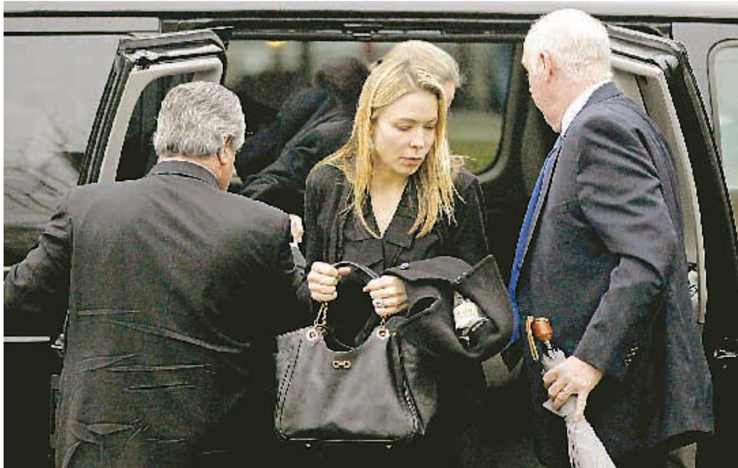
Το τελευταίο αντίο στα δύο από τα είκοσι ανήλικα θύματα του πρωτοφανούς μακελειού στο Δημοτικό σχολείο «Σάντι Χουκ» ετοιμάζονταν να πουν χθες συγγενείς, φίλοι αλλά και εκατοντάδες απλοί άνθρωποι της μικρής κοινότητας του Νιουτάουν.