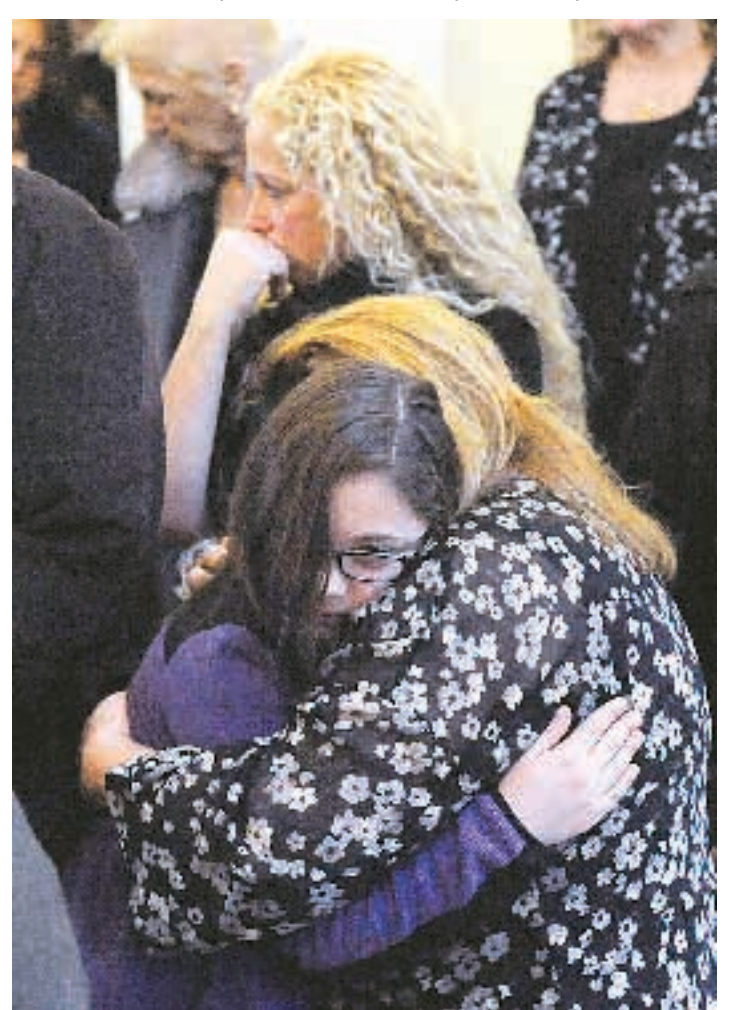
Μικρό κοριτσάκι στην αγκαλιά της μητέρας του κλαίει για το μεγάλο κακό που βρήκε το σχολείο του στο Νιούτουν.

Στα παιδιά να λέμε ότι «ο Θεός αγαπά, είναι καλοσύνη, φροντίδα και δεν το έκανε Εκείνος, αλλά εμείς οι άνθρωποι το κά-