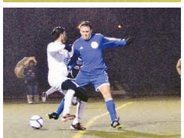
ΕΘΝΙΚΟΣ ΚΗΡΥΞ/ΝΤΙΝΟΣ ΑΥΛΩΝΙΤΗΣ