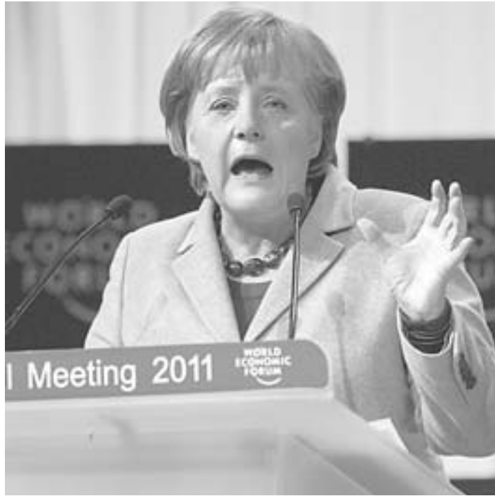
Η καγκελάριος, Αγγελια Μέρκελ, κατά την ομιλία της στις εργασίες του Παγκόσμιου Οικονομικού Φόρουμ στο Νταβός.

χρησιμοποιήσει την κρίση ώστε να προωθήσει αλλαγές στην ευρωζώνη, πιέζοντας τους Ευρωπαίους εταίρους για ριζοσπαστικές μεταρρυθμίσεις στις οικονομίες τους.