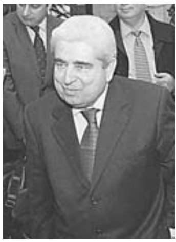
Ο πρόεδρος της Δημοκρατίας Δημήτρης Χριστόφιας.

Την Παρασκευή, ο υπουργός Εξωτερικών της Παλαιστινιακής Αρχής, Ριάντ Μάλκι, είχε γίνει δεκτός από τον Δημήτρη Χριστό-