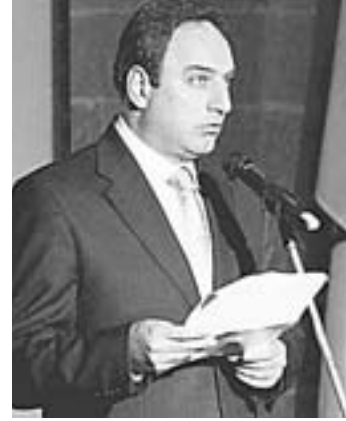
Ο κυβερνητικός εκπρόσωπος Στέφανος Στεφάνου.

Σύμφωνα με το νομοσχέδιο, ο Υπουργός δύναται να εκδώσει διάταγμα με το οποίο να καθορίζει, για περίοδο μέχρι 45 ημερών, ανώτατες τιμές πώλησης όταν το ύψος των τιμών είναι σε υπερβολικά πιο ψηλό επίπεδο από ό,τι δικαιολογείται από τις