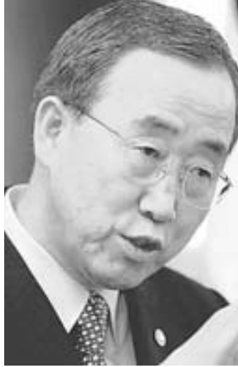
Ο γενικός γραμματέας του ΟΗΕ, Μπαν Κι Μουν.

Σύμφωνα με τις πληροφορίες, τα Ηνωμένα Έθνη θα επιχειρήσουν να σπασούν το αδιέξοδο και να δημιουργήσουν συνθήκες για επίτευξη των συζητήσεων, διαμορφώνοντας ένα σκηνικό που θα δίνει την εντύπωση πως όλοι εξήλθαν από τη συνάντηση με κέρδος. Όπως σημειώνουν ενημερωμένες πηγές, ο διεθνής οργανισμός θα επιχειρήσει να παρουσιάσει τις συζητήσεις που επιτεύχθηκαν στα κεφάλαια Διακυβέρνησης, Οικονομίας και ΕΕ και δεν αποκλείεται επί τόπου να