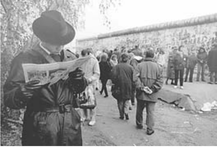
Η πτώση του Τείχους του Βερολίνου «πρωταγωνιστεί» σε έκθεση φωτογραφίας που παρουσιάζεται στη Θεσσαλονίκη.