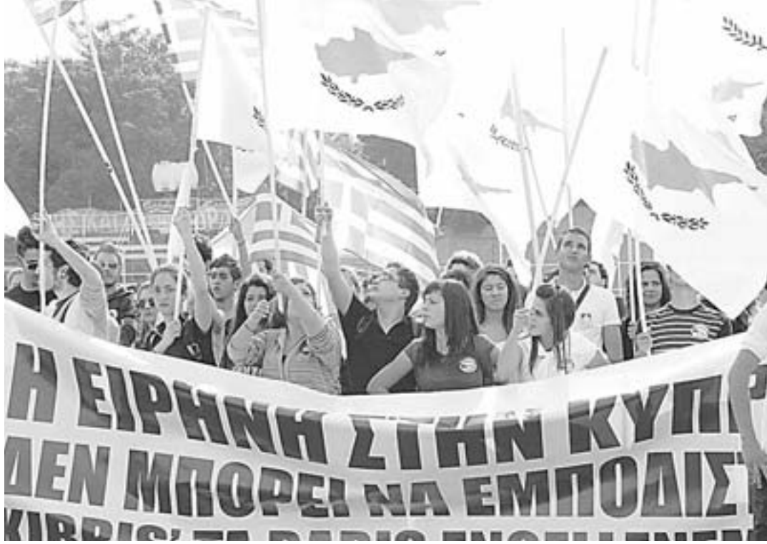
Η Παγκύπρια Ομοσπονδία Φοιτητικών Ενώσεων και η Παγκύπρια Συντονιστική Επιτροπή Μαθητών πραγματοποίησαν αντικατοχική εκδήλωση με την ευκαιρία της ανακήρυξης του ψευδοκράτους.

Η πραγματοποίηση πανηγυρικών εορτασμών για την παράνομη ανακήρυξη του ψευδοκράτους, με πρωταγωνιστή μάλιστα τον διαπραγματευτή της τ/κ κοινότητας και με την παράνομη παρουσία Τούρκων αξιωματούχων σ' αυτούς, δείχνει ότι η τουρκική πλευρά έχει έλλειψη καλής θέλησης και δεν πείθει ότι θέλει λύση, τόνισε σε χθεσ-