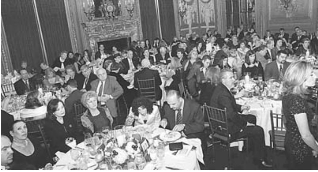
Αριστερά, διακρίνονται οι ομογενείς ενώ παρακολουθούν με ενδιαφέρον τη βράβευση του ζεύγους Καλοειδή. Δεξιά, ο Αρχιεπίσκοπος Αμερικής Δημήτριος, ενώ απονέμει το Βραβείο του