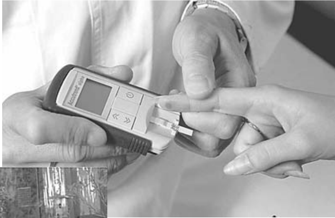
Η Κάρεν Κρίστιαν (αριστερά) είναι μια από τα εκατομμύρια των Αμερικανών που πάσχουν από διαβήτη Τύπου 2.

παιλιότερα φάρμακα, τα οποία όπως έχει αποδειχθεί από έρευνες, είναι λιγότερο ακριβά και ταυτόχρονα το οποίο αποτελεσματικά με τα νεότερα.