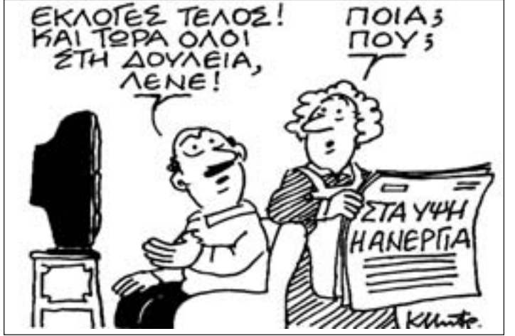
Του ΚΩΣΤΑ ΜΗΤΡΟΠΟΥΛΟΥ από «ΤΑ ΝΕΑ»

«Θεσσαλονίκη» Θρίαμβος. Αλλαγή στο δήμο Θεσσαλονίκης έπετα από 24 χρόνια.