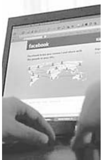
Και υπηρεσία ηλεκτρονικού ταχυδρομείου αναμένεται να προσφέρει το facebook.

«Πρόκειται για μια ισχυρή δήλωση της πίστης μας στο λαμπρό μέλλον της μετοχικής εξορύξεως», δήλωσε μεταξύ άλλων ο πρόεδρος και διευθύνων σύμβουλος της Caterpillar Νταγκ Ομπερξέλμαν.