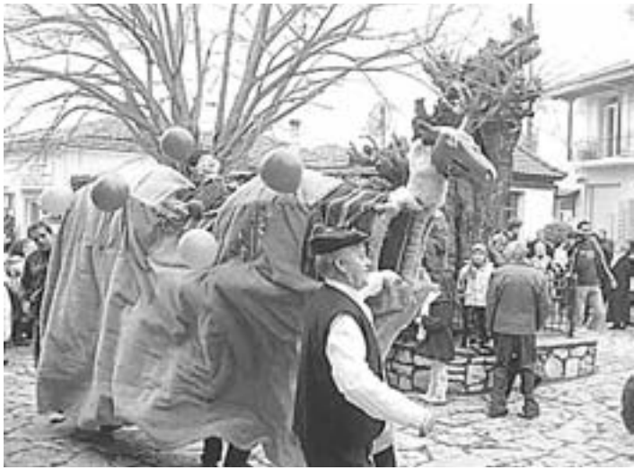
Το δρώμενο της καμύλας θα αναβιώσει, από σήμερα το βράδυ, σε χωριά του νομού Ροδόπης και στους μαχαλάδες της Κομοτηνής, με αφορμή το Κουρμπάν Μπαϊράμ, τη Γιορτή της Θυσίας, που γιορτάζουν οι μουσουλμάνοι.

Λουτράκι Άγνωστος φορώντας κουκούλα, προκάλεσε σοβαρές σωματικές βλάβες σε μια 57χρονη γυναίκα, όταν πλυσίωσε το αυτοκίνητο της την στιγμή που στάθμευε και με ένα σφυρί έσπασε το τζάμι και την χτύπησε στο κεφάλι, χωρίς να της αφαιρέσει κάτι. Στη συνέχεια ο άγνωστος επιβίβαστηκε σε Ι.Χ. επιβατικό το οποίο ήταν σταθμευμένο σε κοντινή απόσταση και στο οποίο τον περίμενε ο οδηγός και διέ-