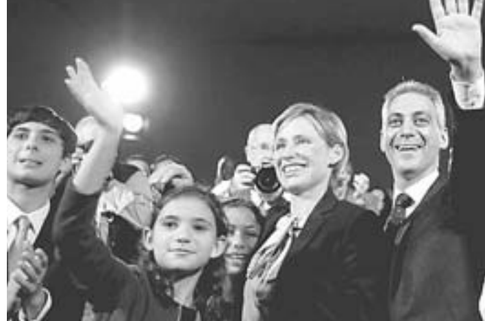
Ο Ραμ Ιμάνιουελ με την οικογένειά του αμέσως μετά την επίσημη ανακοίνωση της πρόθεσής του να είναι υποψήφιος για το δημαρχιακό θώκο του Σικάγο στις προσεχείς εκλογές.

Θα πρέπει, εξάλλου, να σημειωθεί ότι ο καιρός δεν είναι και τόσο κατάλληλος για να είναι κανείς δήμαρχος του Σικάγο. Η πόλη μόλις και μετά βίας συγκρατεί τα επιχειρηματικά συνέδρια και