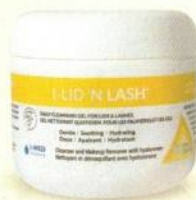
60 Pre-soaked Wipes