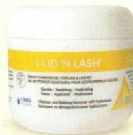
60 lingettes préimbibées