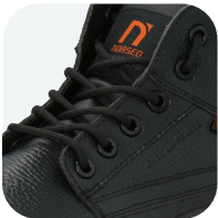
Capellada 90% CUERO 10% PU