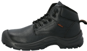
Suela PU doble densidad