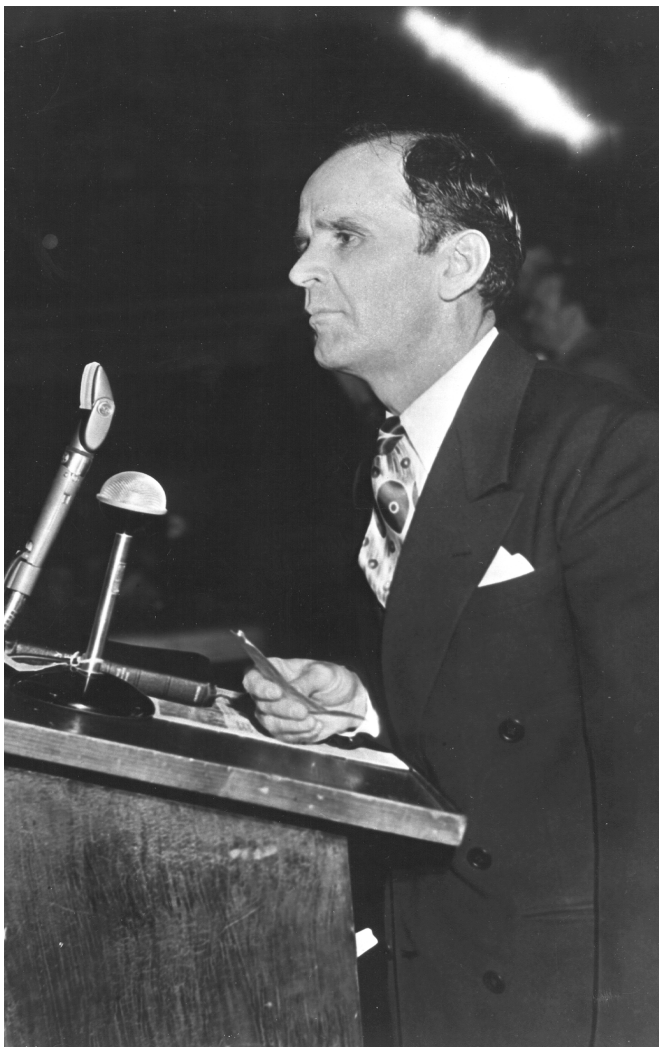
William Marrion Branham