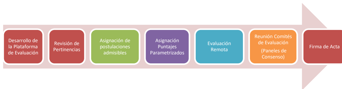
Figura 2: Proceso de evaluación.

En términos generales, el procedimiento de evaluación consiste en una serie de etapas (ver Figura 2), las que son detalladas en profundidad a continuación en este informe.