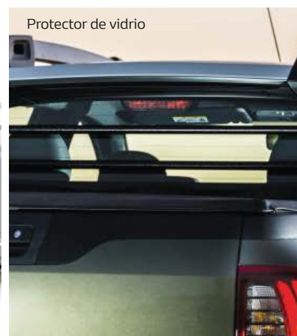
Protector de vidrio