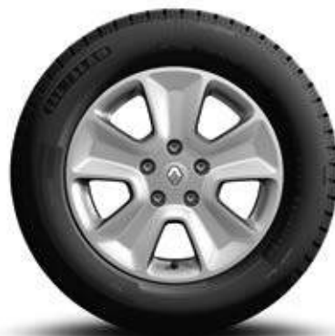
Llantas de 16" en plata