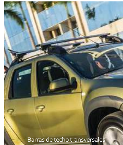
Barras de techo transversales