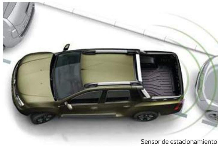
Sensor de estacionamiento