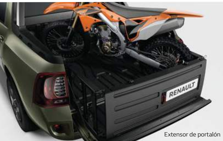
Extensor de portalón