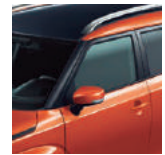
Naranja / Negro