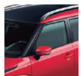
Rojo / Negro

Equipamiento según versión. Fotos referenciales. El fabricante y el importador se reservan el derecho a modificar las especificaciones sin previo aviso. Los detalles sobre especificaciones, equipamiento, disponibilidad de colores y la línea de accesorios dependen también de los requisitos y disposiciones locales, confirmarlos en el punto de venta. (*) Valor obtenido en mediciones de laboratorio según ciclo de ensayo de la Comunidad Económica Europea en el MTT, más información en www.consumovehicular.cl