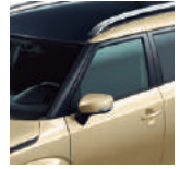
Beige / Negro