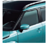
Azul Neón / Negro