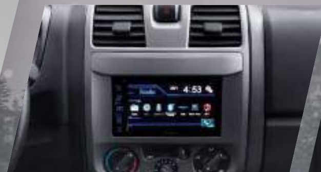
Radio MP5 con pantalla touch