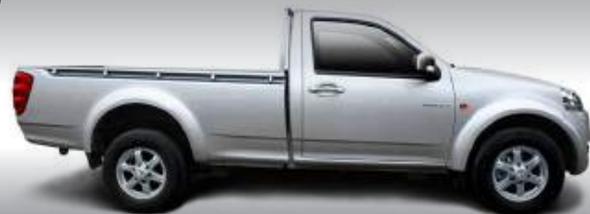
Cabina Simple en versiones Diesel 4x2 y 4x4 con capacidad de 1.000 Kg.