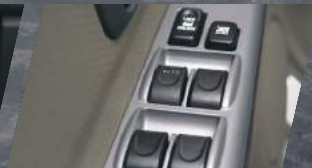
Completo Equipamiento Eléctrico