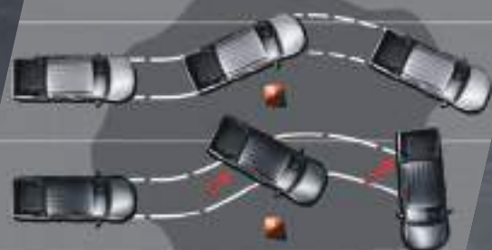
Frenos ABS + EBD