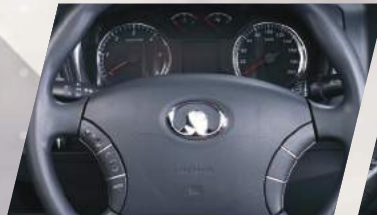
Volante con Control de Audio y Bluetooth