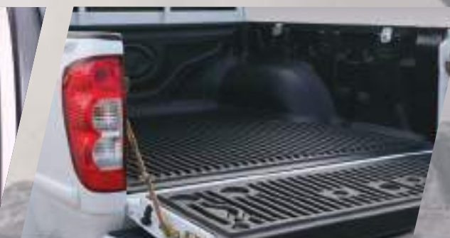
Capacidad de carga 750 Kg