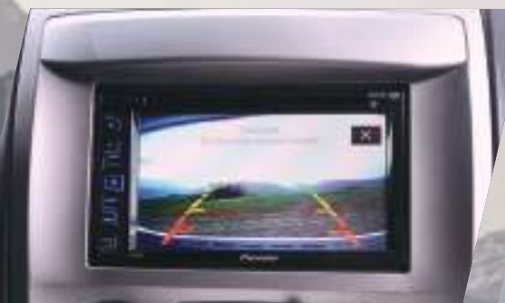
Cámara de Retroceso