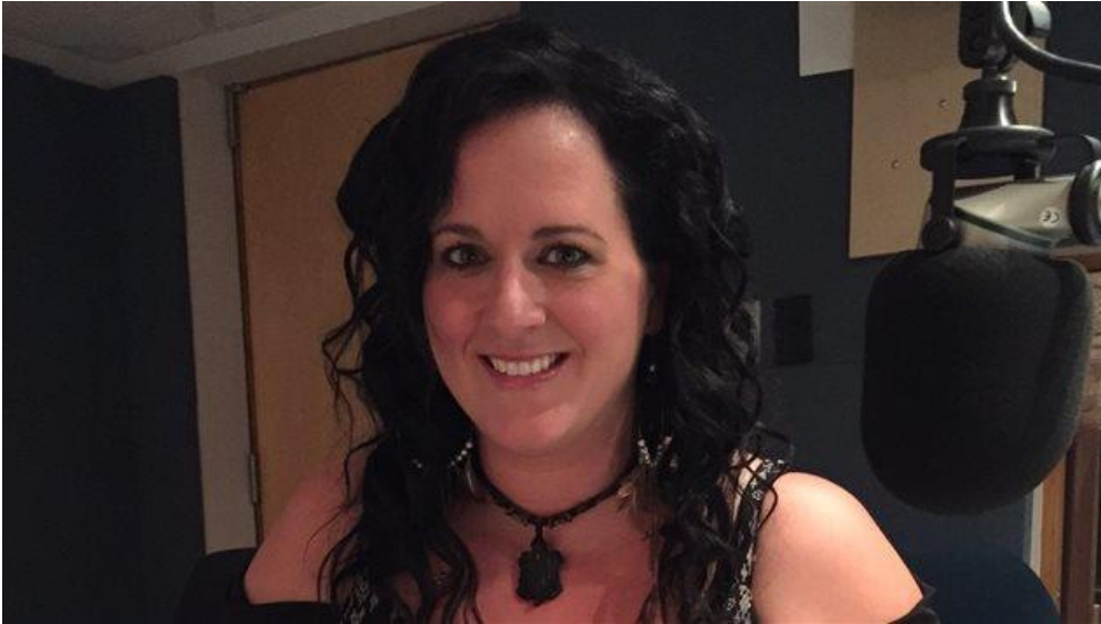
Jocelyne Baribeau