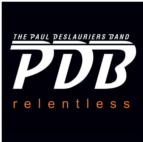
Titre: Relentless Date de sortie : 3 juin 2016 ACCES AUDIO