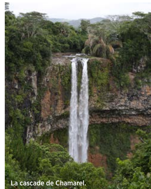
La cascade de Chamarel.

‘Impressionnante, cette cascade de 83 m de haut, dans cette verdure incroyable dont nous ne nous lassons pas’