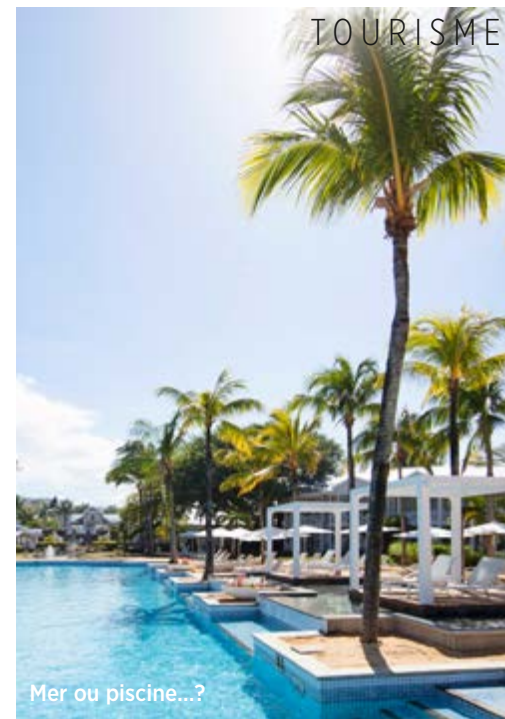
Mer ou piscine...?

Aujourd'hui, on se dégourdit les jambes. À une demi-heure de route, il y a la presqu'île Le Morne , avec la montagne du même nom et la lagune tout autour. La presqu'île a été classée Patrimoine universel de l'Unesco, pour la beauté de la nature mais aussi pour sa valeur historique. Au début du 19 e siècle, c'est ici que se cachaient les marrons (esclaves africains évadés), dans la forêt et les grottes. ▶