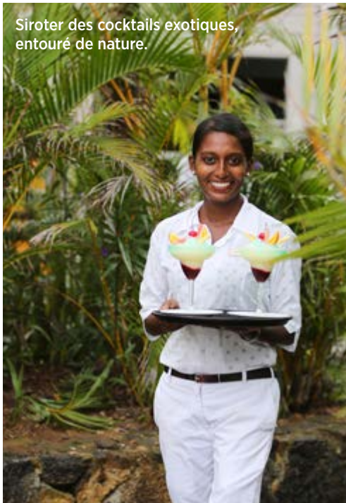
Siroter des cocktails exotiques, entouré de nature.