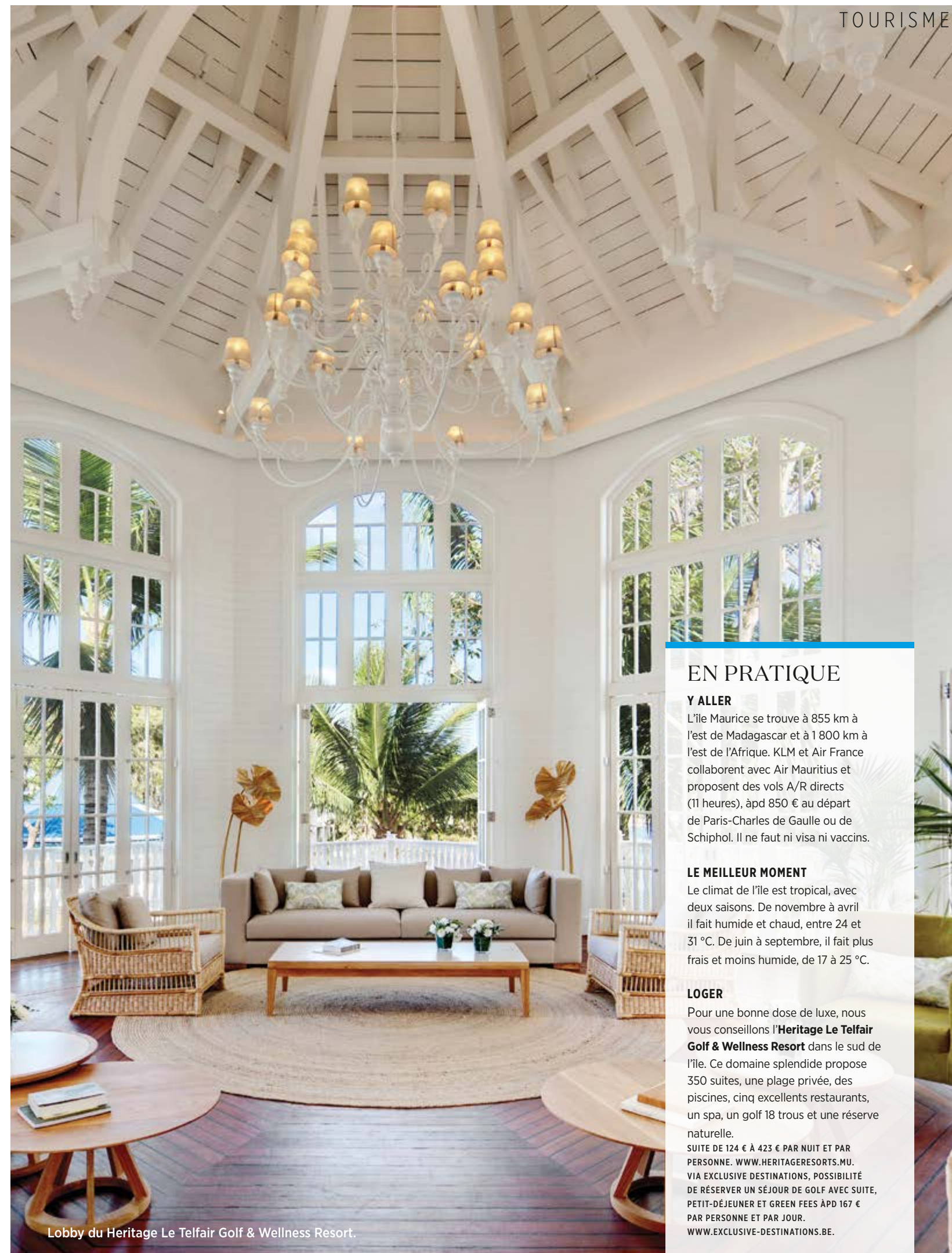
Lobby du Heritage Le Telfair Golf & Wellness Resort.

Comme c'est notre dernier jour, nous chinons un peu dans les échoppes de souvenirs. Qu'allons-nous ramener de ce voyage? Le dodo, dans divers matériaux, de la pierre précieuse au bois en passant par la corde, s'impose. Cet oiseau, qui n'a existé qu'ici, s'est éteint au 17 e siècle mais est resté bien vivant dans son statut d'attraction touristique. C'est donc un dodo — d'ébène, évidemment — qui rentrera avec nous.