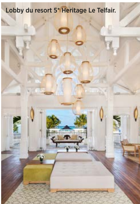
Lobby du resort 5* Heritage Le Telfair.