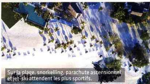
Sur la plage, snorkelling, parachute ascensionnel et jet-ski attendent les plus sportifs.