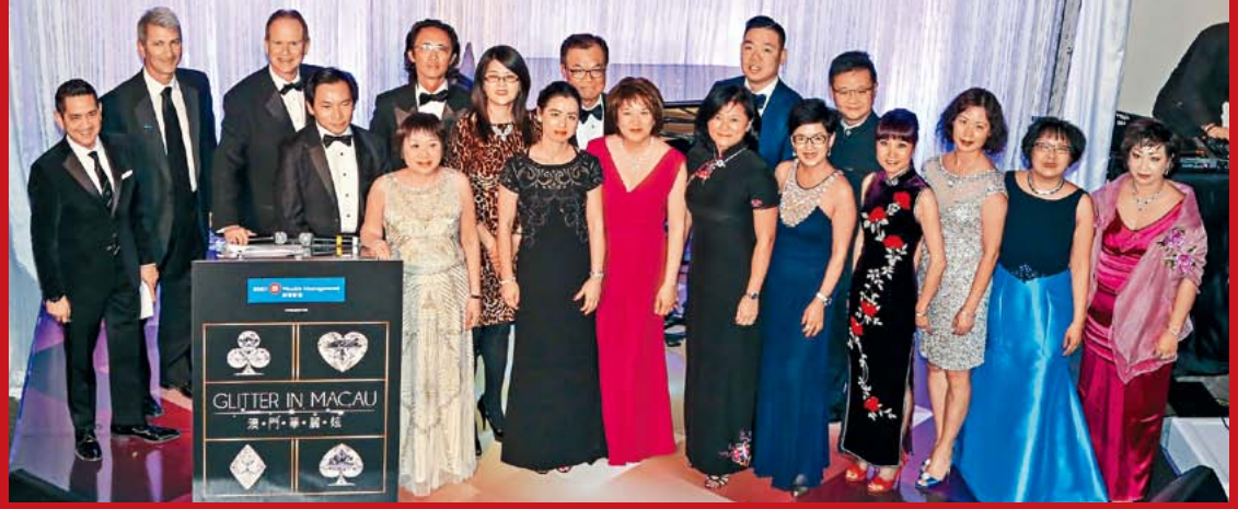
• SickKids 病童醫院華人顧問委員會與《澳門華麗炫》委員 2016 年合照。